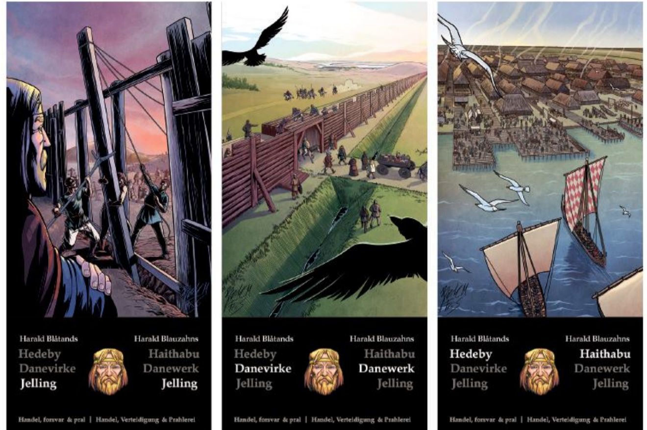
Gæsterne på de tre museer får fremover kort med motiver af tegneren Bjørk Matthias Friis med hjem.