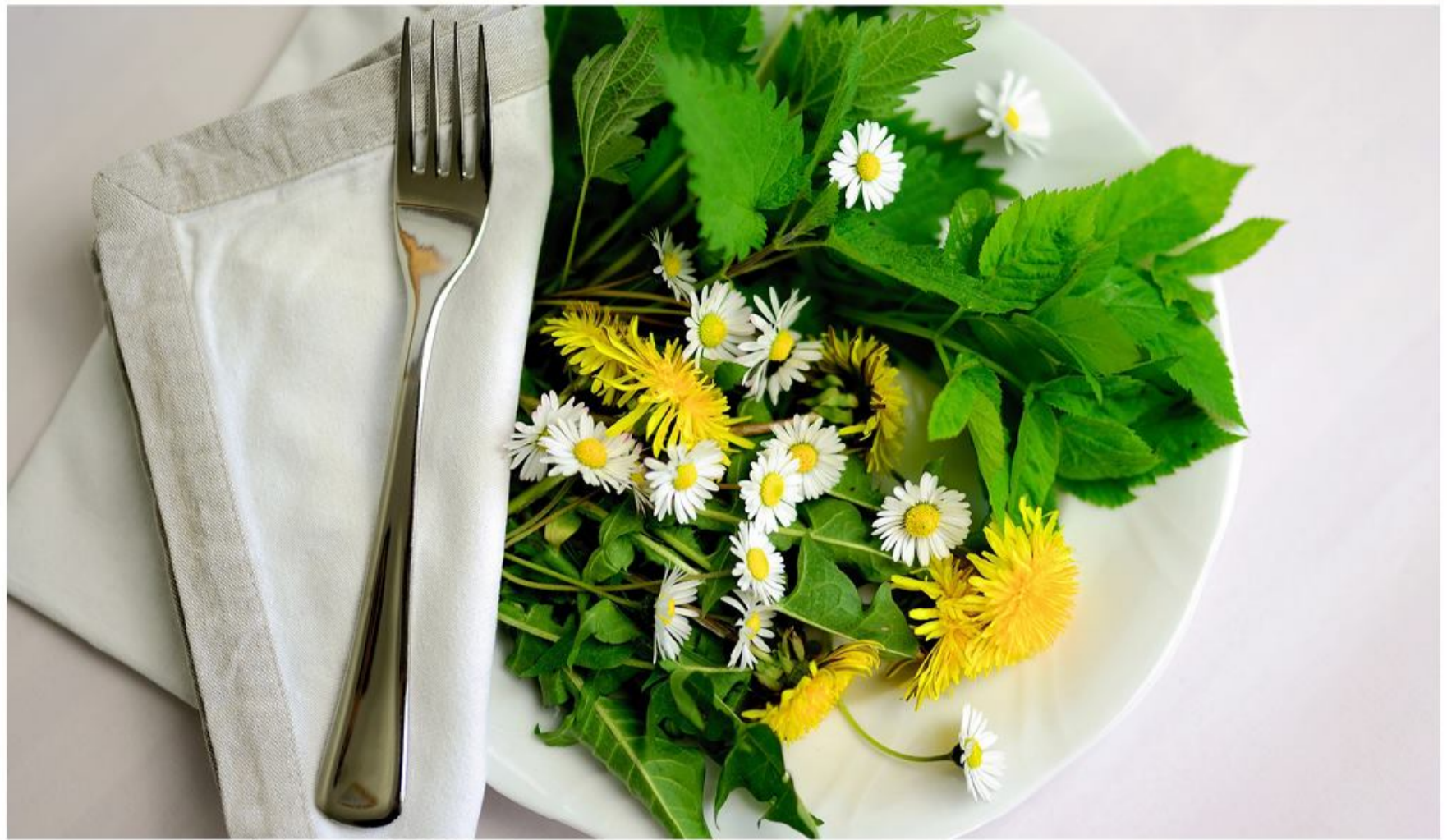
Det rette valg af fødevarer er en væsentlig del af en bæredygtig livsstil. Foredragsholder Dirch Lind har fokus på klimavenlig og bæredygtig kost.