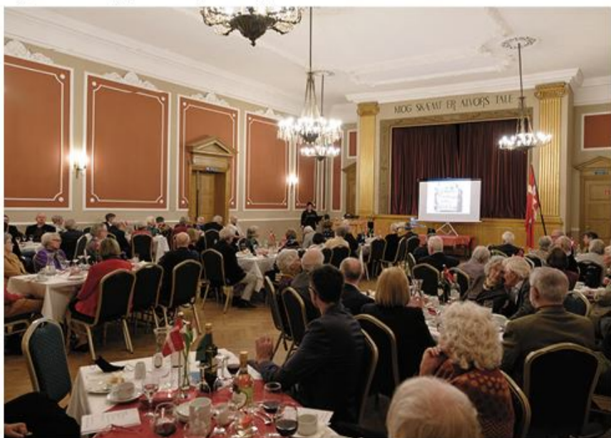
Boock og Lange Duo stod for aftenens underholdning.