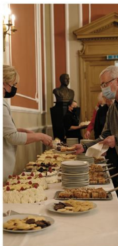
Sønderjysk kaffebord bød på mange lækre ting.