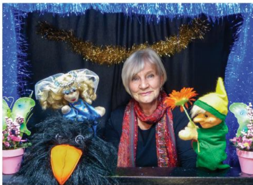
Lørdag den 26.3. kan Dolas Dukketeater opleves i Slesvig.