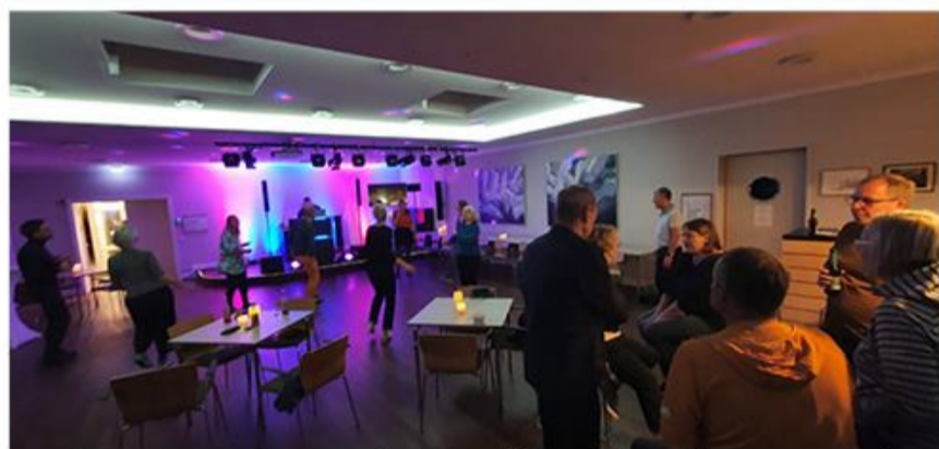
SSF Slesvig inviterer til sammenkomst med dans på Slesvighus.