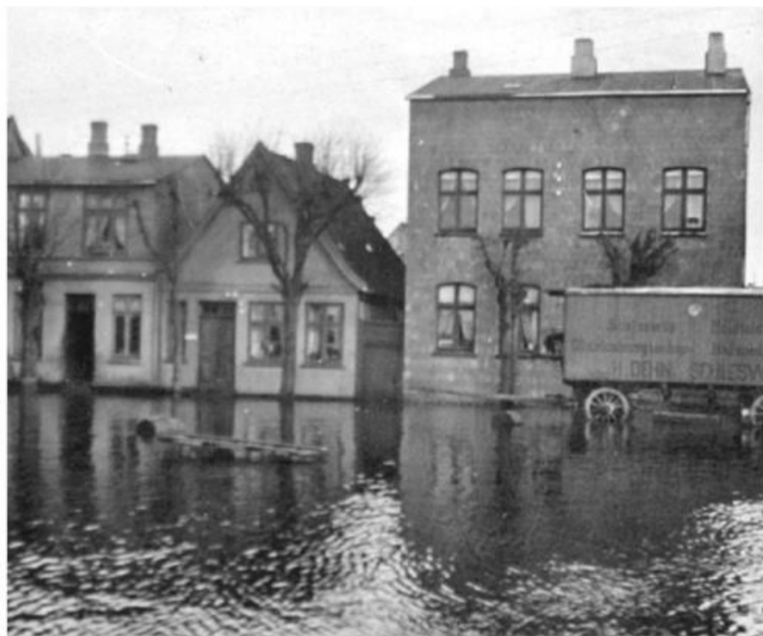
om højvande og stormfloder ved Slien.