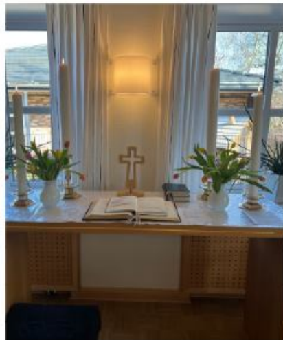
Alle er velkomne til vandring i Stiftungsland fredag den 25. marts.

Alle er velkomne Den Danske Kirke i Sporskifte