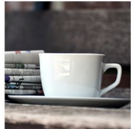
En god snack og en god kop kaffe. Så bliver det ikke meget bedre.