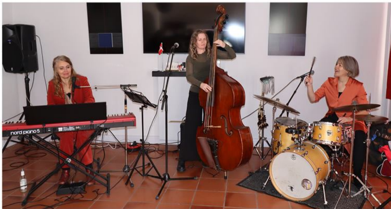
She-trio leverede primært stille jazznumre. Lige passende til en forårsøndag.