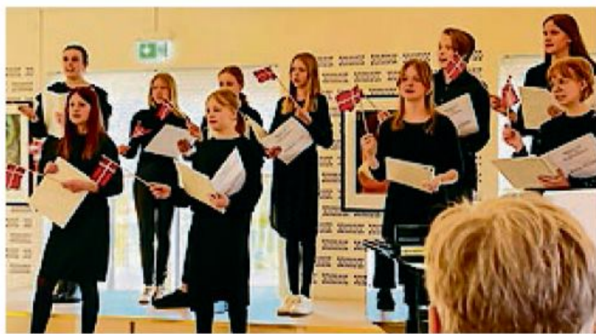
Vejsgaard kirkes ungdomskor er et af de samarbejdede kor ved koncerten i Ansgarkirken.