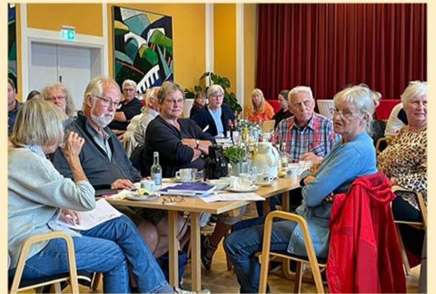
Generalforsamlingen handlede blandt andet om, hvilken rolle amtet spiller i forhold til distrikterne.