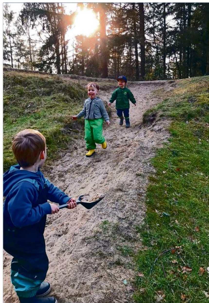
Frasch bjarnefritid bai e Ååstsii.