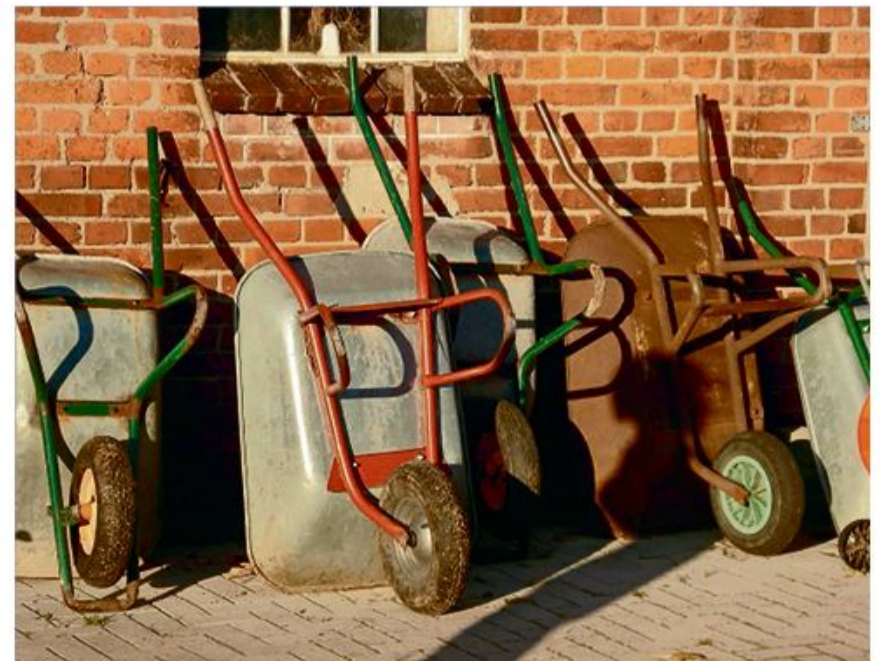
Trillebør er meget mere end et værktøj.

Alle i alderen mellem 6 og 99 år kan være med, der er dog en begrænsning på maksimalt 100 deltagere – forudsat man har en "normal" trillebør med mindst et hjul og uden nogen form for motorisering. Det ses også gerne, at trillebørene pyntes. Startgebyr er på 5 euro for børn og 10 euro for voksne. Fra klokken 11-12 er der teknisk kontrol på køretøjerne, og klokken 13 starter ræsset. Tilmelding foregår via schubblade-lund@gmx.de og skal gerne indgå senest lørdag den 14. maj.