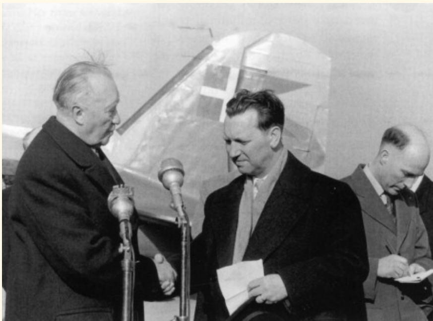
Forbundskansler Konrad Adenauer modtager statsminister H.C. Hansen den 29. marts 1955 som optakt til underskrivelsen af København-Bonn erklæringerne.

samarbejde med den slesvigholstenske landsregering ville finde en løsning på spørgsmålet.