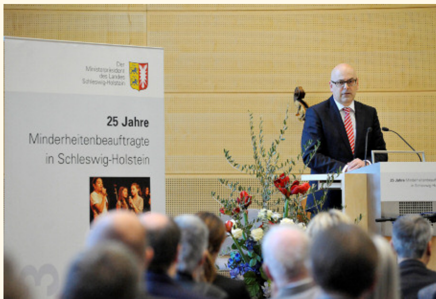
Ministerpräsident Torsten Albig på talerstolen ved markeringen i Landdagen af de første 25 år med en officiel mindretalsrådgiver i Slesvig-Holsten.