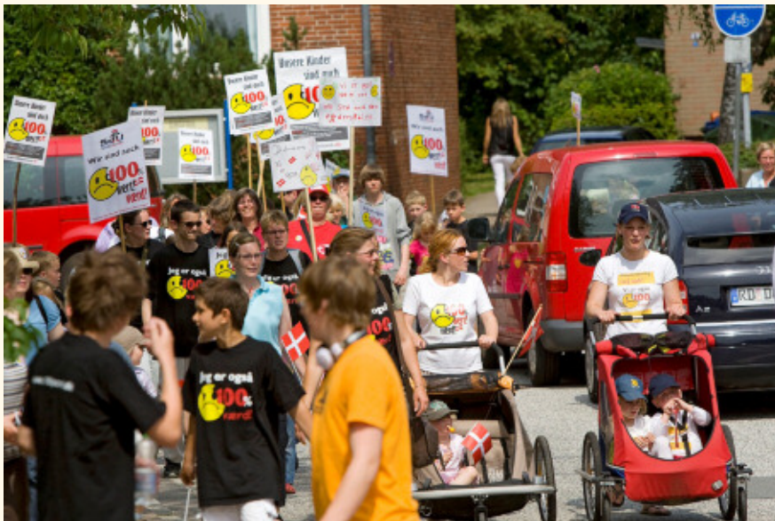
Dansk mindretalsdemonstration i 2010 i Rendsborg mod ophævelsen af de danske skolars ligestilling m.h.t. elevtilskud.

Det bevirkede, at der i efteråret 2010 blev nedsat en dansk-slesvig-holstensk arbejdsgruppe ”til behandling af ligestillings spørgsmål ved finansieringen af det danske og det tyske mindretals skoler”. Det viste sig her, at elevtilskuddet til det tyske mindretals skoler i 15 år