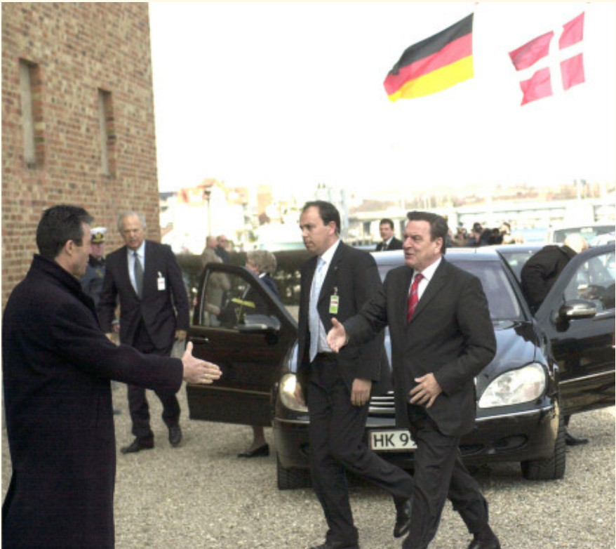
Statsminister Anders Fogh Rasmussen tager i Sønderborg imod forbundskansler Gerhard Schröder ved markeringen af København-Bonn erklæringernes 50-års jubilæum.

I en fælles erklæring tilkendegav statsminister Anders Fogh Rasmussen og forbundskansler Gerhard Schröder, at København-Bonn erklæringerne har fremmet og sikret den fredelige sameksistens mellem mindretallene på begge sider af den dansk-tyske grænse og banet vejen