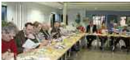
SSH er en selskabelig forening, der en gang om året deler penge ud til projekter og ildsjæle i Sydslesvig.

SSH: Det er så nemt, vi udbetaler dit kontingent.