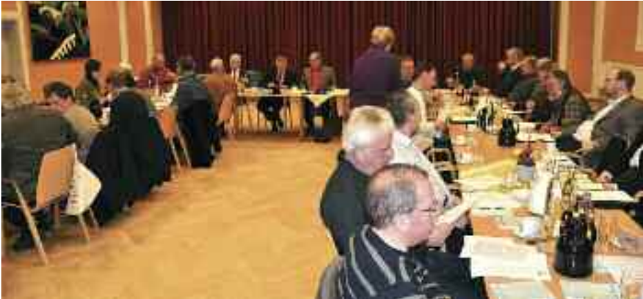
Hovedstyrelsen, her fra et møde på Flensborghus, er SSFs øverste myndighed mellem landsmøderne. Møderne er åbne, og emnerne der diskuteres fatter bredt; dog behandles byggesager ikke for åbent tæppe.

foreningen præsenterer, hører ligeledes til de nye initiativer, der skal fremtidssikre foreningen og kulturarbejdet.