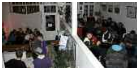
Fredagsbar i Aktivitetshusets café. Også når der er koncert eller film open air, er der fuldt hus.