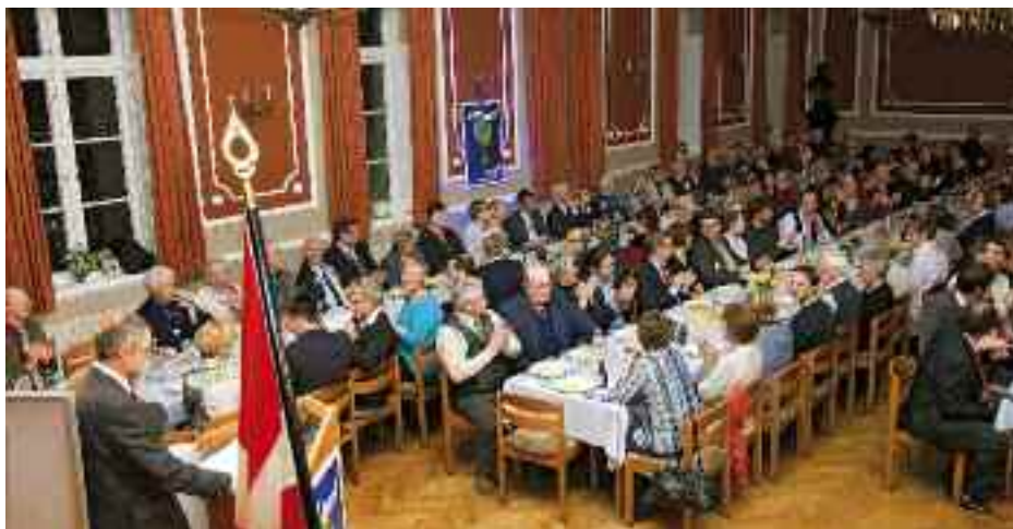
På SSWs nytårsreception åndede alt endnu fred og ro - sådan da.

Landsregeringens udspil af 26. maj 2010 om at beskære delstatens tilskud til det danske mindretals skoler fra 100% til 85% af gennemsnitsudgifterne for elever i de offentlige skoler er et ka-