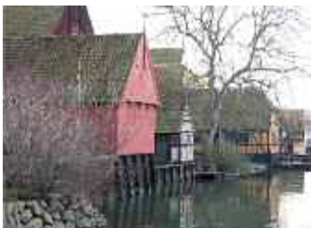
Den gamle By i Århus - et tilløbsstykke: 150 personer fra Flensborg amt drog afsted ind under julen 2009 i tre busser.