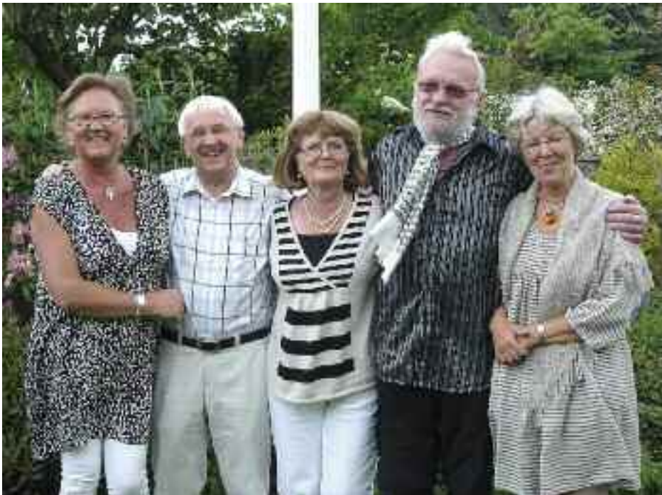
Teater- og koncertudvalget.