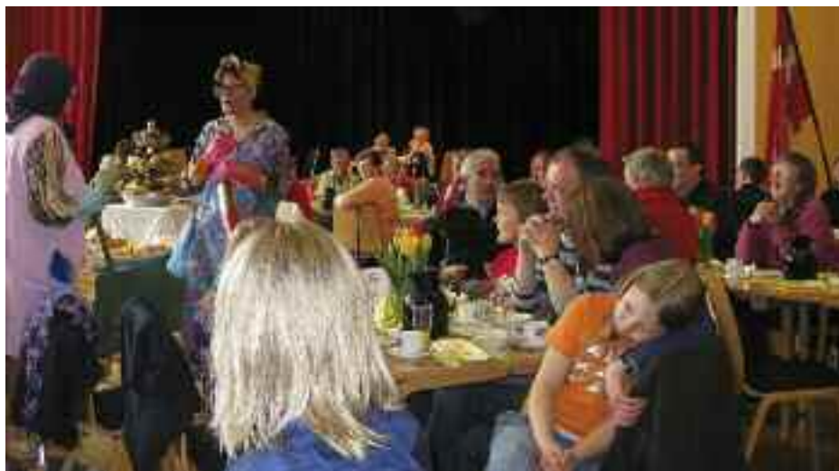
Amtets familiebrunch på Flensborghus var velbesøgt, og der var sørget for morsom underholdning.

Juleturen 2009, som denne gang gik til Den gamle By i Århus, var et tilløbsstykke. Vi var undervejs med næsten 150 personer i 3 busser, som først havde mulighed for et par timers shopping i centrum af Århus og derefter var i Den gamle By, indtil mørket faldt på.