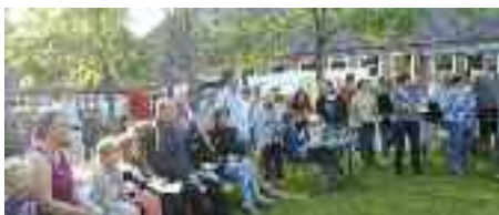
Ved sankthans mødtes man på Hans Helgesen-Skolen bl.a. for at brænde børnenes heks af.

skellige foreninger imellem om arrangementer til caféerne fungerer fint. Om man i fremtiden vil bibeholde de ugentlige møder eller måske få dem placeret anderledes i kalenderen, vil tiden vise og er jo op til de enkelte distrikter at afgøre.