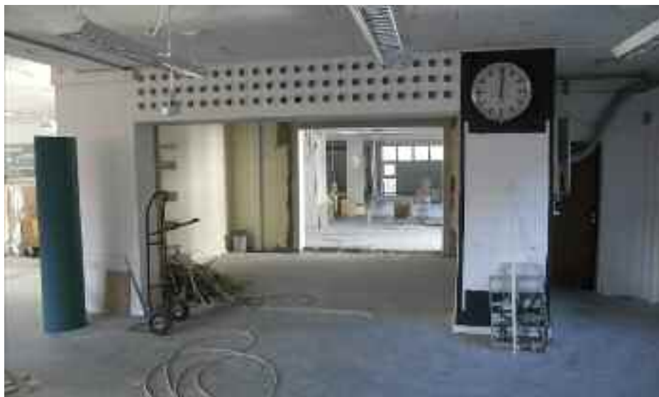
Ombygningen i Flensborg.

Med ét slag bevæger Flensborg Bibliotek sig fra tiden før internet, musik og spil til at blive et 2010ernes multimediehus, hvor bøger, computere og digitale medier eksisterer side om side. Sidst men ikke mindst understøtter den nye indretning publikums udtalte ønsker om forskellige typer af steder at opholde sig: afsondrede, sociale,