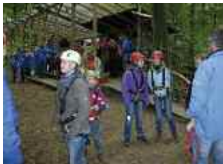
Mon de holder? et skeptisk blik på tovene i Hochseilgarten. Jo, de holdt.