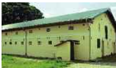
Avlsbygningen er blevet malet.

ves af "Arbeitsgemeinschaft volkskundlicher Sammlungen des Kreises Schleswig-Flensburg", og vi deltager jævnligt i deres kulturelle arrangementer i landsdelen.