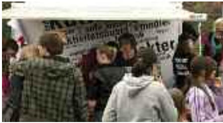
T-shirt-printning på årsmødepladsen i Flensborg..

I maj havde Aktivitetshuset desuden glæde af at være medarrangør til SdUs 4. »New Stars Contest« i Idrætshallen i Flensborg. Ni bands kunne kvalificere sig til årets konkurrence. Juryens priser er gået til det danske jazz-funk-band Kaskélot og de to sydslesvigske bands Crash-Kurs og Lux. Crash-Kurs løb af med publikumsprisen og blev dermed den heldige vinder af en plads på scenen til den nye festival »Seaside Rendezvous Flensburg Open Air« i Kühlhaus.