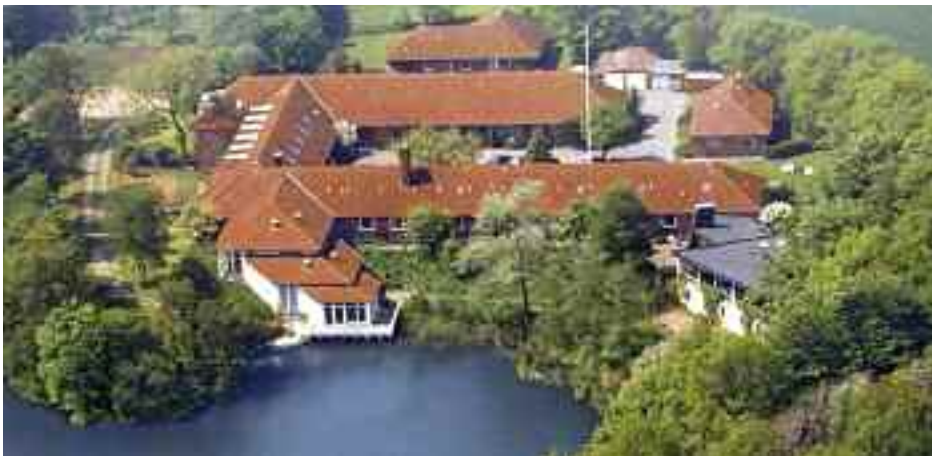
Jaruplund Højskole.

Det var også i 70erne vi stod uforstående over for symbiosen mellem politik og avisen. Vi følte instinktivt, at pressens uafhængighed og det politiske mandat var uforeneligt. Også dengang oplevede vi voldsom kritik i Danmark af Sydslesvigbevillingens omsætning i mindretallet, men debatten blev tiet ihjel. Nok svarede establishment i de danske aviser, men sydslesvigerne