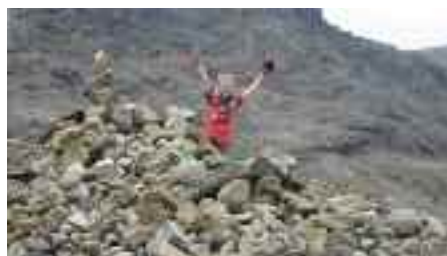
Norden er bare skøn!

Tænk lige på, at vi, der taler dansk, med en ganske beskedne umage kan lære at forstå op mod 20 millioner nordlige naboer. Det holder Norden i Sydslesvig en konference om til marts 2011. En nordisk sprogkonference, hvor alle er velkomne.