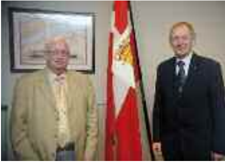
Blandt flere interessante foredragsholdere i Borgerforeningen var også Folketingets fhv. formand Christian Mejdal.

eningen - som selskabelig og upolitisk men dansk forening - udover sit nuværende programtilbud påtager sig flere og andre opgaver.