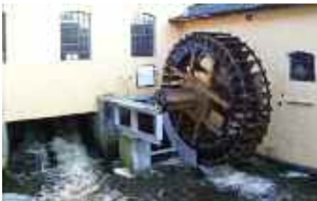
Det vandhjul-drevne hammerværk i den ene af hallerne.