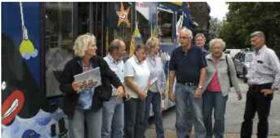
Ind imellem får medlemmerne af Aktiv Café i Kejtum, værestedet for alle ældre danske på Sild, besøg af bogbussen. Så er der pause i passieren og petanque.

I marts fik vi den nye Sydslesviglov, som den bliver kaldt, noget fantastisk noget, man ikke har kendt tidligere. En dansk lov, der gælder for en mennesker uden for Danmarks grænser. Det er