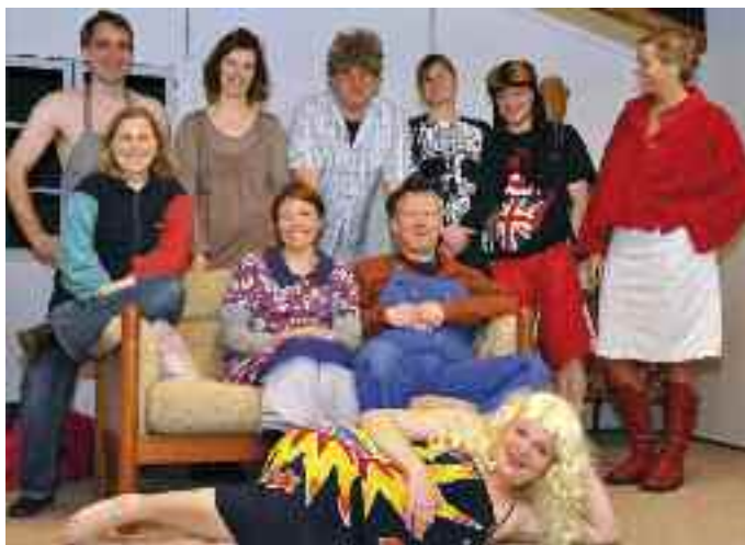
Næsten alle aktører.