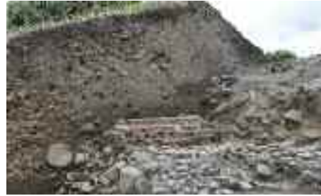
Her begynder hhv. ender Valdemarsmuren.

Udgravningsresultaterne er allerede på nuværende tidspunkt spektakulære.