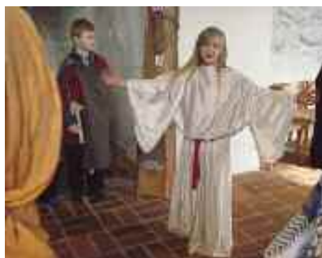
Palmesøndag - Den sidste nadver - Getsemane - Forhøret - Korsfæstelsen - Graven.