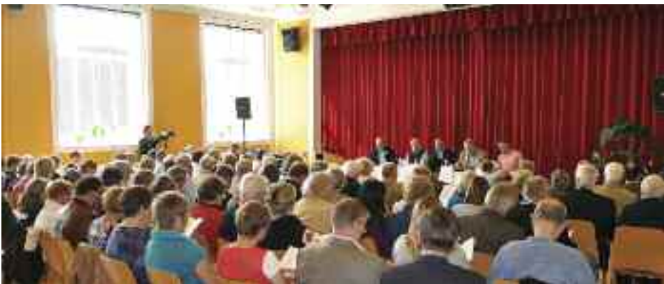
Debatmødet årsmødelørdag samlede atter godt hundrede interesserede lyttere og debattører. I år var emnet kommunikation og synlighed.