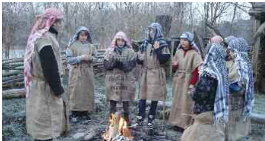
Hyrderne på marken.