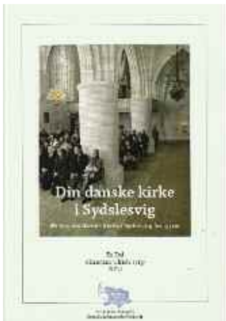
Generel information men også egnet til skolebrug.

36.669 kirkegængere og 13.559 altergæster i 2008. Endvidere blev der fejret 94 børnehave- og skolegudstjenester med 7.567 deltagere mod 100 med 7.772 deltagere året før.