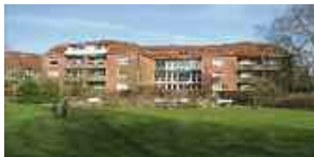
Pensionistboligerne Nerongsallé 27a.

Nybygningen og ombygningen er et stort og længe næret ønske, som er