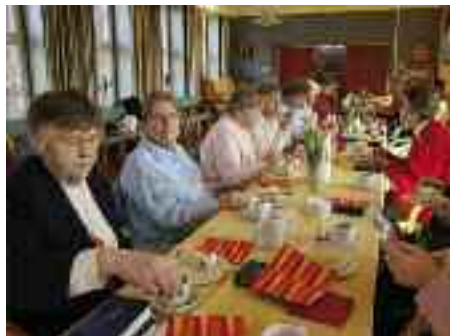
Den 23. marts 1935 blev der for første gang holdt møde i en kvindekreds i Tønning med en valgt bestyrelse. 75-års jubilæet for Tønning Kvindeforening i år blev fejret med manér og sammen med foreningens ældreklub.

Ældreklubber, der refererer til kvindeforeningen, findes i Tønning, Humptrup, Læk og Skovlund, og de har holdt