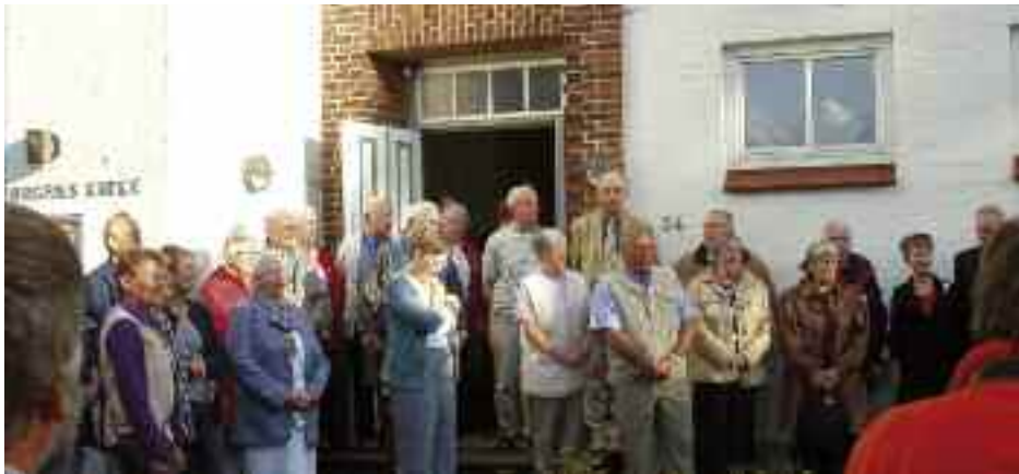
Adelby Kirkevej genlød af sang, da flaget blev taget ned årsmødefredag - sammen med bl.a. Grev Ingolf og Grevinde Sussi.