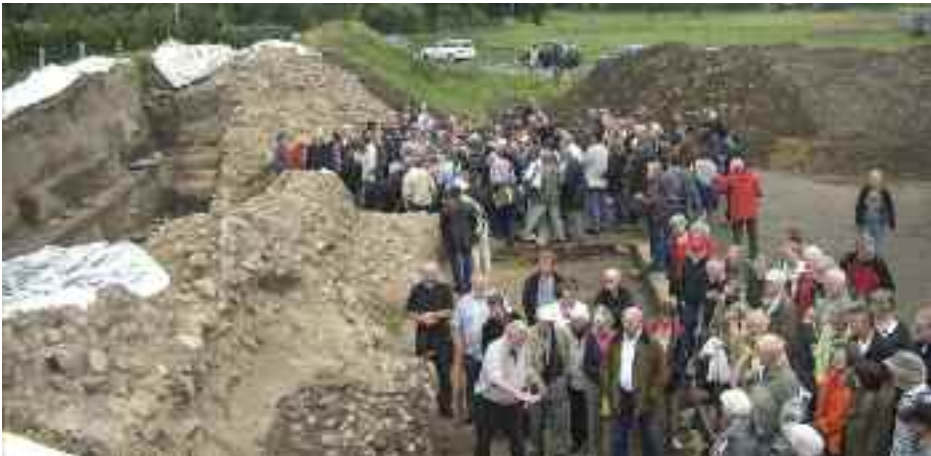
Drøn på Danevirke i anledning af rundvisningerne på kulturarrivsdagen og mindesmærkedagen. I forgrunden dansk sightseeing, i baggrunden tysk.