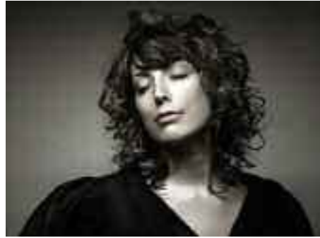
Sinne Eeg Kvartetten gæstede seriene »Jazz på Flensborghus« i marts med drønende succes. Som altid, når der er jazz i huset, arrangerert af SSF og SdU.

Jeg vil slutte med at takke alle medlemmer i kultur-