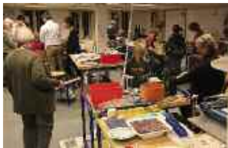
Juleaktiviteter i atelieret.

Det er tydeligt, at vore brugere langt hellere vil benytte deres fritid til kunst og husflid frem for at tilbringe endnu flere timer foran en PC, end de fleste allerede gør på jobbet. Vi har dog alligevel haft nogle vellykkede kurser indenfor mere avancerede IT-emner