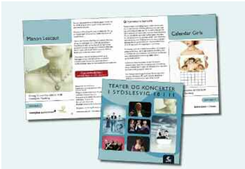
Brochuren har fået et nyt layout, der lægger sig op ad SSFs elektroniske billetsalgs-homepage www.ssf-billetnet.de .

at langt de fleste publikummer gerne vil have en glad og sjov aften, når de går i teatret, og vi forsøger da også at lade den herlige danske humor komme til sin ret i hver eneste sæson, men af gode grunde skal vi bestemt også tilgodesee de andre generer.