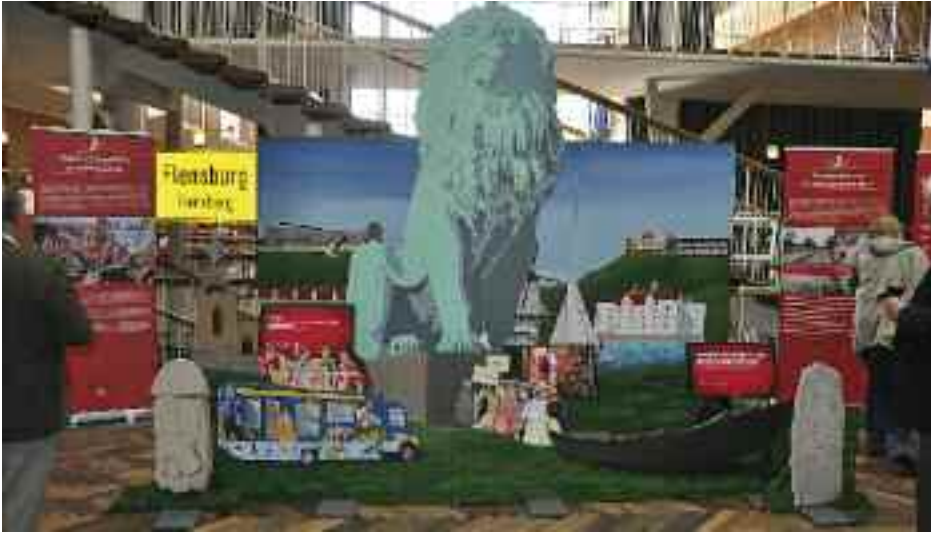
Sydslesvigudstillingen fik premiere i Århus i maj og blev siden vist i Horsens. Det er en moderne udstilling, der hurtigt kan aktualiseres.

ver åbenhed og ansvarlighed i forhold til de danske bevillinger, men især over for den ændrede mindretalspolitik, der kendetegner den slesvig-holstenske regering. Formelt er ændringerne i Samaråds-aftalen få. Samarådet har igen et formandskab, hvor formanden vælges for to år ad gangen. Sekretariatsfunktionen har adresse på Flensborghus, og medlemmer af Samarådet kan ikke være repræsenteret i flere organisationsbestyrelser.