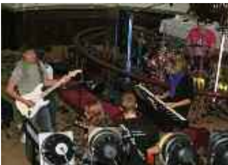
Kristkirken på Vesterbro var centrum for en række aktiviteter, bl.a. en koncert og en workshop.