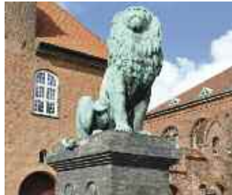
Istedløven, som den var at se på Søren Kierkegaards Plads i København frem til sidst i marts. Et halvt år senere skulle den egentlig stilles op på Den gl. Kirkegård i Flensborg, men sokkelproblemer forsinkede hjemkomsten.