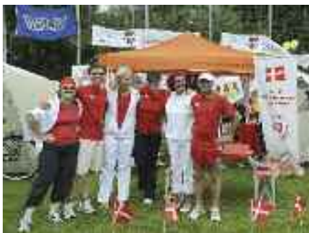
Medarbejdere deltog aktivt i det velgørende løb "Lauf ins Leben".

førstehjælp. Skolelægeligt har man bidraget med rådgivning omkring målte blodtryk og blodsukre og information omkring epidemien af influenza A.