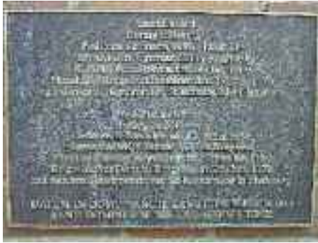
10 år siden, mindetavlen blev afsløret.

sig, så er Knud Lavards bedrifter af mere langtrækkende betydning, skønt i dag vel glemt eller overset af mange.