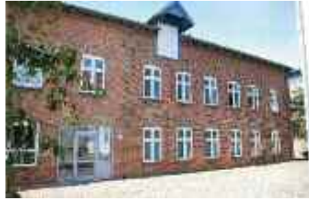
Et "Friisk Hüs" önj Bräist, Süderstr. 6, e nai adräs foon e Friisk Foriining.

Foon e 20. bit 24. juuli häi e Foriining lååsid tu "Feerie for frasche bjarne". For 20 bjarne wörd iin waag lung önj Risem Schölj en feerieprogram önjbin.