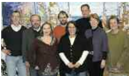
Bystyrelsen 2010.

opstilling af tribunen og indretning på årsmødepladsen, bortset fra at det er en forbedring.