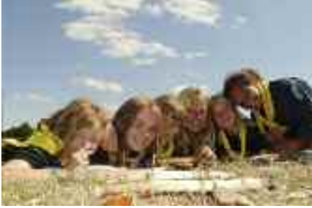
Venner for livet - fra korpsslejren i Skive.

afholder deres jamborette på Tydal. Planlægningen er i fuld gang, og alle har det ønske, at det skal være den bedste jamborette nogensinde. Intet nemt krav, men spejdere elsker udfordringer. Vores håb er, at spejderne efter jamboretten siger til forældrene, at det har været en god lejr, men nu er de trætte og skal indhente mange timers søvn.