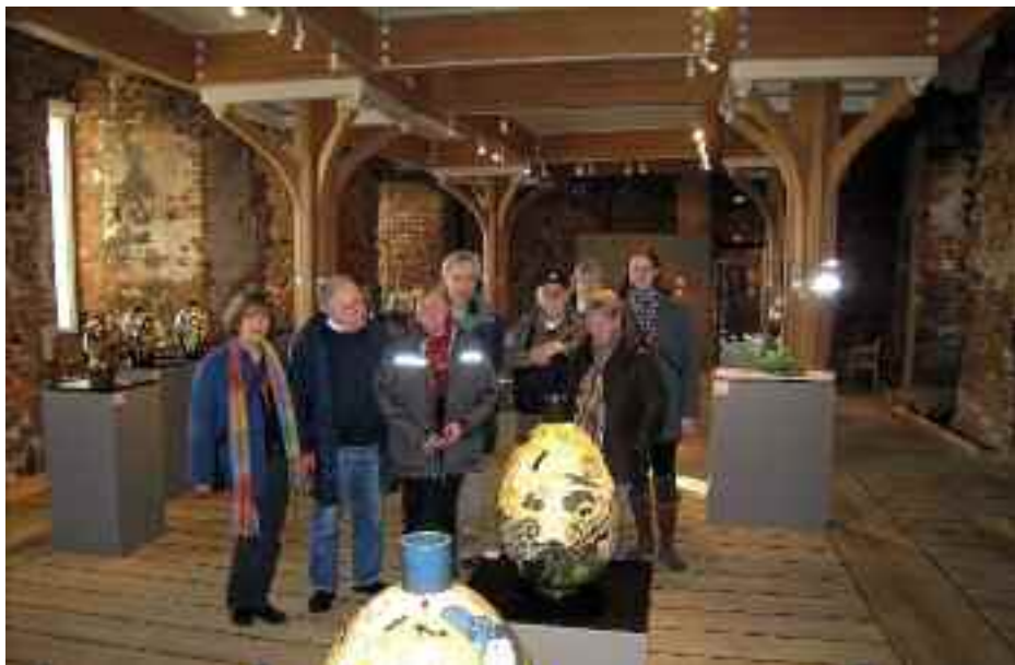
SSF Gottorp amts amtsudflugt i november 2009 med 57 deltagere havde Kolding som mål - Koldinghus og Trapholt. Her en gruppe fra amtet på Koldinghus.