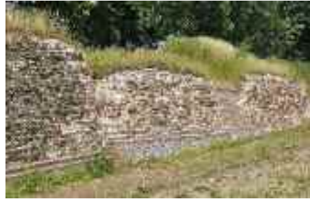
Valdemarsmuren - nu restaureret og fremtidssikret - er fortsat perlen, når det gælder ansøgningen for Hedeby og Danevirke som Unesco-verdenskulturarv.

Det andet museum er SSFs Danevirke Museum, der formidler Danevirkes omskiftelige historie fra jernalderen over vikingetiden og middelalderen