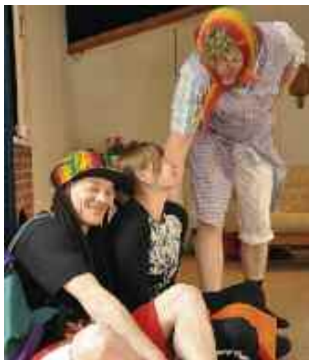
Et suspekt par i »Ballade i sommerlandet«.

Siden oktober 2010 er vi igen i gang med et helaftenstykke, som spilles i marts 2011. Hold udvig efter datoerne i Flensborg Avis, i »Hvad sker i Harreslev« og på vore plakater.