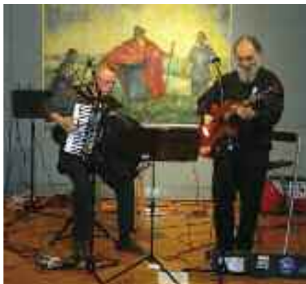
Danske »Konsert« gav koncert på Uffe-Skolen i Tønning med livsglad musik for et veloplagt publikum.

Men der er stadig enkelte, der ikke har indset fordelene ved at være med, ikke bare hos os i SSFs distrikter og de andre foreninger. Især er det slemt, at vores politiske forening SSW på trods af kanonvalg over hele amtet og med hele 4 mandater i byrådet i Tønning stadig har så lille en medlemsflok, "at det ikke ville være muligt at flyve i flok, fordi de ikke er mange nok" som Benny Andersen ville have udtrykt det.