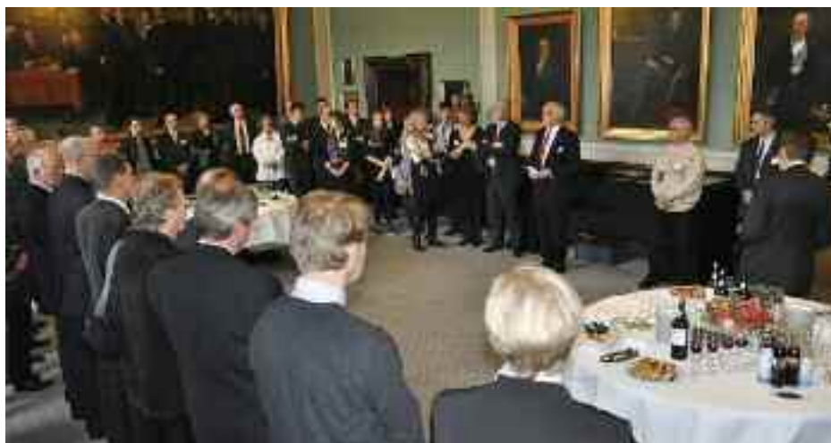
Folketingets formand Thor Pedersen taler til gæsterne på den reception, han har indbudt til efter Folketingets vedtagelse af L98, Sydslesvigloven den 23. marts. »Familiefoto« af de deltagende sydslesvigere og nogle af deres venner.