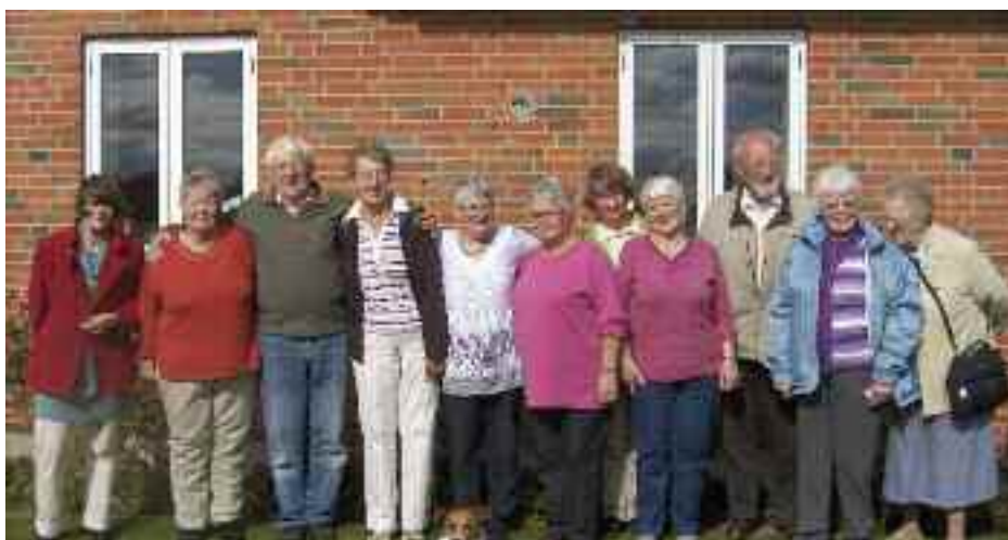
Viborgegnens Grænseforening havde et berigende og godt venskabsbesøg fra Bøglund og Skovby i september 2010. Her ses gæster og værter med hund.