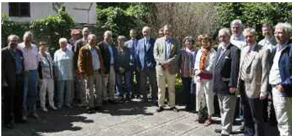
Sydslesvigudvalget på besigtigelsestur i Sydslesvig - her sammen med de sydslesvigske venner i gården bag Tønnsenhuset i Flensborg-Nord.

Med ordene: retsind, lovsind, frisind og storsind blev den nye pagt mellem Sydslesvig og Danmark besejlet. Og som en understregning af det vilde sammenhold mellem mindretallet og Danmark, modtog vi Dronningens nytårshilsen som endnu et håndslag hen over grænsen til "de danske i Sydslesvig. De har boet og levet på den sam-