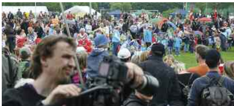
Børneoptræden i silende regn, men Projekt Mindretalslivs fotograf Roald Christesen er ukuelig.