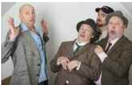
Willy's Kaffeeklub med forsamlingshusteatereforestillingen »I takt for fædrelandet« i Nibøl i januar.

forsamlingshuset med fin underholdning og dejlig beværtning.