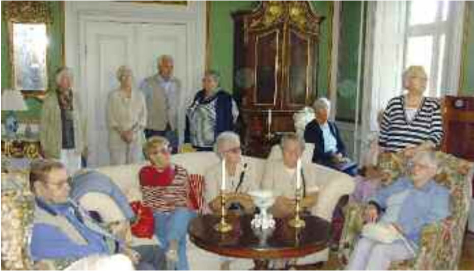
Slotsfruer og herrer på Ulriksholm Slot, et af flere fine programpunkter, da Holm/Skt. Jørgen SSF i Slesvig gæstede vennerne i Kerteminde.