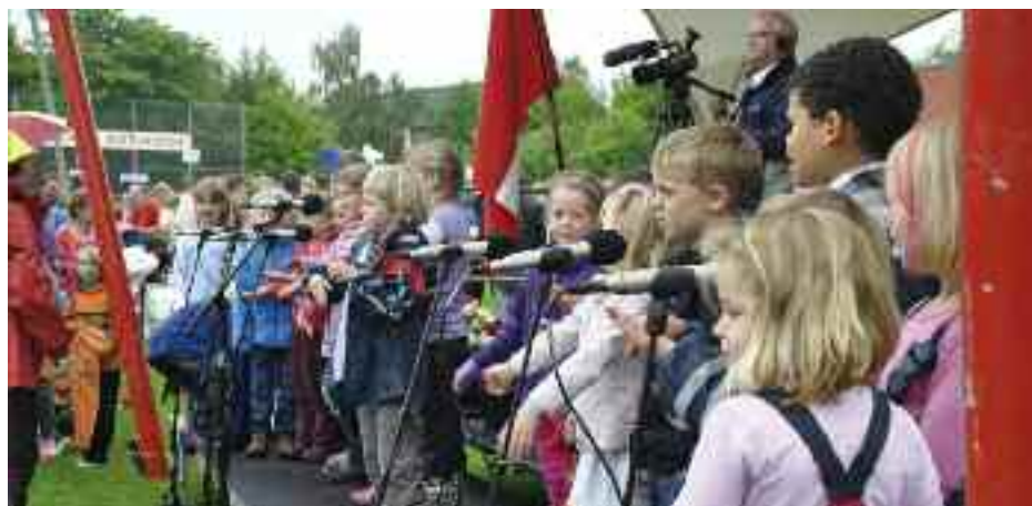
Silende regn ingen hindring for glade børns optræden.