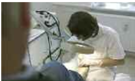
Fodplejer i aktion.

Rendsborg, Egernførde og Frederiksstad. Derudover tilbydes behandling i eget hjem for bl.a. gangbesværede pensionister.