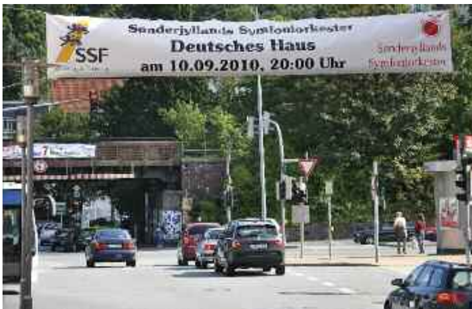
Reklametiltag for at få flere fra især den tyske befolkningsdel til at gå i koncert med Sønderjyllands Symfoniorkester.

”dog skal budgetdisciplinen i relation til teater- og koncertudvalget strammes op” er sikkert nødvendig. Men så vil jeg til gengæld indtrængende opfordre til, at regnskabsafdelingen endelig får udarbejdet eller indført et program til en overskuelig økonomirapport, udvalget løbende kan følge. Vi har drøftet det flere gange før og også fundet alternative løsninger, der dog ikke er tilfredsstillende.