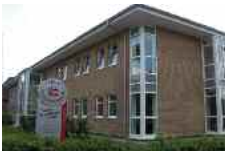
Social- og Sundhedscentret, Flensborg, Skovgade 45

Reserverne i regnskaberne for 2008/ 2009/ 2010 fra fonde, arv og gaver vil være opbrugt i 2010.