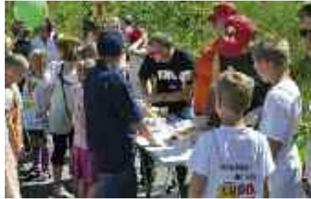
Fritidshjem, børnehaver og skoler tog også engageret del i oplysnings-, protest- og underholdningsaktiviteterne i og ved det danske mindretals telt på Slesvig-Holsten-Dagen i Rendsborg.

SdU skylder især de ti unge, der var tidligere deltagere fra andre nordiske ungdomsuger, men også Nordisk Udvalg og alle andre, der var involveret i dette års Nordisk Ungdomsuge en stor tak. De har gjort et kæmpe arbejde. Også en stor tak til de fonde, der har støttet projektet.