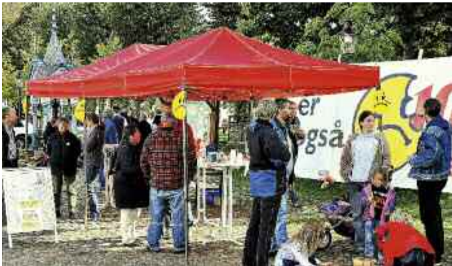
Det store banner vakte behørig - og berettiget - opsigt på aktionsdagen 25. september i Frederiksstad. Den dag og i ugerne op til dagen havde engagerede mennesker overalt i Sydslesvig indsamlet over 51.500 protestunderskrifter, der blev overrakt landdagspræsidenten 6. oktober.

Der er en stor efterspørgsel efter en udvidet åbningstid i SFOerne. Det drejer sig først og fremmest om en udvidelse af åbningstiden i skolernes ferier.