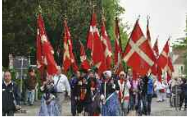
Faneborgen ved årsmødeoptoget i Flensborg.

Det var fra vores side et positivt forløb, og udstillingen var pænt besøgt i dagene efter, specielt næste dag, hvor det