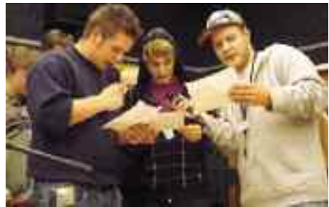
Blandt aktiviteterne var kor, kunst, rap og en natandagt i Sønder Brarup danske Kirke.