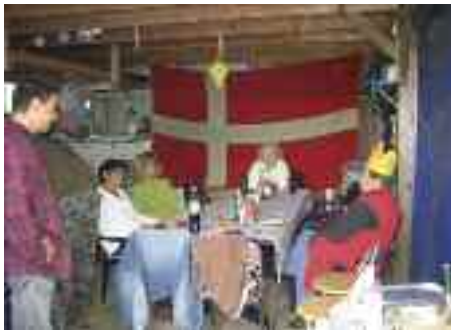
Regnvejr tvang deltagerne i Isted-Jydbæk SSF-distrikt ind i carporten, da de holdt sommerafslutning med grill i september i en privat have. Humøret fejlede dog ikke noget. Da distriktet drog på sommertur til vestkysten, bl.a. sælstationen i Frederikskog, var vejret et helt andet.