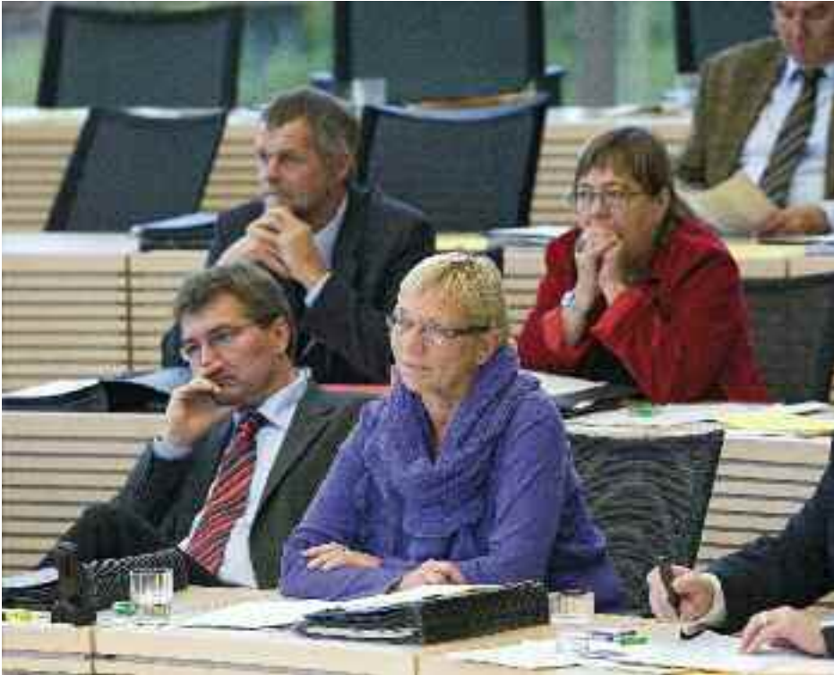
Alvorlige ansigter hos SSWs parlamentarikere.

SSWs mening, at vi i vores landsforfatning har stående, hvilke ansvarsområder der for os som samfund har første prioritet. Dertil hører også forfatningens artikel 5, hvoraf fremgår at delstatens nationale mindretal beskyttes og fremmes af staten og kommunerne.