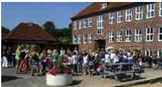
Uffe-Skolen i Tønning blev 75 år, og der var fest - samt morgensang i det fri.