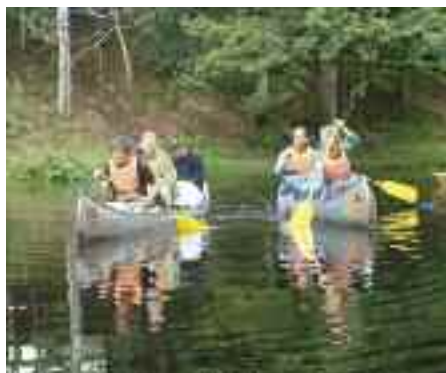
Som afslutning på året har ungegruppen været på kanotur i Sverige.

MBU har 22 klubber (børne-, mini-konfirmand-, mor/barn- og salmesang), hvoraf de 5 er hvilende. Klubberne er