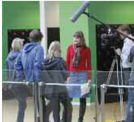
To lærere fra den danske udlandsforening Danes Worldwide, der også tilbyder unge danskere i udlandet videreuddannelse, interviewer en dag i marts nogle elever på A.P. Møller Skolen.

I grundskolerne har der de seneste år været fokus på den fleksible indgangsfase. Skoleloven har fastlagt, at