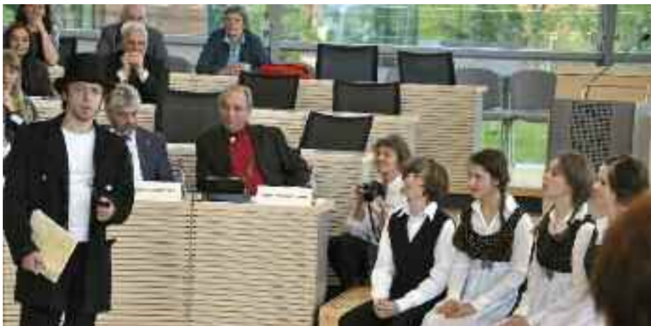
Parlamentarisk aften i landdagen i Kiel, før landsregeringen udløste balladen om ligestilling og tilskud. Landdagspræsidenten havde inviteret, mindretallene i grænselandet kom med taler, underholdning og information, men landdagsmedlemmerne var der langtfra allesammen.