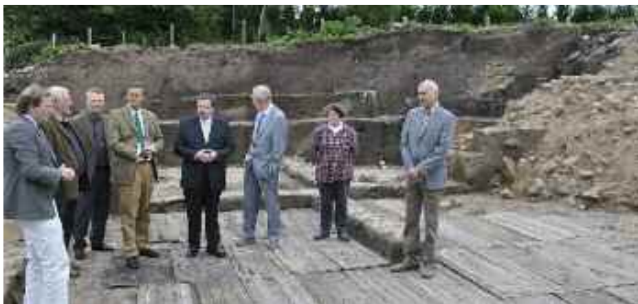
Danske og tyske officials ved præsentationen af Porten i Danevirke-kampestenmuren.

Forventningerne til gode resultater var derfor høje, da arkæologisk landskontor fortsatte med en større udgravning ved det historisk kendte Østre Kælgat. Resultaterne må beskrives som intet mindre end milepæle i Danevirkeforskningen. Arkæologerne fandt nemlig en gennemgang i kampestenmuren, der afslørede, hvor Hærvejen i århundreder skar gennem Danevirke. Danmarks port til Europa. Og som en ekstra gevinst har udgravningerne