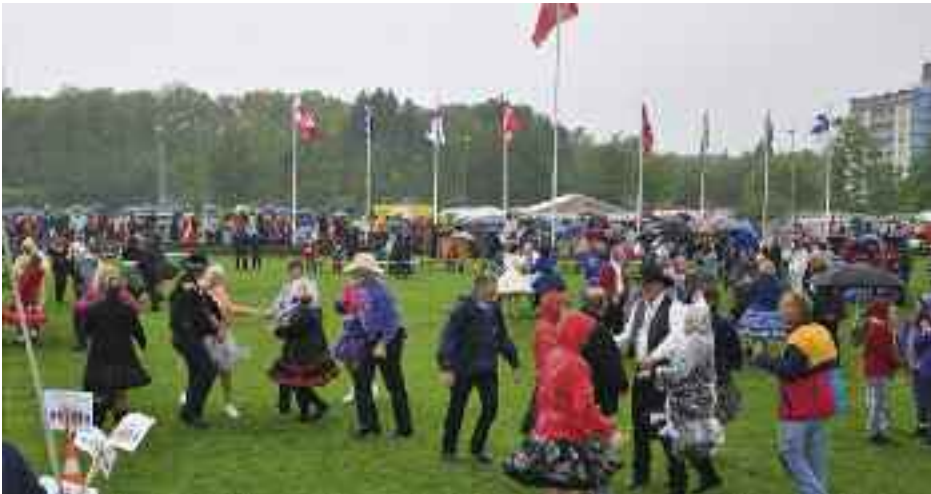
Børnehavebørnene gik rimelig fri for regnen, men squaredancerne fik ikke for lidt på årsmødepladsen i Flensborg.

sus kommer igen. Så skal Han finde os ved arbejdet. Eller jorden går ikke under. Så er der ingen grund til at afbryde arbejdet". Parlamentet – i det amerikanske midt-vest – genoptog da sit arbejde. Selvom den lille historie har flere pointer, vil jeg kun opholde mig ved, at det altid giver mening at besinde sig på dagligdagen og de festdage, der hører med til dem, mest af alt, når der er en krise at modstå.