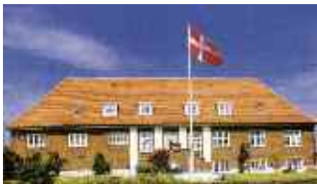
Kystsanatoriet i Hjerting

I 2009 har godt 100 børn fra Sydslesvig haft et ophold fyldt med gode oplevelser i Hjerting. Kystsanatoriet blev renoveret i 2008 og fremstår som en moderne institution, hvor børnene har