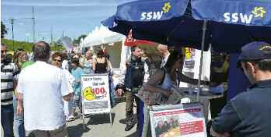
SSW var blandt de aktive organisationer foran mindretalsteltet på Slesvig-Holsten-Dagen i Rendsborg i juni.

tastrofalt tilbageskridt for det danske mindretal i Slesvig-Holsten og for landets mindretalspolitik.