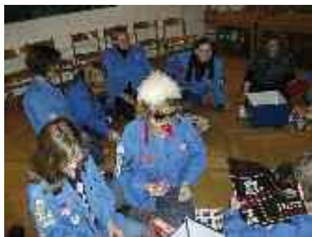
Lederskole også med morsomme indslag.

De mindre FDFere blev indkvarteret i selve lejrbygningen eller i medbragte telte. De store havde deres egen teltlejr, hvor der ikke blot skulle rejses telte men også bygges spiseborde og f. eks. køkkenborde samt laves mad over bål.