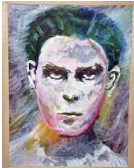
Fra SdUs amatørudstilling på Flensborg Bibliotek, et ekspressionistisk selvportræt.

Også i samarbejdet med JEV står SdU stærkt med engagerede unge, der ikke bare deltager i de arrangementer, som JEV inviterer til, men som også er med i flere af JEVs arbejdsgrupper. Her yder de en aktiv indsats og er med til at sætte skub i mange ting.