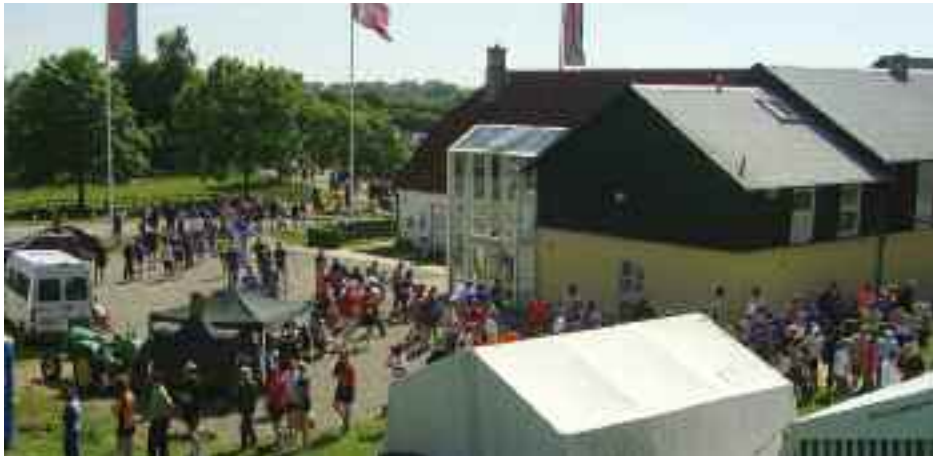
Et populært og historisk stoppested, når der i juni er »Løb mellem havene« fra Damp til Husum: På Danevirke får løberne noget for legeme og ånd.

Aktiv-regionen, en sammenslutning af de lokale turistorganisationer, Slesvig-Flensborg Amt og landets fredningskontor, havde i efteråret 2009 ud-