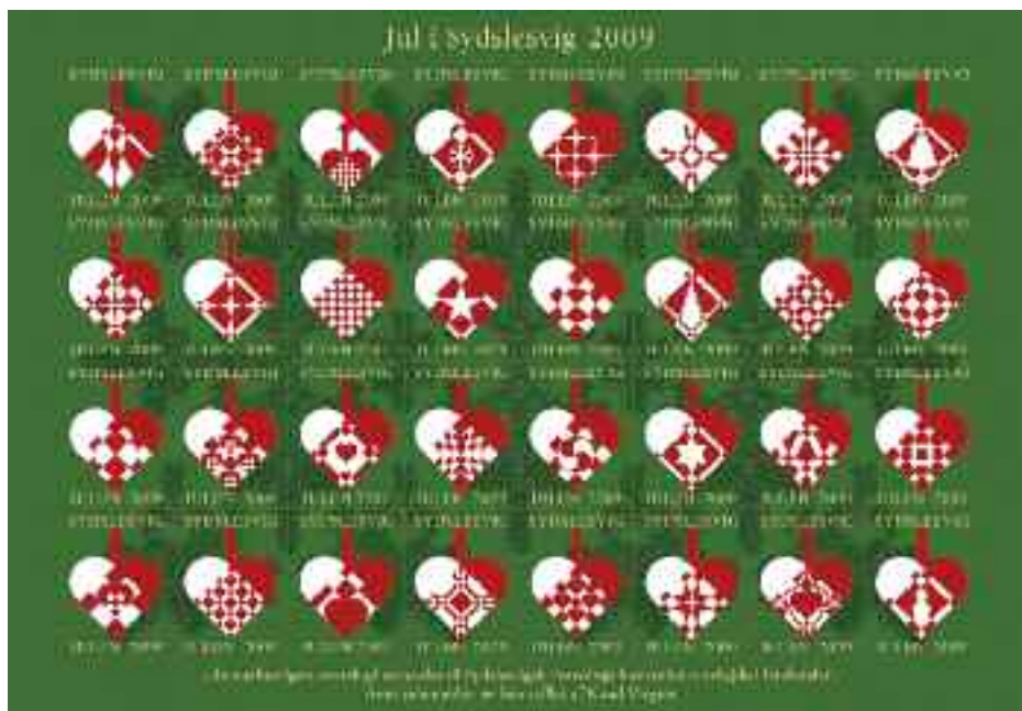
Jul i Sydslesvig 2009 var 32 flettede julehjerter af Knud Vægter fra Nordfalster.