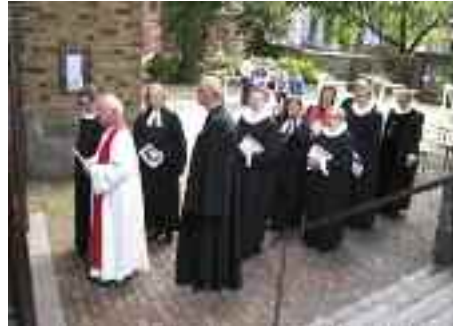
Processionen med tyske og danske præster, provster og biskopper på vej ind i kirken.

grænsen og danske og tyske nord for grænsen – efter en andagt i hjemkirken af sted til Vor Frue Kirke/ Mariekirken/ Sct. Marien Kirche i Flensborg. For anden gang med overskriften "Kirke uden grænser".