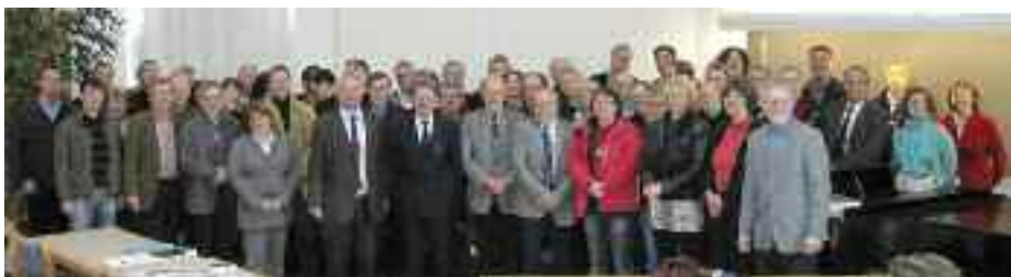
Deltagerne i det dansk-tyske præstekonvent i Løgumkloster i marts.