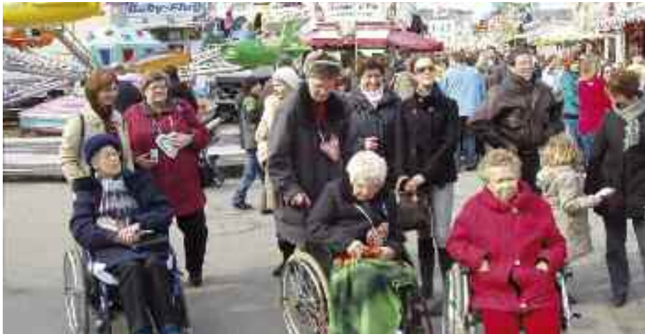
En gruppe beboere fra alderdomshjemmet på Jahrmarkt i Flensburg.

Tak til alderdomshjemmets personale. Vi møder altid åbenhed og venlighed og et godt samarbejds-klima, der igen kommer beboerne til gode.