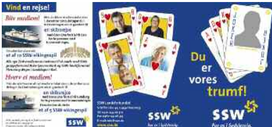
Hverveaktionen 2010 var en konsekvens af de dalende medlemstal.