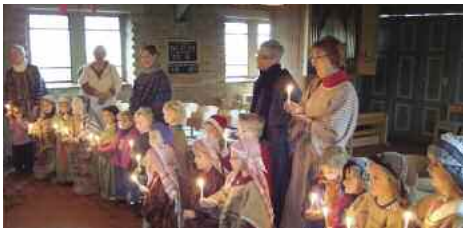
Også i bl.a. Sct.Jørgen danske Kirke i Flensborg var der julevandring for de små.

Vi ser på, at Jesus slæbes afsted med korset på sine skuldere og styrter