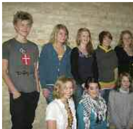
Engagerede unge i Rendsborg – Believers.

Nej, vi skal gøre det begribeligt for folk, at de med deres medlemskab bidrager til at sikre vores kristne kultur. Ligesom der skal nogle temmelig ual-