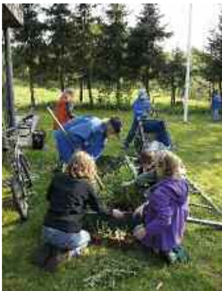
Der gøres forårssklar ved Trenehytten efter en lang vinter.

melighed over FDF-orkestret og det gode samarbejde, idet de altid giver en koncert i kirken til en højmesse i adventsperioden.