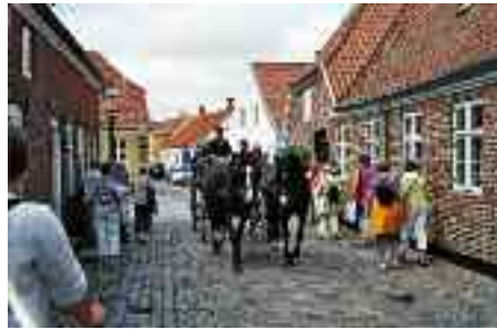
Udflugten til den danske vestkyst – bl.a. til Ribe – var flot tilrettelagt og vel gennemført.

Og vi er forarget over, at landsregeringen for at spare er ved at ødelægge alt humanitært og socialt arbejde for piger og kvinder. www.DsKf.de