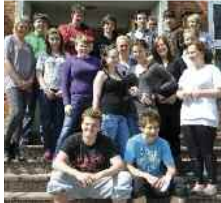
10c på Gustav Johannsen-Skolen havde ingen problemer med at udtrykke deres glæde ved Sydslesvig forud for årsmøderne.

Ved evalueringsmødet den 2. juli 2009 fremlagde jeg udvalgets tanker omkring årets motto. Der blev enighed om ikke at fremhæve SSFs 90 års fødselsdag. Men der var stor opbakning omkring tanken at fokusere på Sydslesvig, vort eget mindretal og den enkelte. Set i lyset af, at vi havde haft mange europæiske mindretal på banen i 2009, var tiden inde til at se indad igen. Udvalget gik derefter i tænkeboks, og efter sommerferien havde vi flere for-