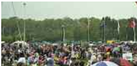
Folk holdt ud, men så på et tidspunkt havde de fået nok af regnen.