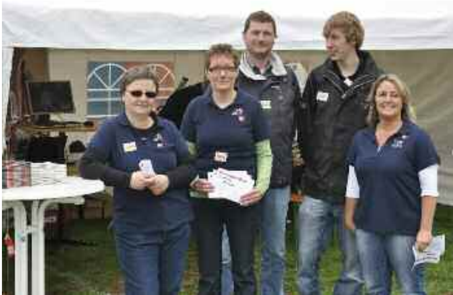
Altid friske medarbejdere - her på årsmødepladsen i Flensborg i år.

ger samtidig med, at der ikke er givet køb på hverken produktudvikling eller kvalitet.