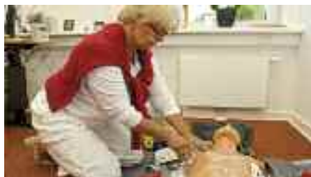
Instruktion i brugen af hjertestarter.

I Flensborg deltager skolesundhedstjenesten fortsat i et lokalt netværk til børnebeskyttelse og har kontakt til lignen-