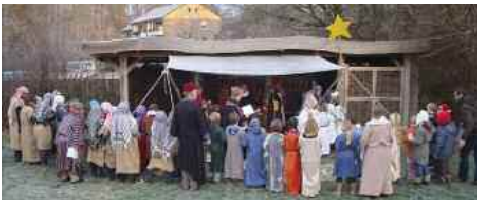
Stjernen viste vej til stalden bag Lyksborg Danske Skole. (Alle fotos: privat)

På Rendbjerg har der været afholdt konfirmandlejre med konfirmander fra Rendsborg/ Slesvig samt Egerførde/ Valsbøl/ Flensborg (Helligåndskirken).