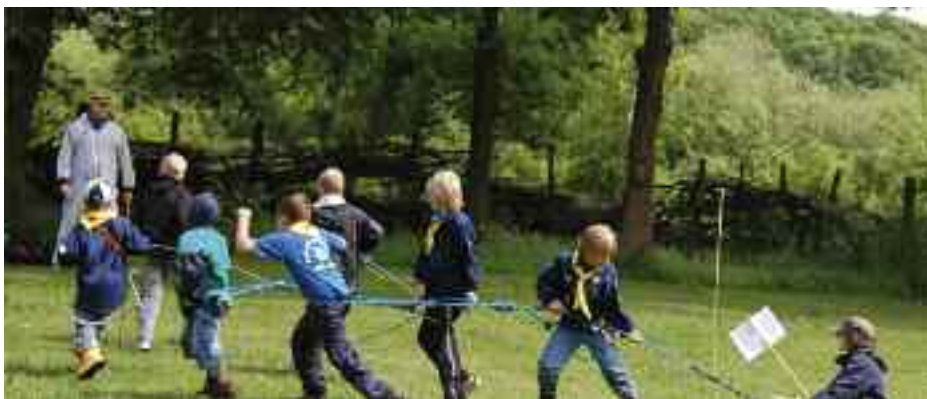
Ulvedag er også skæg og leg.

hvorefter de spredes igen lige så hurtigt.