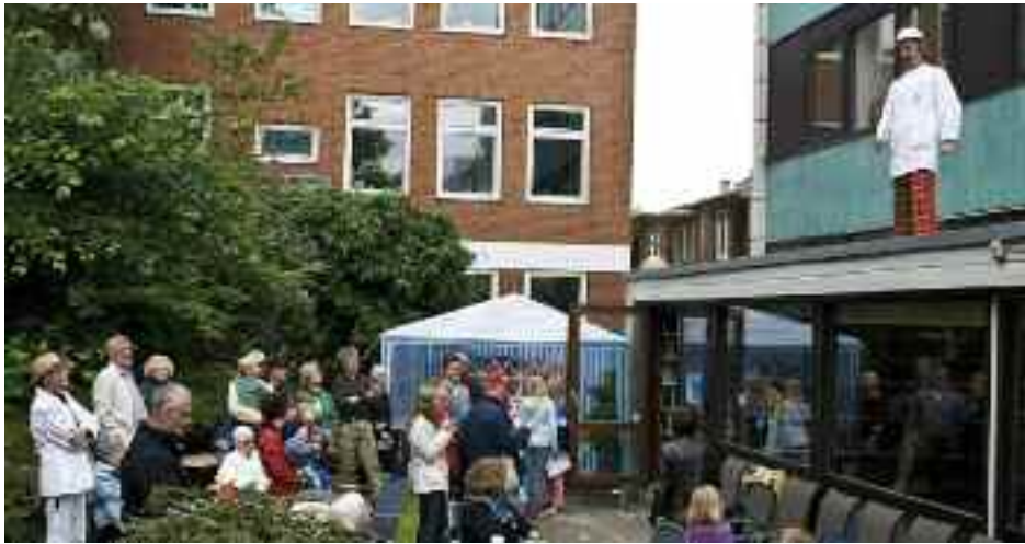
Bibliotekschefen måtte se sig erstattet af en professionel klovn :-), Professor Doktor ABC, da midsommertalen skulle holdes.

smukke og komfortable opholdssteder. Et langbord tæt på udgangen til bibliotekshaven, en sidde-trappe ud mod Nørregade og fjorden, nicher til børnenes forældre med voksen-ting og net-opkobling, studiefaciliteter i lokalsamlingen.