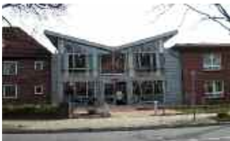
Dansk Alderdoms- og Plejehjem, Flensborg, Nerongsallé 27.