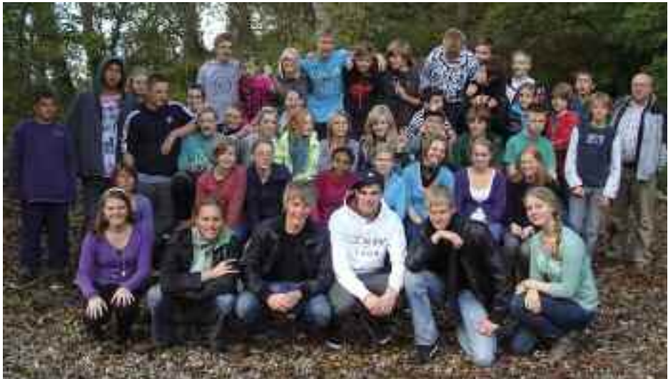
Rendsborg-Slesvig-gruppen sammen med Ten Sing.