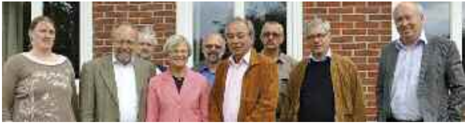
»Kaptajns Legat«s bestyrelse på besigtigelse i Drage, hvor lokale orienterer om, hvordan forsamlingshus-forholdene kan forbedres.