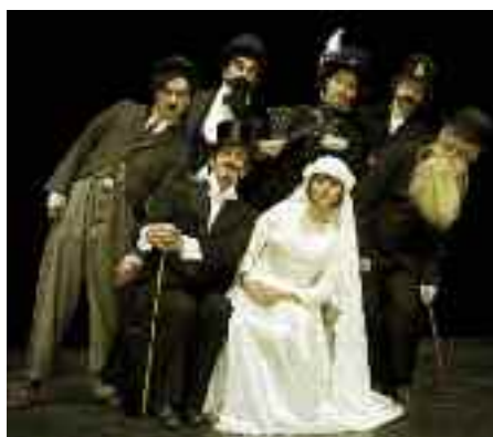
Forsamlingshusteatret med »Chaplin« og Meridiano i Harreslev samlede fuldt hus.

Hvis der skulle være den ene eller anden, der gerne vil bidrage med en artikel eller noget andet, vil vi blive meget glade. Henvendelse kan ske til amtssekretariatet eller til mig.