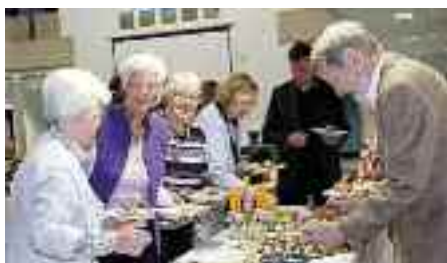
SSH spiser gerne, mens de deler penge ud.