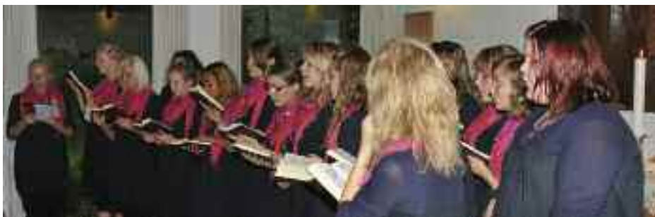
Grenå kirkes pigekor i Satrup.

Ten Sing gruppen og The Believers deltog i FDFs børnefestival i Tinglev og arbejdede med konfirmander i Rendsborg og Harreslev med afsluttende ungdomsgudstjenester.