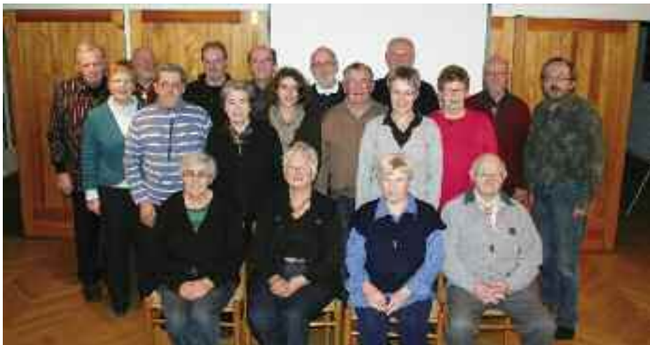
YMC Flensborg – næsten fuldtallig.

Dagens indsamling i kirken – sammen med overskud ved salg af traktementet på kirkepladsen – gik til hjælp for et kristent lejr- og kursuscenter i Albanien. Hermed støttes den albanske kirkes børne- og ungdomsarbejde – et projekt, som Flensborg Y's Men's Club støtter sammen med Y's Men's klubberne i Danmark.