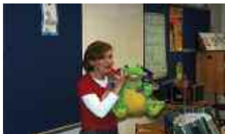
„Kroko“ underviser i rigtig tandpleje.