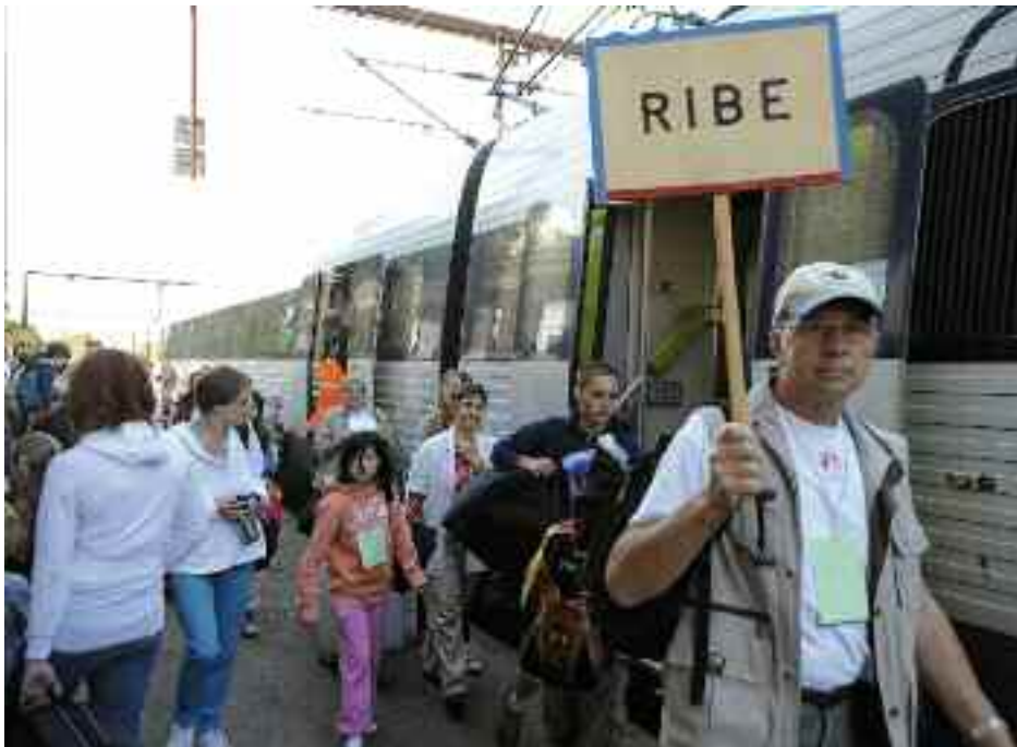
Ikke alle tog går til Ribe, men de ferieborn, der følger skiltet, skal den vej - en typisk situa-tion på Padborg station den morgen, hvor en transport afgår.