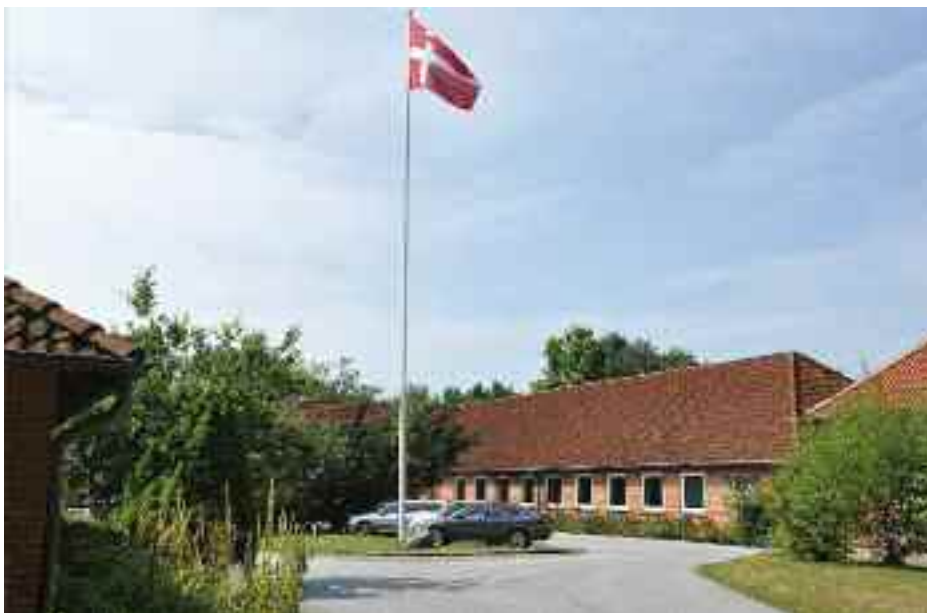
Jaruplund Højskole.

ring i Sydslesvig og mindretalslivet. Sammen med udlejning og anden kursusvirksomhed har der foruden førnævnte kursusvirksomhed været 2057 gæster i huset.