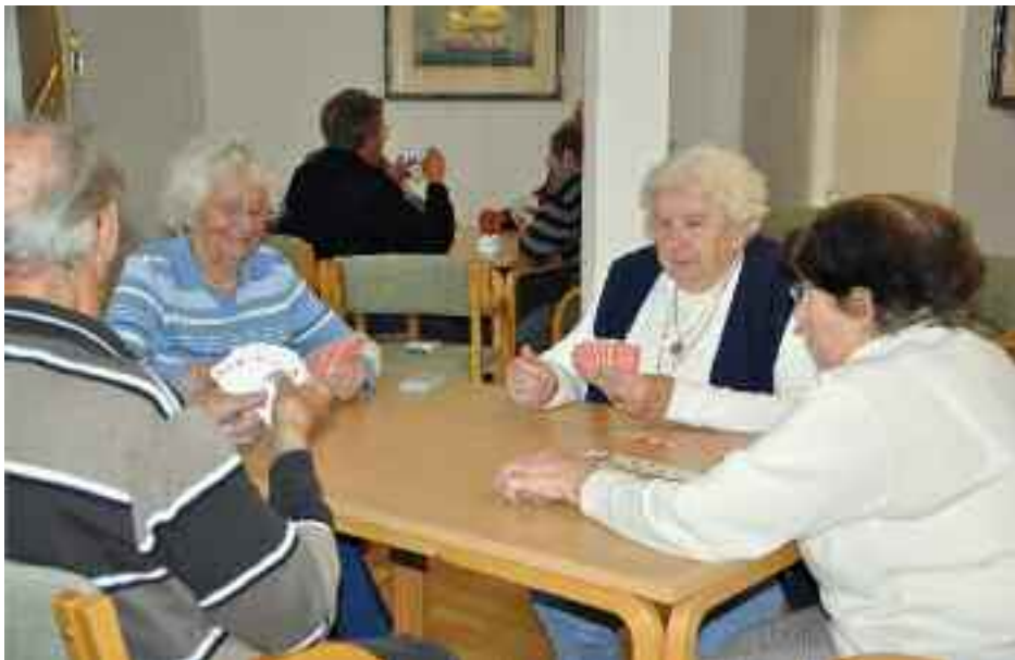
I Værestedet på Flensborghus er der rart at være - et slag kort, lidt billard, kaffe og kage og en god snak.

Har man lyst til til at være med i Værestedet, skal man bare møde op en tirsdag eftermiddag.