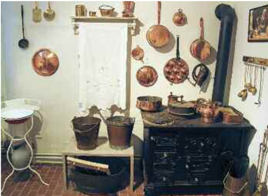
Interiør fra Kobbermølle Museum.

Vi glæder os til at byde alle sydslesvigere og de danske foreninger i Sydslesvig velkommen på museerne i Kobbermølle.