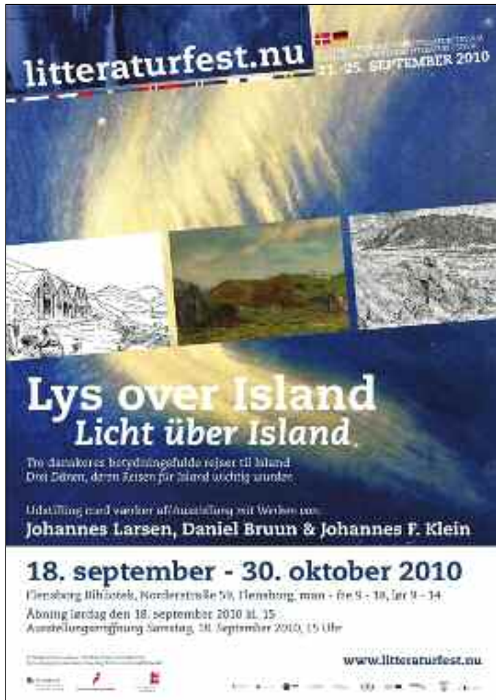
(Grafik Roald Christesen)

sitivt til det nye samfund, de har slået sig ned i.