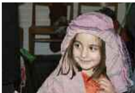
Julevandringerne rundt omkring i Sydslesvig er populære.