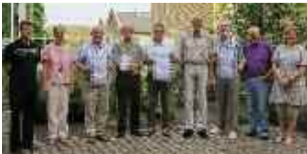
Samarbejdsprojektet Kirke uden Grænser mellem danske og tyske menigheder på begge sider af grænsen – det fik et fornemt forløb i Mariekirken i Flensborg i sommeren 2010 – kræver grundig forberedelse, og det tog en større arbejdsgruppe (foto) sig af.

"Ved kgl. Resolution af 17. februar 2010 har hendes Majestæt bifaldet, at der indføres en ny ordning for anerkendelse af og tilsynet med præster, der ansættes og udsendes af Danske Sømands- og Udlandskirker."