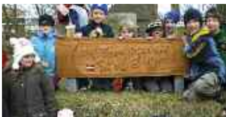
På privat initiativ blev der sat et skilt op ved Kejtum Danske Skole, der er en del af Hans Meng-Skolen i Vesterland, så folk ved, hvad det er for en bygning.