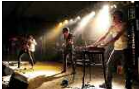
Bandet Crash-Kurs til SdUs New Stars Contest i Idrætshallen.

som grafik og design. Der har desuden igen været efterspørgsel af kurser i tysk for tilflyttere fra Danmark, som vi har kunnet tilgodese med et kursustilbud i det første halvår.