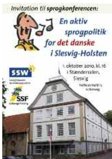
Også nogle konferencer blev det til i 2010: en klimakonference i marts og en sprogkonference i oktober.

blev SSW-landsforbundet i november 2009 officielt medlem i det lokale borgerinitiativ mod et eventuelt CO2-lager i Sydslesvigs undergrund (Bürgerinitiative gegen das CO2-Endlager e.V.). Også denne politiske kamp er endnu ikke overstået, da forbundsregeringen tilsyneladende ikke vil give de enkelte landsregeringer vetoret mod lokale CO2-lagre. SSW vil derfor fortsat holde øje med udviklingen på dette område og om nødvendigt presse landsregeringen politisk i denne sag.