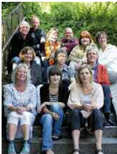
litteraturfest.nu: Samarbejdspartnere fra Nordisk Informationskontor, Kulturbüro, biblioteker syd og nord for grænsen og repræsentanter fra universitetet i Kiel og Sønderborg.