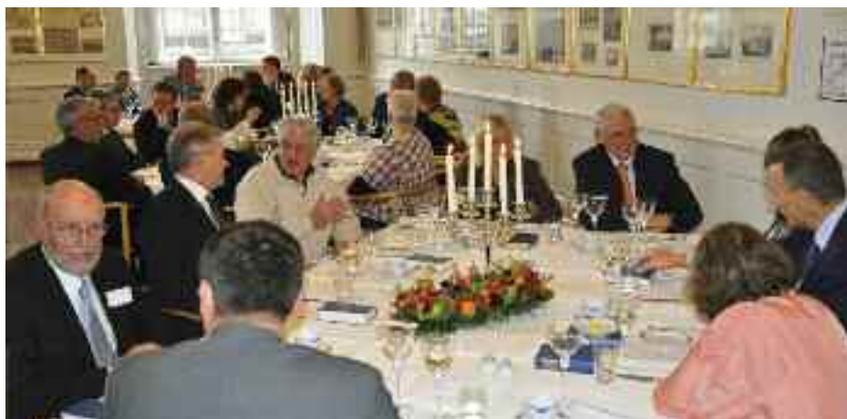
Folketingsturen i november 2009 - altid en oplevelse, altid med et givtigt program, altid medtilrettelagt af Grænseforeningen. Ikke mindst modtagelsen ved Folketingets præsidium på Christiansborg lader de sydslesvigske deltagere fornemme de levende og stærke bånd på tværs af alle partipolitiske skel mellem politikerne og mindretallet.