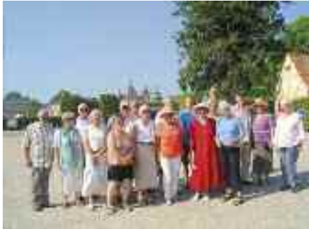
Skovby SSF var på en fin tur til Fyn i juli, bl.a. til Egeskov Slot.