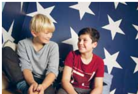
Elevudvekslingen i uge 45-47 er populært.

Løsningen gælder fra optaget i sommeren 2015 med tilbagevirkende kraft for studenterårgangen 2014.