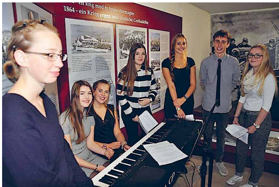
Duborg-Skolens 12F underholdt med sang og musik ved 25 års jubilæet.

"Mange tak for et spændende besøg på museet samt gåturen til Danevirkevolden," skrev nogle tilfredse gæster i museets gæstebog forleden.