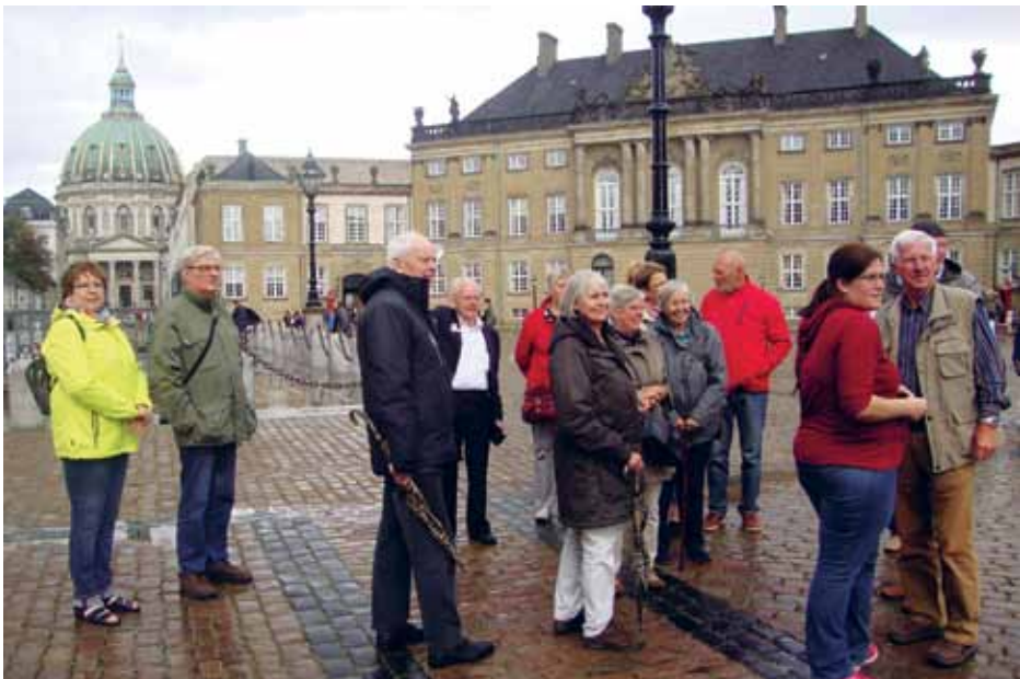
Ejderstedernes årsudflugt gik til København. Her ses nogle af deltagerne på Amalienborg slotsplads.