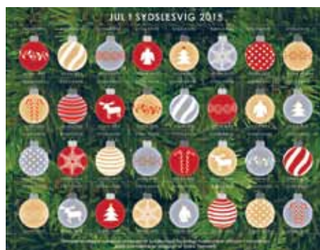
SSFs julemærker Jul i Sydslesvig 2015.