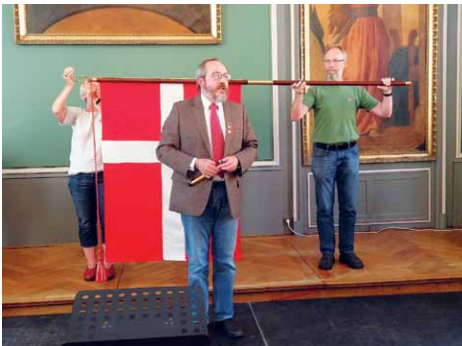
Blandt dem, der i år modtog nye faner fra Danmarks-Samfundet, var SSF-distrikt Nord i Flensborg. Den overrakte ved årsmødet på Duborg-Skolen.

Hun afsluttede sin hilsen med en kort personlig historie: "Jeg bor selv i en lille landsby ved Slien, Flækkeby, og i et nybyggerområde langs vores "hovedvej" blev der rejst en flagstang. Da jeg på vej hjem kørte forbi, opdagede jeg, at Dannebrog var hejst og siden dagligt den danske vimpel. Indrømmet, jeg er måske gammeldags, men jeg fik gåsehud og tårer i øjnene og følte mig på en gang forbundet med dem, der var flyttet ind - et ganske særligt syn i en landsdel, der ellers flagrer med alle mulige flag fra diverse fodboldklubber med mere. Intet kan slå vores rød-hvide flag og vores særlige flagkultur."