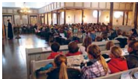
Fra påskevandring-gudstjenesten i Kristkirken i Rendsborg.

MBU har haft to påskevandring. Den første i Rendsborg Kristkirke, hvor deltagerne var minikonfirmander, og hele skolen deltog. En god oplevelse.