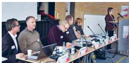
Det kompetente panel.

Fra Sydslesvigkonferencen udgik der dog også andre klare signaler. Signaler om bedre samarbejde på det overordnede plan samt mod til nytænkning og et udviklende folkestyre i Sydslesvig.