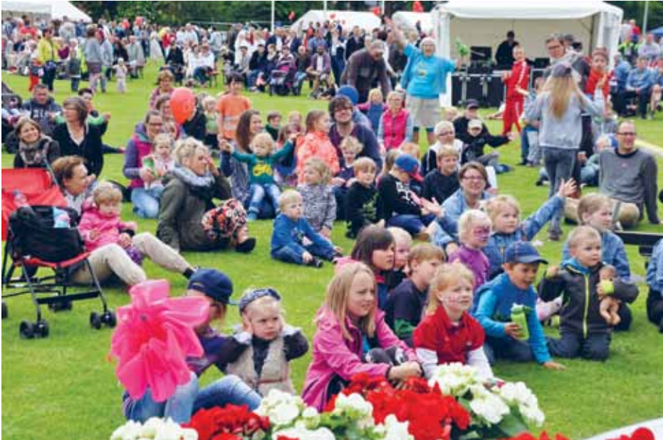
De små og deres store ledsagere nød Tante Andante Bands optræden.