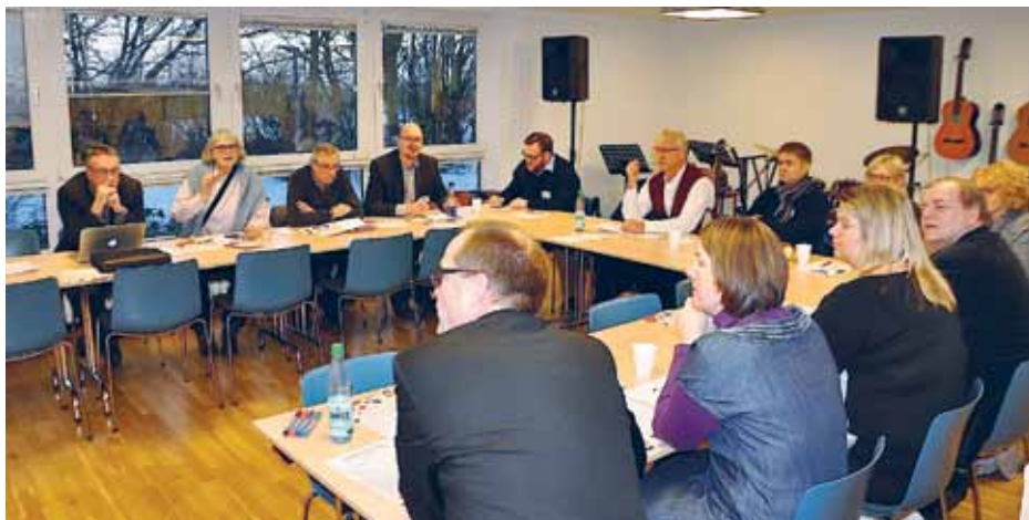
En af arbejdsgrupperne på Sydslesvigkonferencen.

Mens aktieselskabet Flensborg Avis af journalistiske grunde ikke længere er repræsenteret i Samrådet, og Friisk