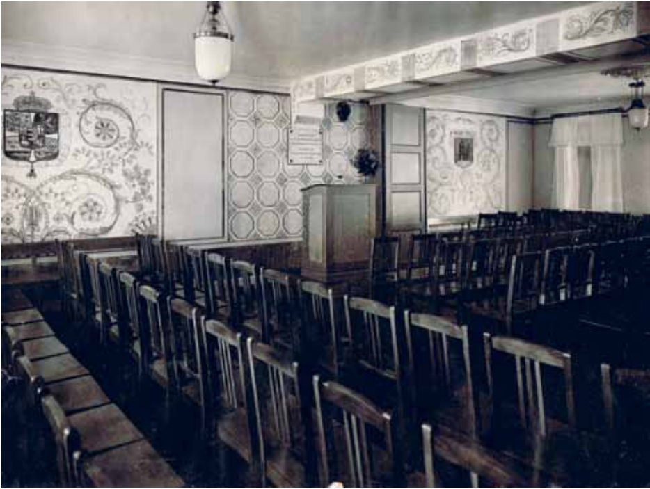
Det lille Teaters sal i Hjemmet i Mariegade 20, før teatret overtog bygningen.