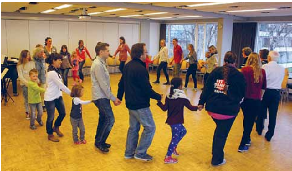
SSF Flensborg amt er en af de drivende kræfter bag familie-sprogkurserne; fulde huse hver gang.

Medlemstallet er der ikke så meget at tale om. Vi nåede desværre ikke de 3500, som min forgænger havde håbet, men vi er heller ikke gået ned. Men vi arbejder på at få medlemstallet til at stige igen.