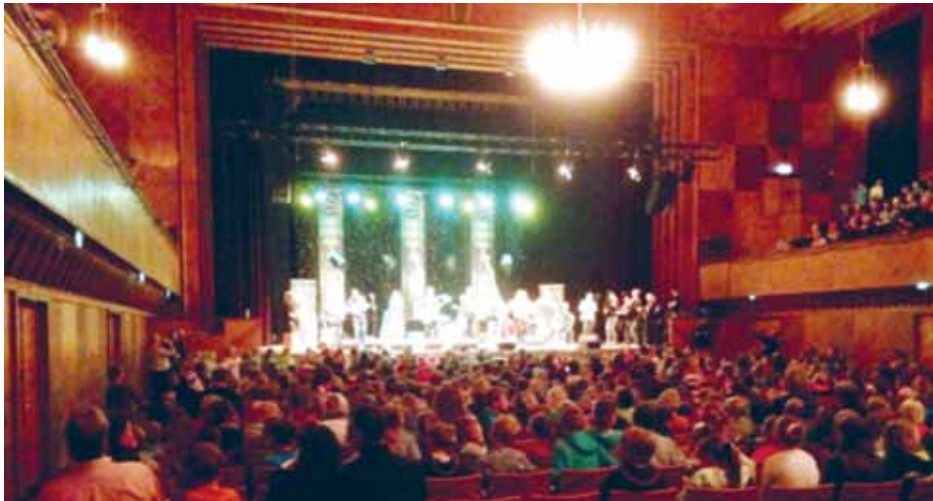
1000 elever fra Hiort Lorenzen-Skolen, Jørgensby-Skolen, Husby Danske Skole, Hatlund Danske Skole, Uffe-Skolen, Gustav Johansen-Skolen, Oksevejens Danske Skole, Vanderup Danske Skole, Jaruplund Danske Skole, Jens Jessen-Skolen, Kobbermølle Danske Skole, Bøl/Strukstrup Danske Skole, Sønder-Brarup Danske Skole, Grundschule Kieholm, Grundschule Adelby og Waldschule nød en flot skolekoncert i Flensborg med Tumult fra Danmark, frisiske Kalüün fra Før og folkBalticas eget ungdomsensemble.

Spil Dansk Dagen 2015 blev flyttet pga. de sene efterårsferier men indeholdt også denne gang et flot program, der involverede unge som ældre.