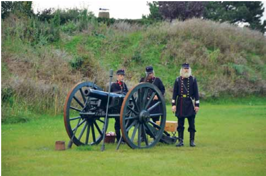
1864-kanonen og dens besætning er klar til affyring af tre salutskud på jubilæumsdagen i september.

Danevirke Museum er således som spået blevet et væsentligt mindretals- og kulturhistorisk indsatsområde, og museet har i årenes løb udviklet sig til en institution, der står godt opstillet i museumslandskabet på begge sider af grænsen. Samarbejdsaftalen med Mu-