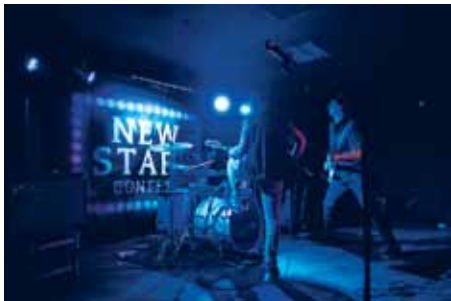
Aktivitetshuset er medarrangør af bl.a. New Stars Contest.

kurser i IT og medier med hjælp til den ældre generation og også med nye tekniske tilbud som håndtering af iPads, introduktion i træ- og metalværksted, hvor man kan lave sine egne billedrammer, slibe knive, bygge etagere eller lave skåle og dekoration i beton.