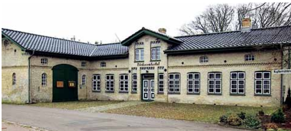
Chr. Lassens Mindemuseum i Jar(de)lund.

Der skal lyde en stor tak til de personer, som igen har ydet en indsats både ved organisation og gennemførelsen af åbenthus-møderne eller som guide ved gruppebesøg.