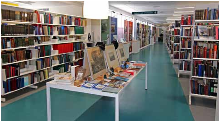
Den slesvigske Samling.