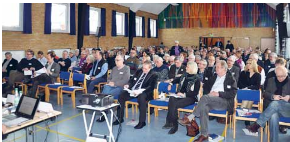
Fuldt hus til Sydslesvigkonferencen på Jaruplund Højskole.

Det blev tydeligt, at arbejdet i foreninger, landdistrikter og landsdelsorganisationer fungerer godt, og at medlemmerne ikke ønsker at miste de små enheder.