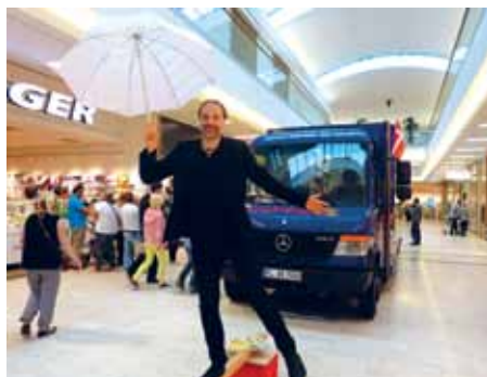
Bogbussen på sommerudflugt til Citti Parks indløbscenter.

Samtidig med udstillingen lavede biblioteket en lille kampagne for mulighederne for at se dansk tv i Sydslesvig.