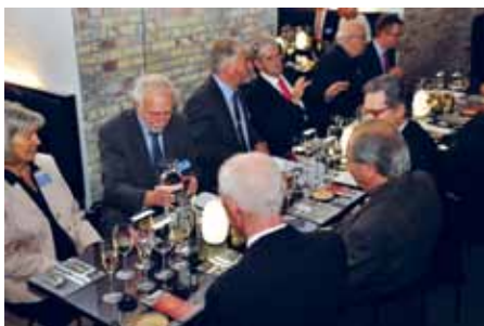
Folketingets præsidium indbød danske som tyske deltagere til åbning af 1864-udstillingen på Borgen og middag i den nye tårnrestaurant på Christiansborg.

Et gennemgående tema i 60-året for Bonn-København erklæringerne har været dokumenternes betydning for det dansk-tyske grænseland. Et andet fokuspunkt har været europæisk mindretalspolitisk - også for derved at styrke kendskabet til Federal Union of