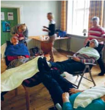
Fra wellnessdagen på Skipperhuset.