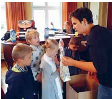
Amtsstyrelsen holder fast i at deltage ved indskoling af nybegynderne for at overrække et Dannebrog-bordflag til alle børnene. SSFs statholder på halvøen, kontorassistenten på amtssekretariatet deltager og informerer om SSF. Det er ikke kun reklame, men også synliggørelse overfor de nye forældre. Samarbejdet med skolen fungerer fremragende.

Selvom Skoleforeningen som selvstændig organisation har lov til at beslutte, hvad de har lyst til, også hvad