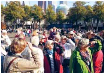
Turen til Holland var en oplevelse.

På øerne Sild og Før har vore medlemmer fælles arrangementer med de andre danske foreninger.