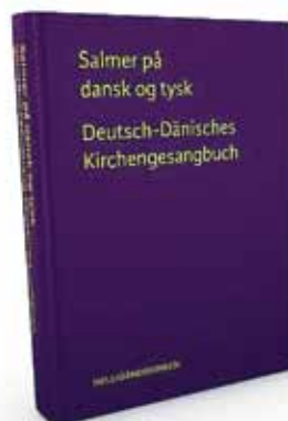
Den nye salmebog, her Helligåndskirkens i Flensborg: Hardcover indbundet i mørklilla lærred med titel i guldpræg.