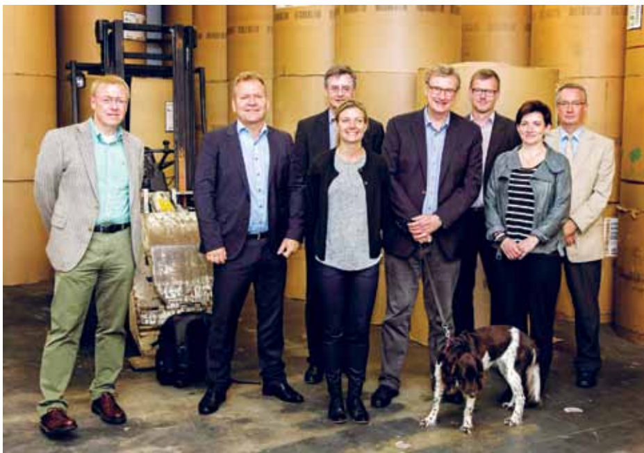
Det afgående Sydslesvigudvalg inkl. Kim Andersens hund Molly vises rundt i juni på Flensborg Avis.

tiltag, som passer til tiden, vi lever i. Vi skal hele tiden have fokus på at stræbe efter høj kvalitet af det journalistiske indhold, vi sætter i avisen og på de digitale platforme online.