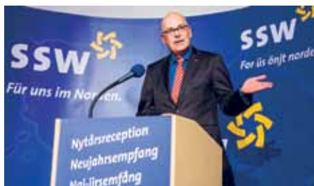
Synligt udtryk for det gode samarbejde i SPD-Grønne-SSW-landsregeringen var, at ministerpræsident Torsten Albig havde lyst til at være gæstetaler ved SSWs nytårsreception i Rendsborg i begyndelsen af 2015.

Selv om der de senere år ikke har været de store emner, viste netop 100%-sagen, at kontaktudvalget stadig kan spille en positiv rolle for det danske mindretal. Netop ved at påtale