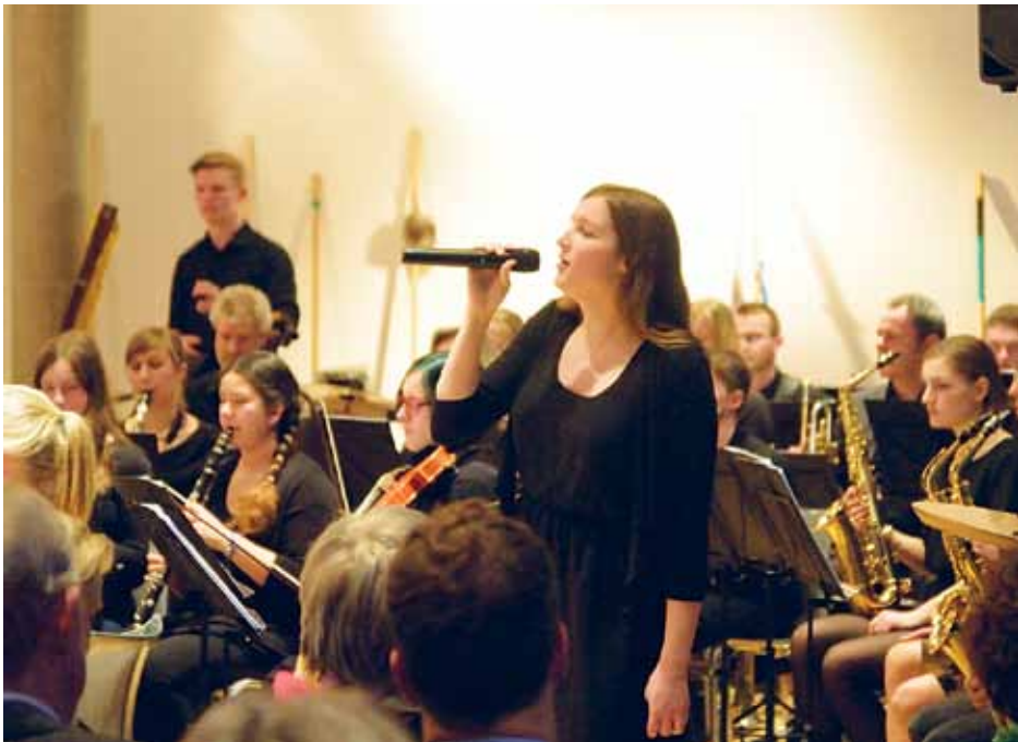
Skoleforeningens Underholdningsorkester/ Skurk har i sin femte sæson haft et travlt år bag sig, bl.a. ved at spille til fejringen af København-Bonn erklæringerne i Berlin, hvor orkesteret høstede stor ros.

Fra Kiel har Skoleforeningen modtaget besked om at være omfattet af en tilskudsordning, der skal føre til ansæt-