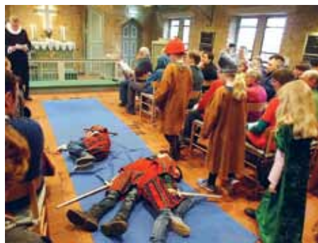
Minikonfirmanderne fra Jens Jessen-Skolens tredje klasse havde fuldt hus, da de til gudstjenesten palmesøndag i Sct. Jørgens Kirke i Flensborg opførte deres lille skuespil.

Da flere af disse funktioner rummer en ganske stor ekstra belastning, hvis de skal løses tilfredsstillende, arbejder strukturudvalget og Kirkerådet på, at vi