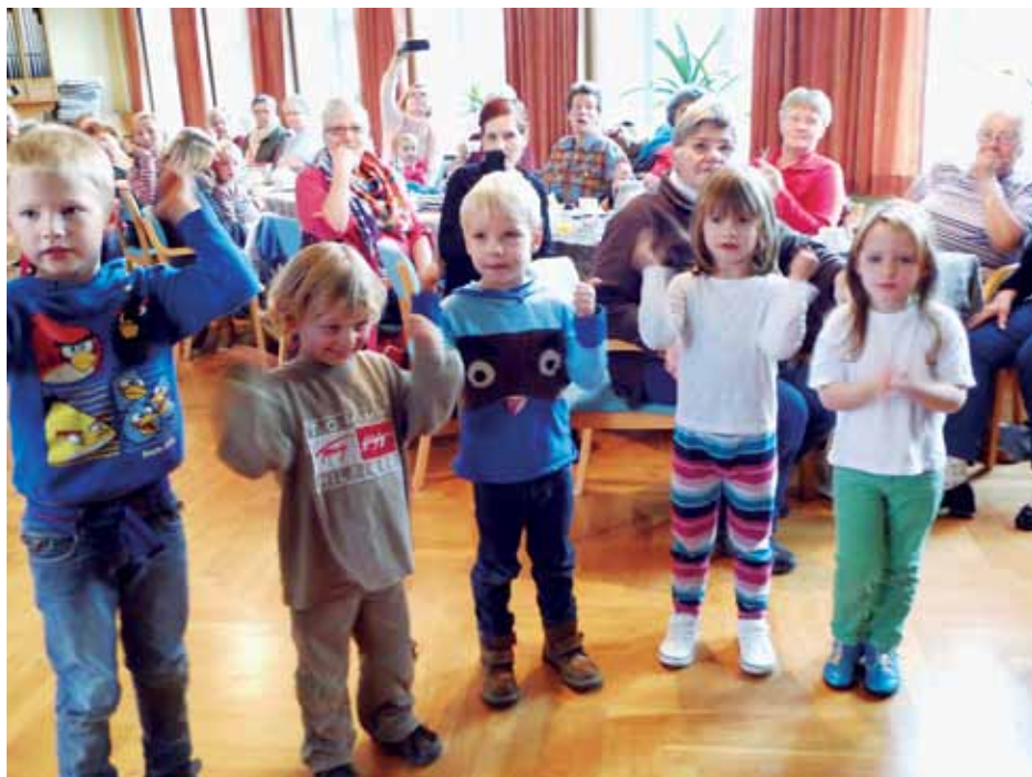
Uffes Kaffebær, de månedlige café-eftermiddage i Tønning, hvor bogbussen er tilstede, er populære. Udbyder og program skifter fra gang til gang, og der er aktiviteter for alle aldersklasser.