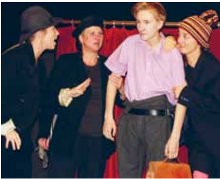
Gummi-Tarzan fik buksevand ved årsskiftet 2014/15 på Det lille Teater Flensborg.