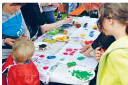
Husets kursusprogram spænder vidt - al- ders- som indholdsmæssigt.

I atelieret er det især pileflet, glas- og glasperlekurser, håndarbejdskurser og malekurser, der er populære gen- gangere. Men vi tager også brugernes ønsker op, satser på nye undervisere og emner og afprøver, hvilke emner der er aktuelle og kunne vække ens in- teresse for at være kreativ, lave noget