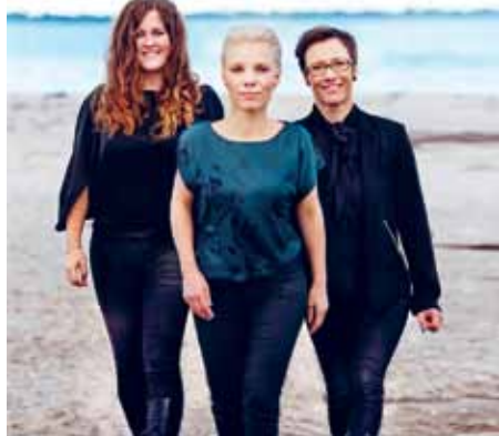
De fem danske kirker/ menigheder i Flensborg arbejder sammen. Under overskriften "Flensborg Bykirke" indbydes til fælles tiltag. I juni var der f. eks. korkoncert i Ansgar Flensborg med musik af Carl Nielsen, Billund Kirkes Børne- og Ungdomskor samt trioen Zenobia (foto).

Ændringerne medfører, at der samlet set er sparet en præstestilling under Kreds 1 og Kreds 2.