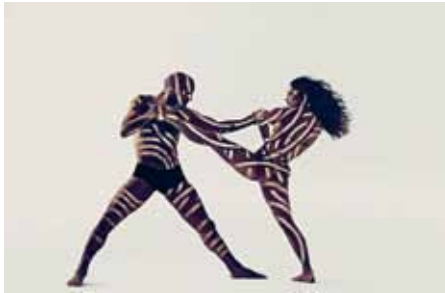
Dansk Danseteater med balletten Carmina Burana på Husumhus i Husum i februar.

Teater- og koncertudvalget havde for sæsonen 2014-15 atter skruet et program sammen, som allerede ved dets præsentation udløste ros og anerkendelse. Vi var enormt stolte og glade over alle de fremragende ting, vi havde truffet aftaler om.