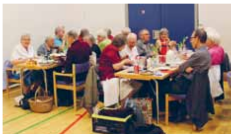
Der blev hygget.