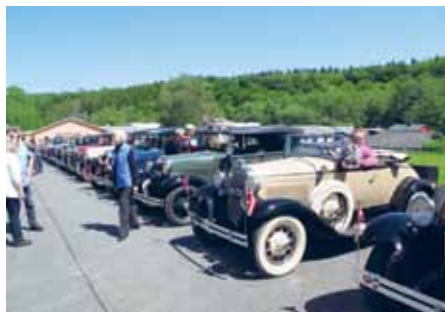
Også Vamdrup Ford A Klub fandt i 2015 vej til museet med deres herlige køretøjer.

Museet er fortsat et populært mål for rejsegrupper, personale-, forenings- og menighedsudflugter, klassetræf og generalforsamlinger, eller et besøg på museet indgår som et afvekslende indslag i