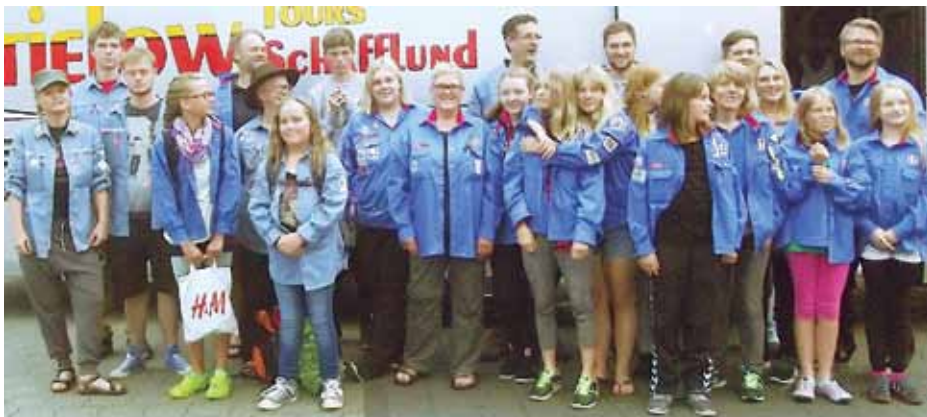
23 FDFer fra både Bredsted og Flensborg skiftede skoletaskerne ud med deres uniformer og rygsække, fordi de tog på kanotur til Sverige.