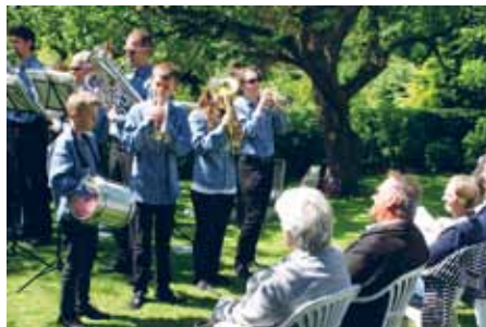
Holtenå-årsmødet - ikke uden Gladsaxe Brassband.

I Rendsborg Egernførde amt er der hvert år i snit otte årsmøder. Omkring 2.000 deltog i 2015. Det er en weekend, hvor mange familier deltager ved