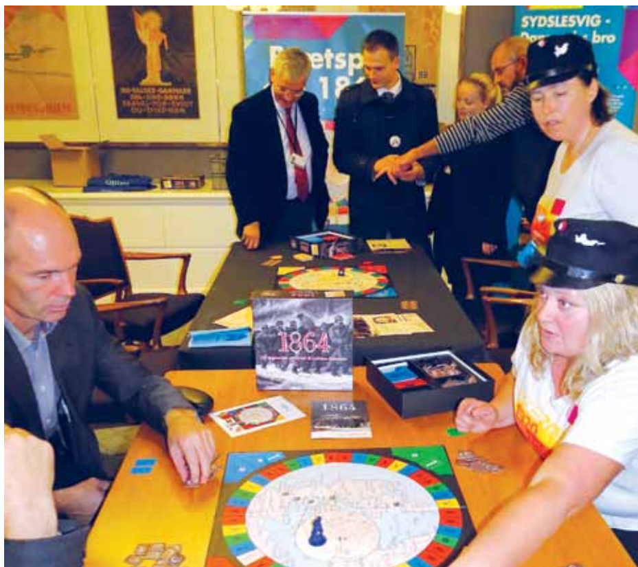
Grænseforeningens 1864-spil var samlingspunkt af den mere underholdende slags i det danske mindretals stue ved kulturnatten på Christiansborg i 2014.