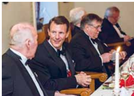
HKH Prins Joachim hyggede sig virkelig den aften i Knudsgildet.