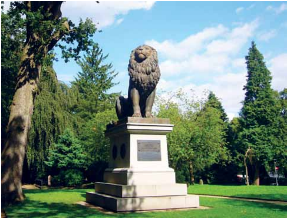
Istedløven i Flensborg.

den østrigske forbundshær i Graz/ Steiermark og det tyske forbundsværn fra Slesvig og Rendsborg ved de såkaldte trinationale arbejdsindsatser krigerggravene på de gamle garnisonskirkegårde i Slesvig og Rendsborg samt på Den gamle Kirkegård i Flensborg i stand. Ved indsatsens afslutning finder altid en fælles nedlæggelse af kransen med bånd fra de tre nationer sted.