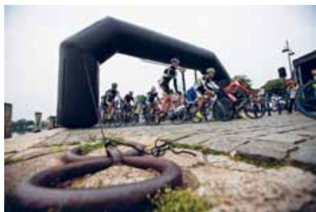
SdU sendte over 1300 cykelryttere afsted mod Viborg i forbindelse med DGLs Hærvejsløb.