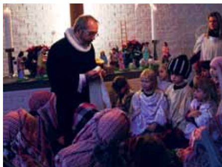
Fra julevandringen i Ansgar Flensborg.

I Egerførde væltede teaterrøg ud fra garagen ved den danske kirke. Lidt forskrækkede, men også nysgerrige gik