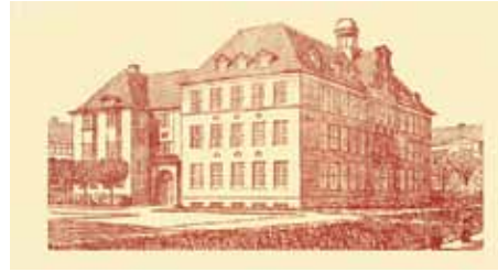
Duborg-Skolen for små 100 år siden.

Lad mig nu berolige læseren. I 2015 kommer der også et årsskrift, hvortil vi allerede er i gang med at samle stof. Ligger du inde med bidrag, f.eks. fotos fra klasesammenkomster, gerne ledsaget af en lille beretning om jeres sammenkomst, så send den til Duborg-