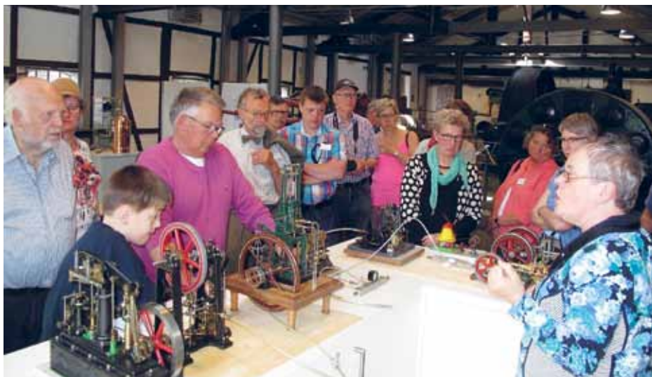
Rundvisningerne er populære.

Blandt andet er museet i stigende grad blevet opdaget af både enkeltpersoner og grupper fra Sydslesvig, også af