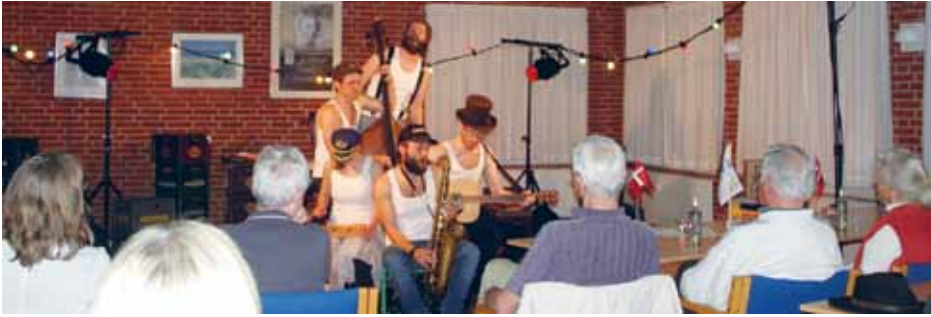
Med Skraldespandskabareten i Medborgerhuset i Egernførde afsluttedes teatersæsonen og så i SSF Rendsborg-Egernførde amt.