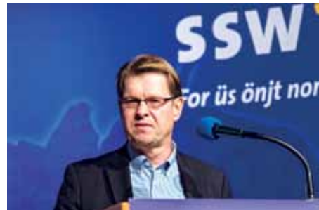
Ralf Stegner, SPDs gruppeformand i landdagen, her på SSWs landsmøde i sensommeren, roser samarbejdet med SSW i landsregeringen som værdifuldt og pragmatisk.

SSW har sagt ja til den nye kommunale finansudligning, idet det lykkedes os i forhandlinger at få ekstra tilskud til infrastrukturen og skolesocialarbejde, som blandt andet Slesvig-Flensborg og Nordfrisland amter profiterer af. Alligevel er der nogle kredse, der vil klage mod den kommunale finansudligning. Vi tror ikke på, de vinder deres sag. Hele forløbet omkring FAG-reformen viser dog, at SSW er et parti, der tør tage fat på de reformer, der er nødvendige for at udvikle landet.