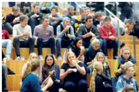
Fra ungekonferencen på A.P. Møller Skolen i Slesvig.

I jødedommen tæller man dagen med, hvor tingene er sket, og derfor genopstod Jesus på en søndag.