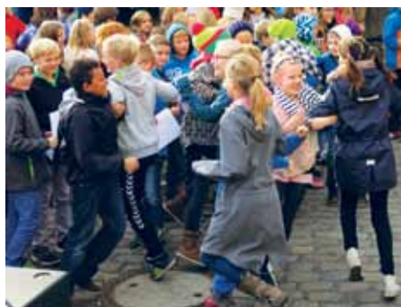
Fra Spil Dansk-elevkoncerten på Søndertorv i Flensborg.

Imod al forventning var der de fleste steder stor opbakning omkring det grundlæggende i modellen, og Sydslesvigkonferencen på Jaruplund Højskole i januar 2015 viste ligeledes, at der er mange, der gerne vil have undersøgt mulighederne for en mere hensigtsmæssig struktur for det danske mindretal under bibeholdelse af de små enheder og den kulturelle mang-