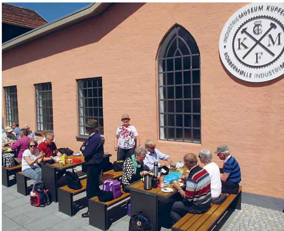
Picnichjørnet er populært blandt museets gæster.

vicegebyr indendørs i foredragshjørnet. For opsyn og brug af service og glas, samt rengøring opkræves udover entrégiften et servicegebyr på 20 euro for grupper på indtil 20 personer, ved større grupper på 40 euro. Grupper har desuden mulighed for efter aftale at bestille kaffe for 1 euro pr. person - museet har derimod ikke tilladelse til at sælge kage.