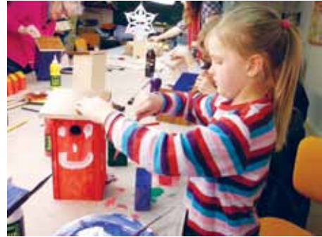
– og nogle kan selv.