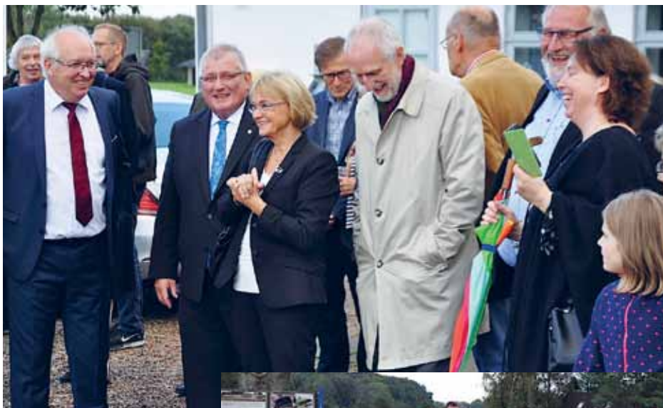
Det forventningsfulde, feststemte publikum venter med spænding på de drønnende knald fra 1854-kanonen i anledning af jubilæumsreceptionen.