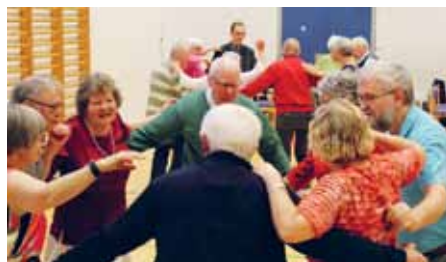
Der blev leget.