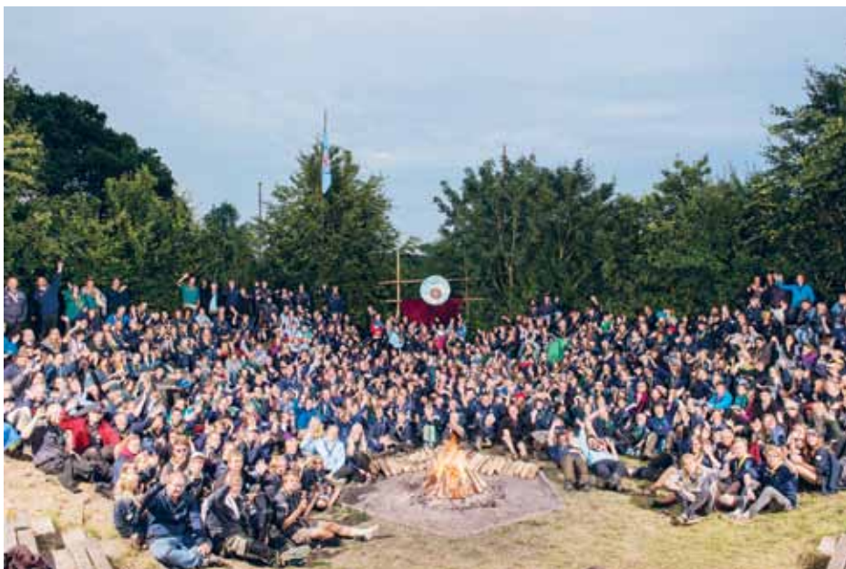
600 spejdere til jamborette på Tydal.

fyldt med spændende og lærerige aktiviteter. Tydal summede af glæde og en god gejst i en uge, og vi overtrumfede os igen selv.