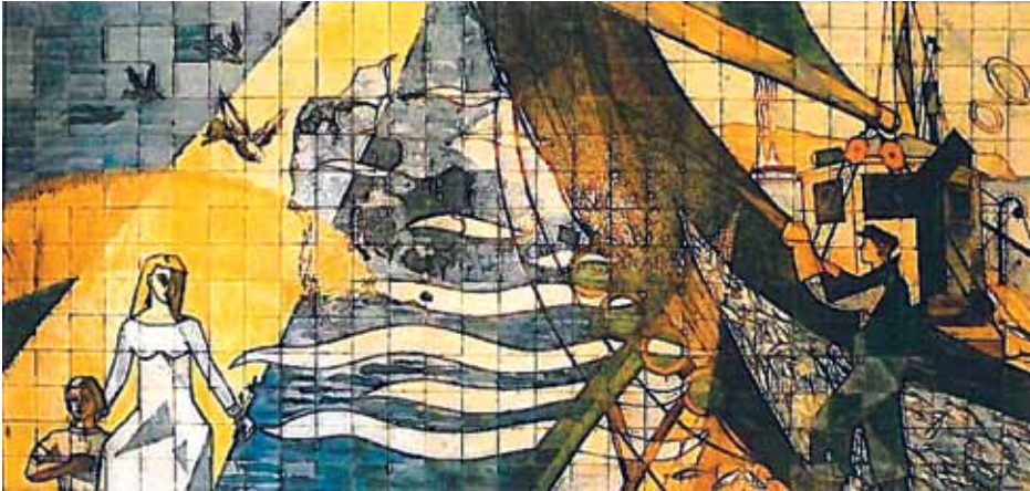
Relieffet i det gl. Husumhus.