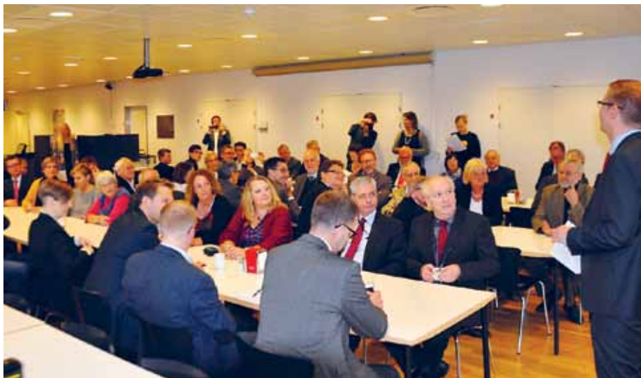
Det sker ikke alle dage, når det danske mindretal er på folketingstur sammen med Grænseforeningen, at delegationen modtages af en minister. Men i 2014 skete det: Skatteminister Benny Engelbrecht tog imod.

Den ministerielle håndtering af sagen viser, at der er behov for kontinuerlig oplysning om det danske mindretal og Danmarks officielle politiske, kulturelle og finansielle forbindelseslinjer til Sydslesvig. Vore studenter er jo ikke tyske studenter, men sydslesvigske studenter udrundet af mindretallets danske skolevæsen.