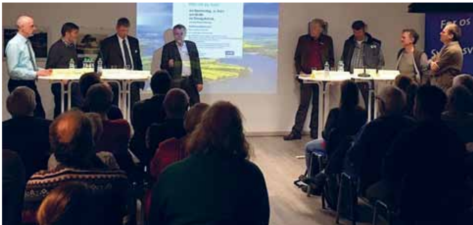
Fuldt hus til dialogmødet om Sliens dårlige vandkvalitet.