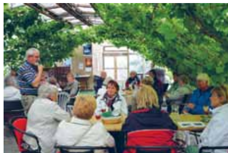
Aktive Kvinder i Flensborg på sommerudflugt til Årø. Guidet rundtur på øen - og her: smagsprøver hos vinbonden på Årø.

I Egernførde mødes de hver uge - om eftermiddagen de "ældre" og om aftenen de "yngre". De deltog i Nordens Husmoderdag og så filmen "Danmark". De har haft påskebasar, har stået for kaffebordet både til årsmødet og til byens "Aktion Ferienspaß". De har været på mindre udflugter og har udstillet håndarbejder på rådhuset.