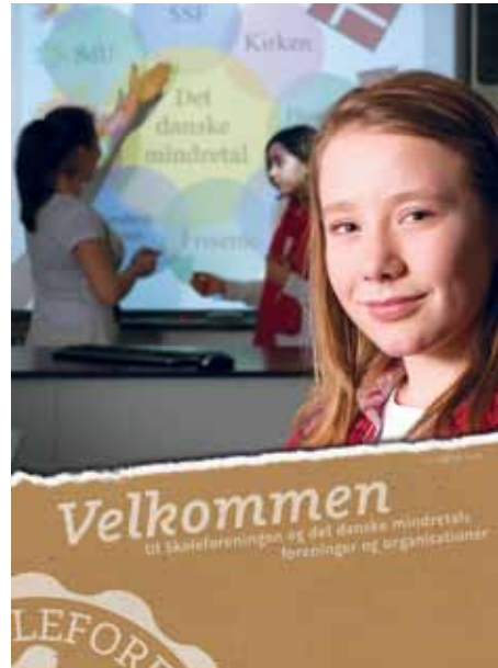
Skoleforeningen har styrket sin oplysningsindsats over for nye medlemmer med et nyt velkomsthæfte, der informerer om mindretallet i sin helhed. (Foto: Gertrud Terman- sen).

I flæng kan nævnes et lille udpluk: filmfestival, lejrskole og efterskoleophold, udvekslingsbesøg, børneteater, oplæsningsseancer, frivillig musikundervisning, kor- og atletikstævner, Grøn Festival, klassisk musik i børnehøjde, skolefritids- og heldagsskoleaktiviteter, Sydslesvigman, efterskoledag, lypiger i New York, skurke i Berlin og innovationspris til eleverne i Risum Skole/ Risem Schölj.