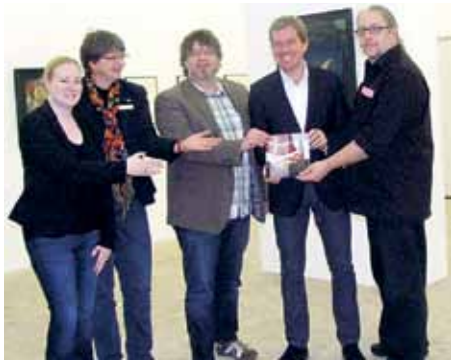
Fra præsentationen af "Dänisch in Kiel"-brochuren i Kiel.

det. Den ene fører gennem den indre by og kan gennemføres til fods, med bil eller offentlig transport. Den anden tur beskæftiger sig med det nordlige Kiel og kan udforskes med cykel eller bil.