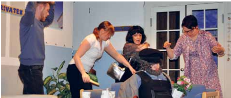
Action på scenen i Harreslev.