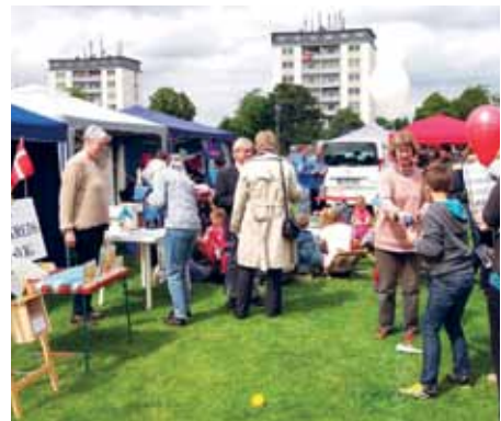
Infoboden på friluftsmødepladsen i Flensborg.

På årsmøde-friluftsmødet i Flensborg søndag den 21. juni var der igen mange, som kiggede ind til vor in-