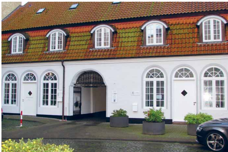
Slesvigsk Kreditforening er flyttet fra Harreslev til Union-Banks gård i Flensborg.