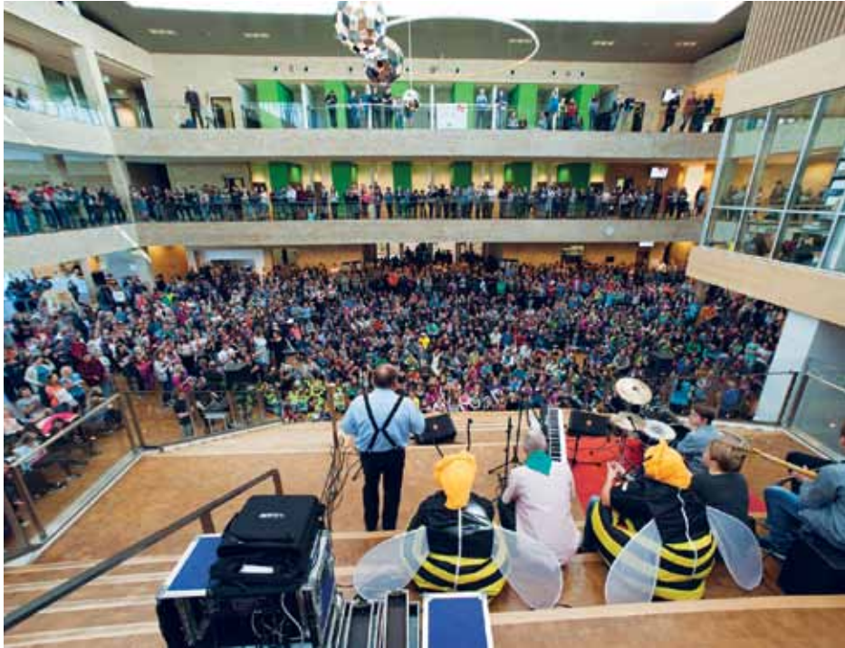
2000 børn og unge og flere hundrede voksne var i maj samlet til Grøn Festival på A.P. Møller Skolen i Slesvig.

Ja, man kan blive helt forpustet; men alt i alt vidner det om, at Skoleforeningen sprudler af liv og af mange spændende aktiviteter.