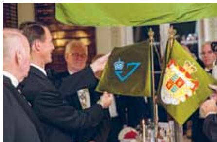
Hans Kongelige Højhed Prins Joachim brugte god tid til at studere standerne, og han udtrykte stor beundring for den kunstneriske udførelse.

Oldermænd nævnte fonde og organisationer, som har støttet gildet. Kirsten Langkildes Legat, Sydslesvigsk Udvalg af 5. Maj 1945, Rislum Fonden og Union-Bank har alle bidraget på forskellig vis.