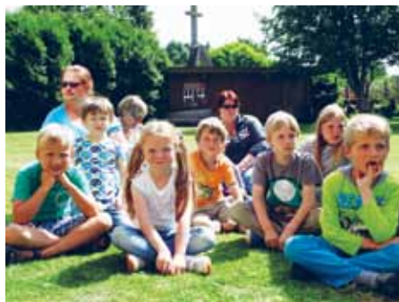
Det er ikke så nemt at få nye medlemmer i de af amtets distrikter, hvor der hverken er en dansk børnehave eller skole, men i Tønning og Garding er skole/ børnehave hhv. børnehave - endnu.

Tidligere gik Sydslesvig til Ejderen, men vi må erkende, at man ikke blot kan bosætte sig 3-5 km nord for Tønning. Man kan også flytte til syd for Ejderen - en ny virkelighed?