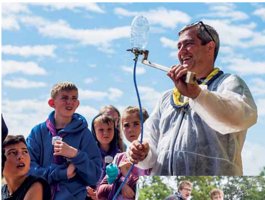
Spejdere er heller ikke nervøse for at eksperimentere med naturkræfter.