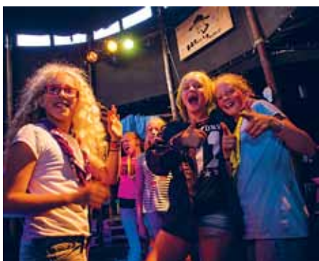
Jamborette er ikke udelukkende klassisk spejderaktivitet; der er også bl.a. diskotek.

100 af vores yngste spejdere kom, da vi inviterede til "ulvedagen" på Tydal.