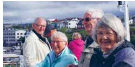
Turen til Færøerne var en succes. Her ses glade deltagere fra Sydslesvig.