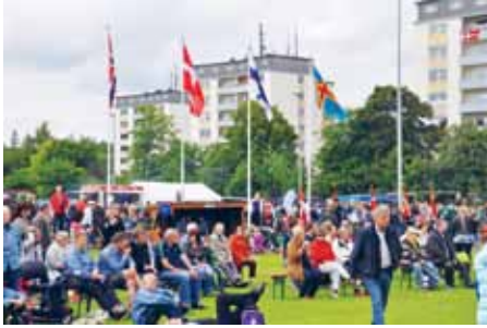
Ung og gammel, enlige og familier - årsmøderne er samlingssted for alle, fra nord og syd for grænsen.

Vi er glade for alle de repræsentanter, der fandt vejen til Sydslesvig og kom med taler og hilsner, mange med afsæt i årets motto.