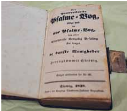
Det danske mindretals gave til Dronning Margrethe i anledning af hendes 75 års fødselsdag: En kostbar salmebog fra 1838.

Vi er opmærksomme på, at tiderne forandrer sig, og at vi løbende skal evaluere vore aftaler og ved behov tilpasse dem tidernes krav.