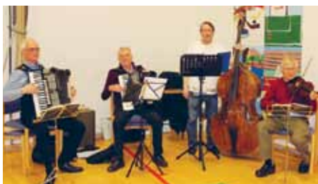
Der blev spillet.