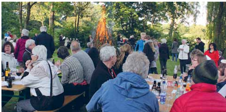
Sankthansfesterne i amtet er altid velbesøgte.