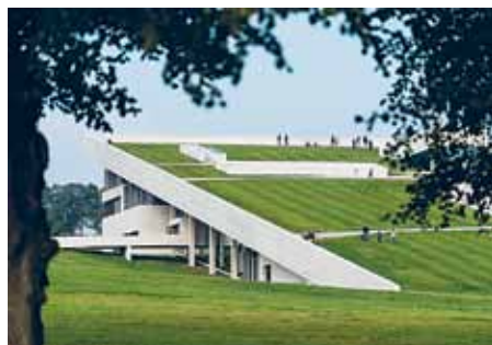
Det nye Moesgaard og terrakotta-udstillingen begejstrede.