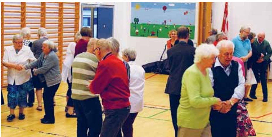
Der blev danset.

I anledning af Valsbøl og Omegns Folkedanseres 25-års jubilæum og Dronning Margrethes 75-års fødselsdag afholdt foreningen et royalt madkurvetræf.