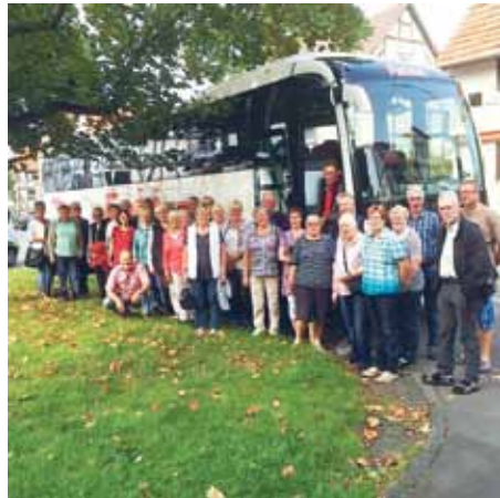
Enighed blandt deltagerne: Heidelberg-egnen er et flot område at bevæge sig rundt i.