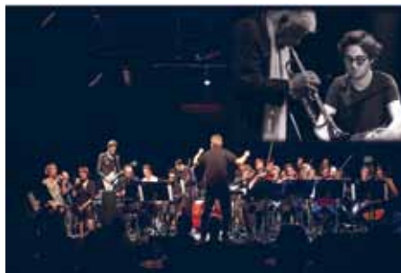
To verdensstjerner, Palle Mikkelborg og Mike Sheridan, mødte det unikke bigband Blood Sweat Drums n' Bass til "Jazz på Flensborghus".

Der er mulighed for privat at bakke op omkring festivalen ved at blive medlem af festivalens støtteforening folkBaltica e.V.