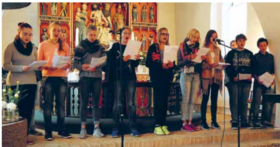
Fra konfirmand-gudstjenesten i Abild kirke.