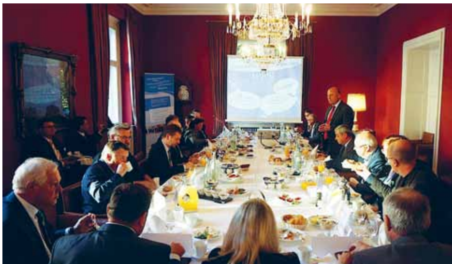
Til parlamentarisk frokost med bl.a. mindretalskommitteret Hartmut Koschyk (stående).

om ørerne, når det gælder om igen og igen at minde forbundspolitikerne og forvaltningen om deres ansvar for mindretalspolitikken i Tyskland.