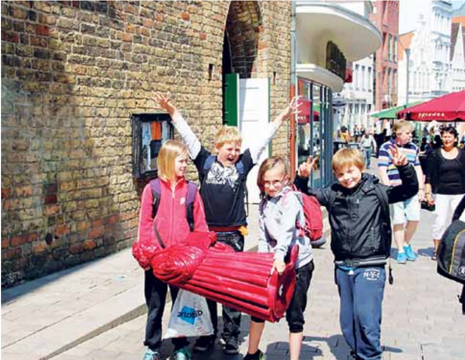
På børnebibeldagene oplevede børnene bl.a., at salmesang er bibelfortælling - her ved Helligåndskirken i Flensborg.