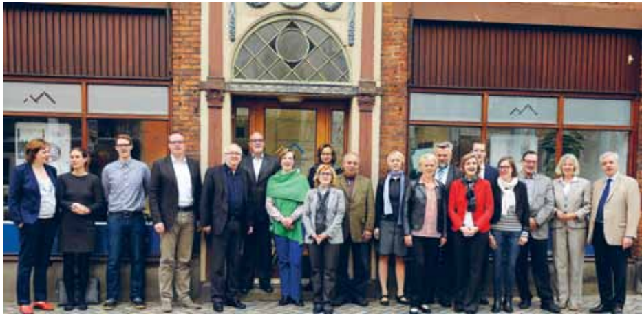
Indenfor rammerne af Interreg 4A-projektet „Mindretallenes Hus“ i Flensburg og på basis af Forum af Europæiske Mindretal inviterede mindretalsunionen FUEN til et bredt sammensat tænketank-møde i maj.