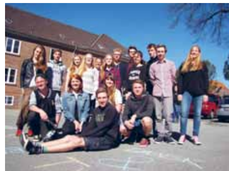
Fælleselevrådet opfordrede i april alle skoler til at deltage i Grænseforeningens hap-pening: Tegn Danmarks fremtid.

Undtagelsen er Harreslev Danske Skole og Hiort Lorenzen-Skolen, som begge er grundskoler, men som har HFO'er. Forskellen mellem en SFO og en HFO ligger i fleksibiliteten i tilmeldingen og i udbuddet af aktiviteter, men det pædagogiske indhold i arbejdet er ens for begge tilbud. Begge ordninger er med til at udvikle børne- og læringsmiljøerne på skolerne.