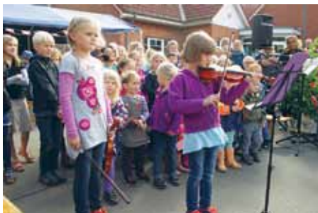
Skolebørn og børnehavebørn fra Askfelt optræder ved årsmøderne.

Debutanten blev SSF Risby, og turen gik til Krusmølle og julebyen i Aabenraa. I Krusmølle er der julestemning, og man kan efter en rundgang i butik, værksted eller gårdsplads nyde lidt mad eller æbleskiver i den hyggelige stue, som er indrettet i en af de gamle stalde i bygningen. Udenfor er der aktiviteter for børnene, og de kunne støbe lys eller løbe om kap med forskellige hurtige dyr i form af skilte opsat på gårdspladsen. Det var en dag med kold vind og efter nogle omblæste timer i Aabenraa gik turen til Christas Café i Vanderup, hvor man hyggede sig i Christas stuer med hjemmelavet lagkage og kaffe eller kakao.