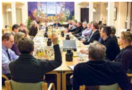
Samrådet 2014.

Dette repræsentantskab ville blive uhyre stort, og nærmest få karakter af at være et parlament. De store organisationer – SSF, SSW, SdU, kirken, skoleforeningen samt den nationale frisiske forening – skulle være repræsenteret med deres ledende styrelser, mens husmoderforeningen og kvindeforeningen hver skulle have to repræsentanter og 13 benævnte små foreninger skulle repræsenteres ved deres formænd. I øvrigt blev det i udkastet noteret, at ”Repræsentantskabet indkaldes og ledes af Sydslesvigsk Forenings formand”.