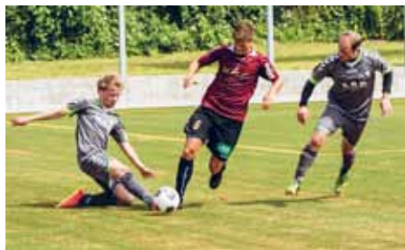
En festdag for IF Stjernen i Flensborg og alle andre sydslesvigske fodboldelskere, da den nye kunstgræsbane blev indviet i Engelsby.

Velvidende at disse store arrangementer er forbundet med masser af forberedelser og koster en masse frivillige arbejdstimer for vore udvalg og de involverede foreninger, så kan vi også konstatere, at det er utroligt givende for deltagerne at møde os på "vores hjemmebane" og derved "opdage" og blive klogere på SdU og mindretallet.