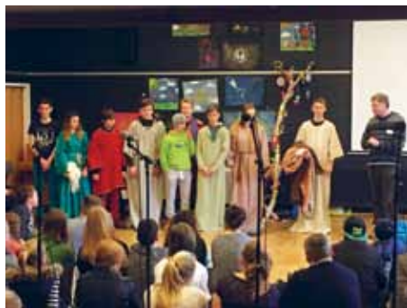
Fra konfirmandlejren på Christianslyst.

Der deltog 100 konfirmander og 25 instruktører på dette års lejr. Tema var "livsglæde".