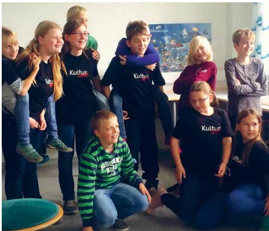
KulturCrew-elever på Husum Danske Skole.

vores institutioner er en merværdi for mindretallets børnefamilier.