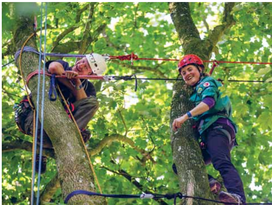
Udfordringer skal bestås.