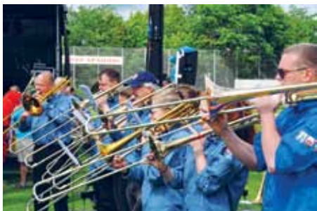
Uundværlige ved de sydslesvigske årsmøder, de friske FDFere fra hele Danmark.

Desforuden aftenhyggemøder, grillaftner, Aktivitetshusets og SdUs musikkonkurrence "New Star Contest", sangaftner, kirkekoncerter og gudstjenester. Tak til alle frivillige og deltagere ved disse arrangementer. Det er helt fantastisk med disse mange mulighe-