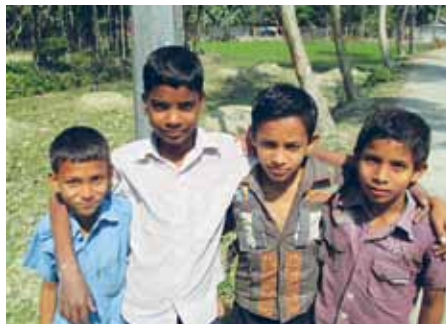
Børn i Bangladesh.

Bangladeshkredsen håber derfor, at mange i Sydslesvig fortsat vil være med til at give nogle bangladeshiske børn et bedre liv.