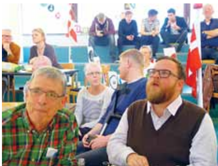
Der var spænding til det sidste på valgaftenen på Flensborg Bibliotek.

gerantal på over 60 personer – alt fra 12-70 år plus en hund, må vi antage, at der er basis for en ny tradition med at samles til folketingsvalg. For at høre lidt om dansk politik – på den uformelle måde – og sammen med andre følge de spændende begivenheder og indslag på TV. Der blev også talt politik ved bordene – dansk politik, men også set fra Sydslesvig – og de sidste gæster måtte smides ud lidt i kl. 23.