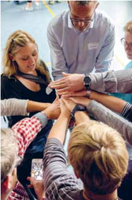
God læring og undervisning forudsætter veluddannede pædagoger og lærere.

Vi glæder os til at komme i gang med at realisere de nye muligheder og håber, at ordningen kan være med til at styrke undervisningsdifferentieringen og inklusionen af elever med særlige behov.