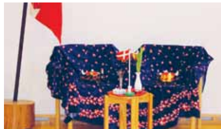
Dronningestolen stod dog tom...