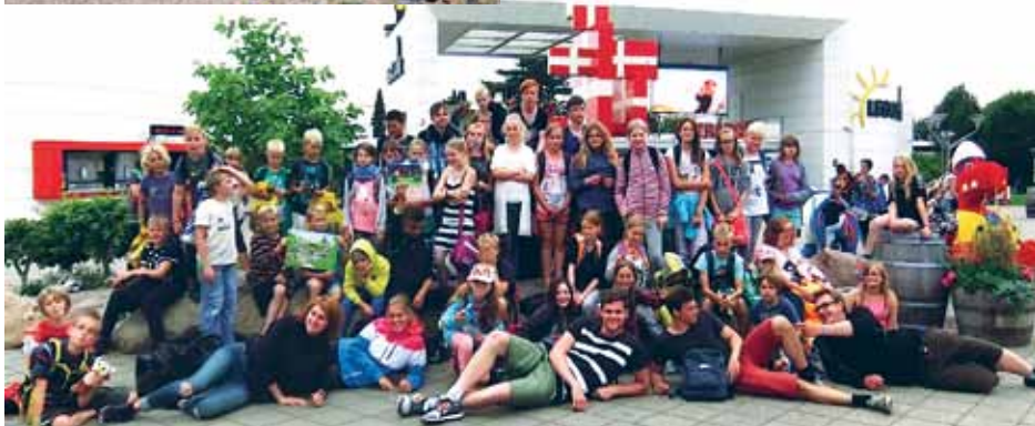
Fantastisk ferie for Vesterled-børnene - gruppefoto fra Legoland og fra Wowparken.

buskørsel, som er forløbet fint med undtagelse af enkelte byer, hvor busen havde problemer med at holde det planlagte sted, som for eksempel bag Københavns Hovedbanegård i København. Takket være vores engagerede rejseledsagere, som hurtigt fik gang i kommunikationen med ferieværterne, og de afslappede og fleksible buschauffører lykkedes det spontant at finde et alternativt holdested i hovedstaden. Det er vigtige erfaringer at samle for Rejsekontoret i forhold til fremtidens busruter.