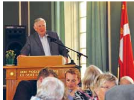
Mere end fuldt hus til årsmødet på Duborg-Skolen - med sang ved Torsdagskoret, kritisk-kærlig taler ved fhv. minister Torben Rechendorff (foto) og europaparlamentarikeren Morten Messerschmidt (i forgrunden).

Tak til alle orkestrene for jeres indsats både ved de enkelte møde, friluftsmøder, optog, gudstjenester og den afsluttende fælleskoncert på Søndertorv.