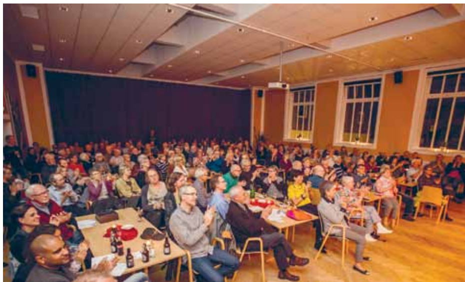
Fuldt hus på Flensborghus til koncerten med Danmarks Radios Big Band i oktober 2014.

år har kunnet præsentere det ypperste inden for dansk jazz, bl.a. bigbandet Blood Sweat Drum n' Bass feat. Palle Mikkelsen & Mike Sheridan samt koncerten med The KutiMangoes. Begge koncerter var udsolgt.