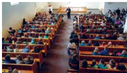
Fuldt hus i Ansgar kirke til salmesang.

Konferencen var arrangeret af Samtaleforum for Unge og Kirke (SUK) og MBU.