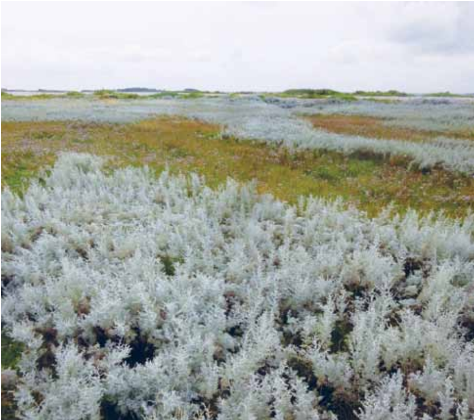
Strandmalurt ved Fyns Hoved.

kuseret alvor tager vi hvert år på en ørejse, på skift nord og syd for grænsen; i 2014 til Femern og i år til den forhenværende ø Hindsholm hhv. til Fyn. Hvis det er muligt, finder vi kvindelaterede emner på øerne, men bruger også tiden til mere afslappende samtaler og diskussioner.