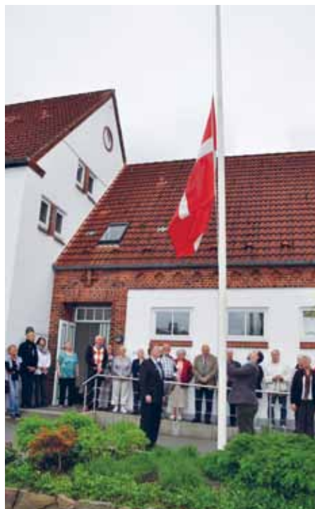
Flaget tages ned - og så starter et af de mindre årsmøder, her ved menighedshuset på Adelby Kirkevej i Flensborg.