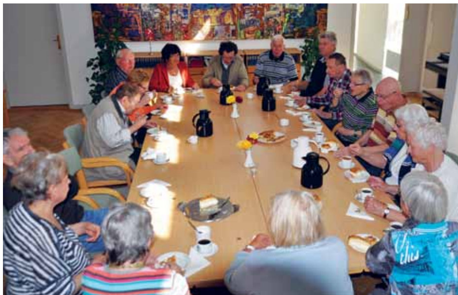
Kaffehygge på Flensborghus.