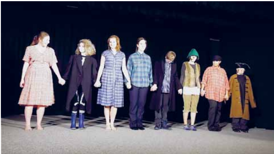
Jöögedteoter önj Bräist.