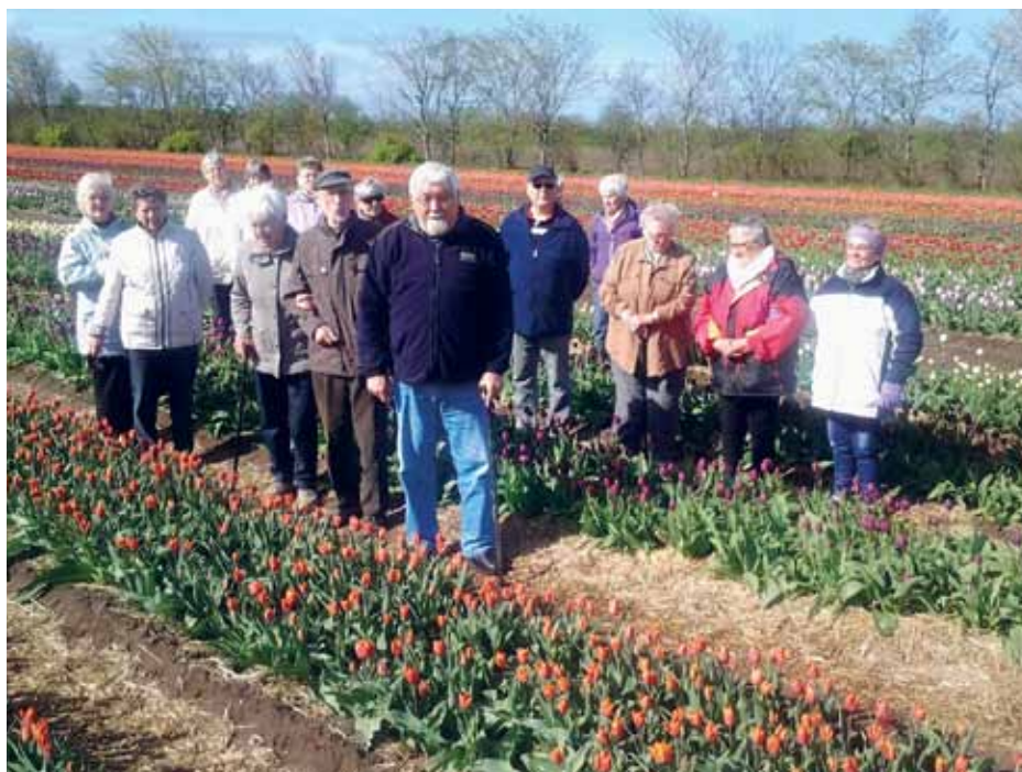
Glade og taknemmelige danske sydslesvigere kigger nærmere på en tulipanmark under deres ophold på Bennetgaard.