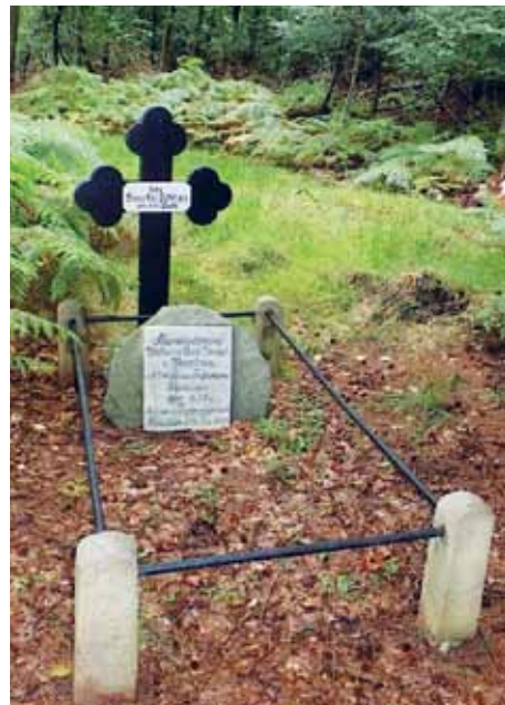
Gravstedet i Popholt.

Gerd Stolz: Dänische, deutsche und österreichische Kriegsgräber von 1848/51 und 1864 in Schleswig-Holstein.