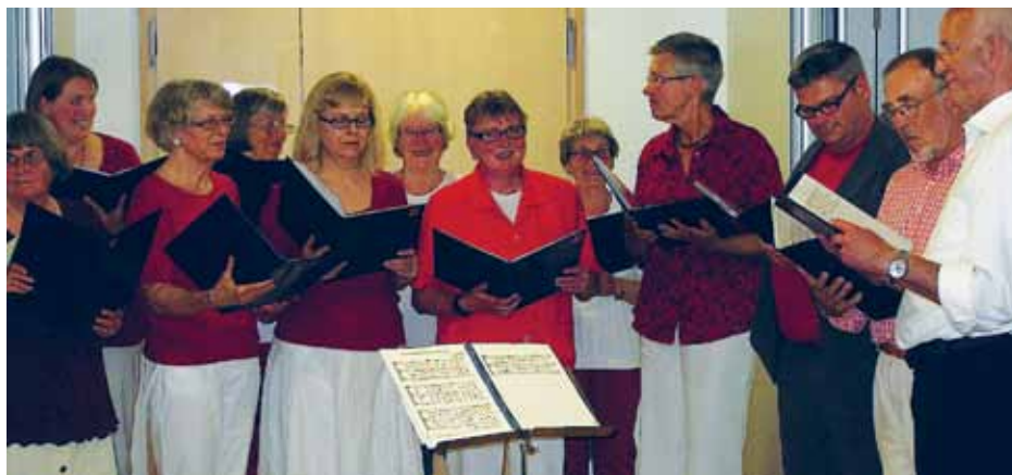
Koret øver mandag aften.