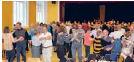
140 folkedansere, på vej til Havnespidsen i Flensborg og uden dragter ved aftenfesten på Flensborghus.