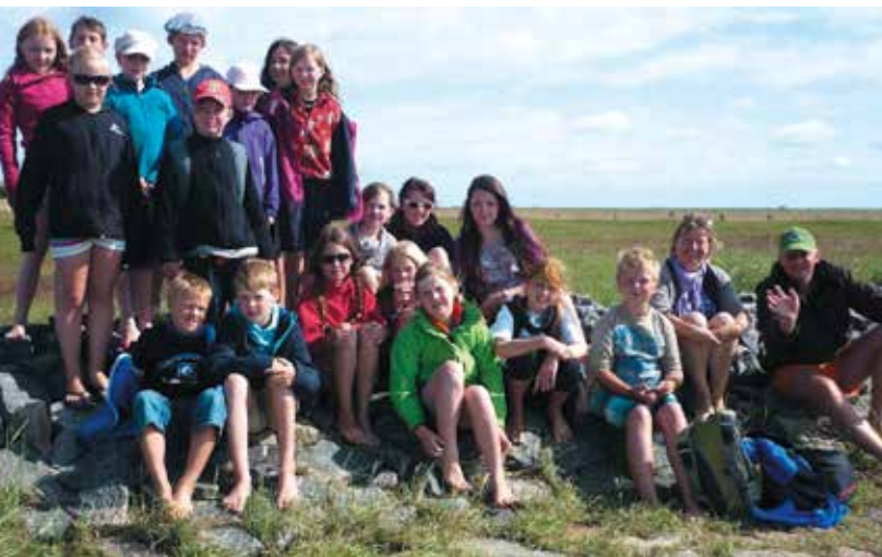
På udflugt til Hallig Hoge.

Siden 2006 arrangerer Friisk Foriining en europæisk filmfestival for spillefilm på mindretalsprog hvert andet år.