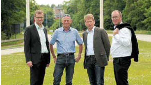
Fire samarbejdende chefredaktører.

Den daglige ledelse varetages af direktionen, der består af chefredaktøren, der også er adm. direktør, og økonomidirektøren.