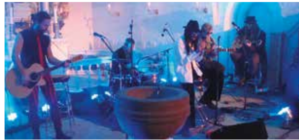
Koncert i Helligåndskirken

De sydslesvigske menigheder finansierer ansættelsen af to deltids ungdomskonsulenter.