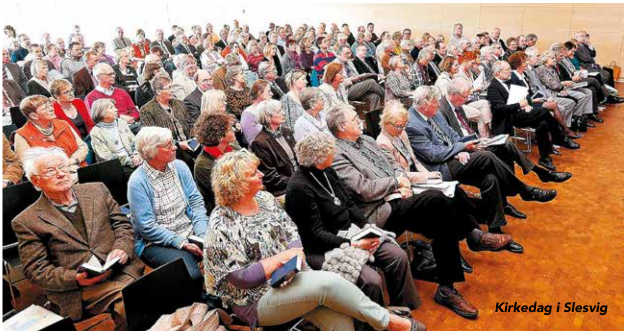
Kirkedag i Slesvig

Uforandret godt og nært har forholdet til Den Danske Folkekirke altid været. Støtten har været