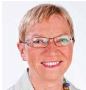
Anke Spoorendonk kultur-, justits-, og europaminister