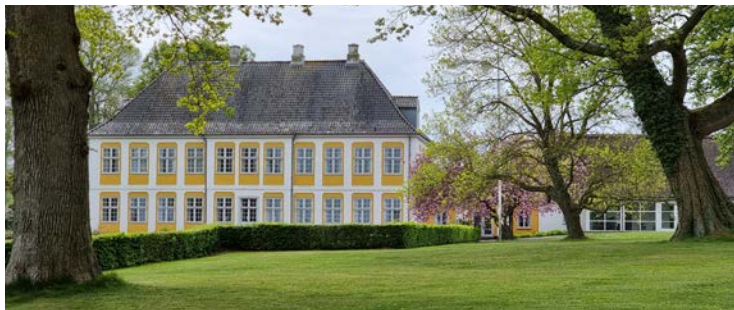
↑ Vi passerer Sandbjerg Slot, der i dag er et moderne Møde- og konferencecenter SANDBJERG GODS.