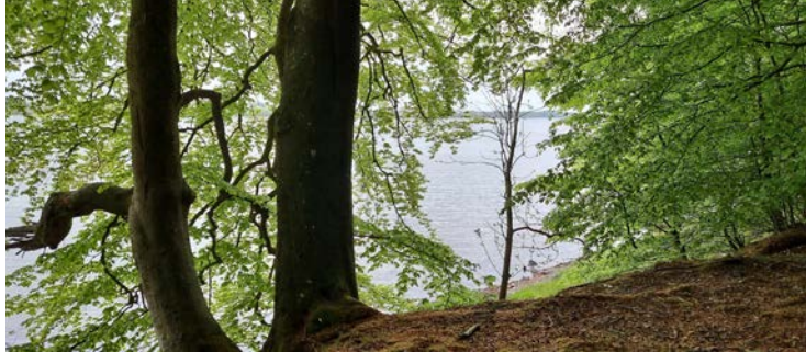
↑ Her er der spor af de preussiske troppers overgang over Alssund til Als, hvormed 1864-krigens sidste fase blev indledt.