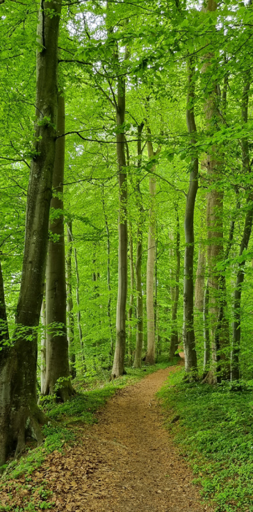
↑ Sottrupskov - en smuk bøgeskov