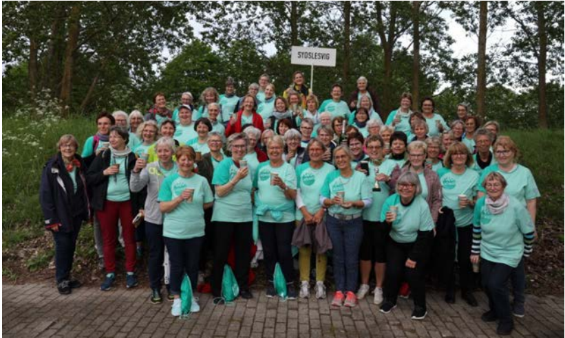
Foto: sydslesvigske deltagere i 2019