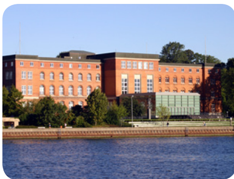
Landdagen i Kiel