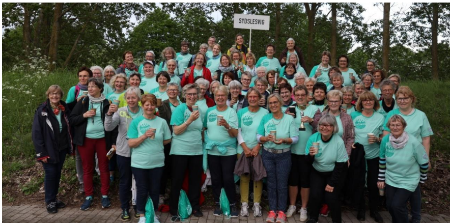
Foto: sydslesvigske deltagere i 2019