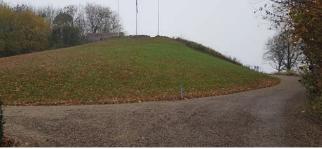
↑ Vejen op til toppen af Knivsbjerget