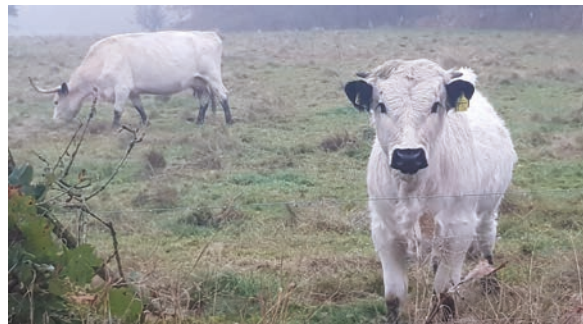
↑ Ved siden af vandrestien. Her græsser verdens sandsynligvis ældste kvæg race, hvoraf omkring 1.000 dyr findes på hele verdensplan: Hvid park kvæg