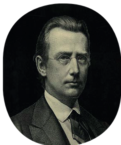
(Peter Arnold Heise)