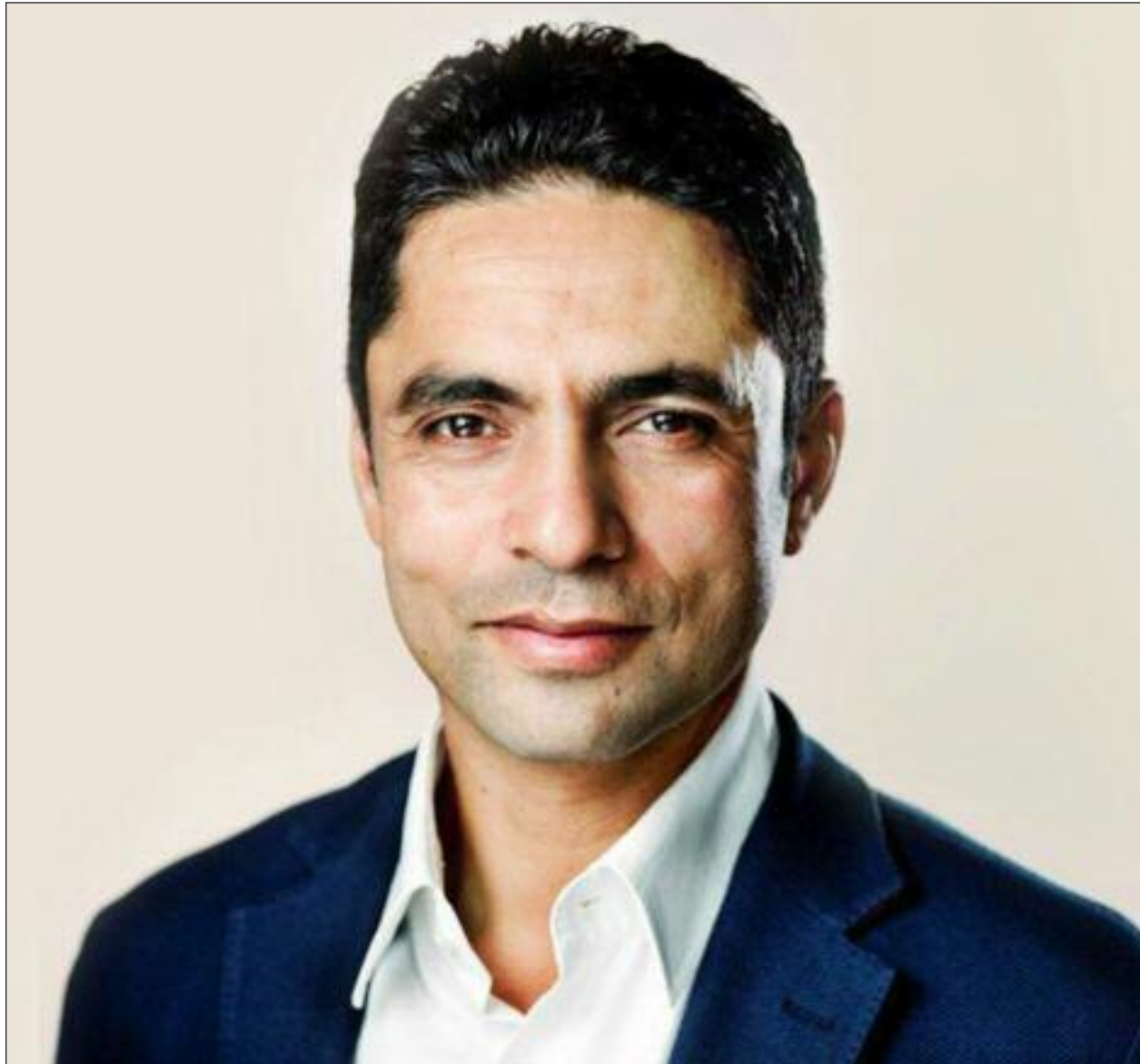
Minister for ligestilling og kirke og minister for nordisk samarbejde