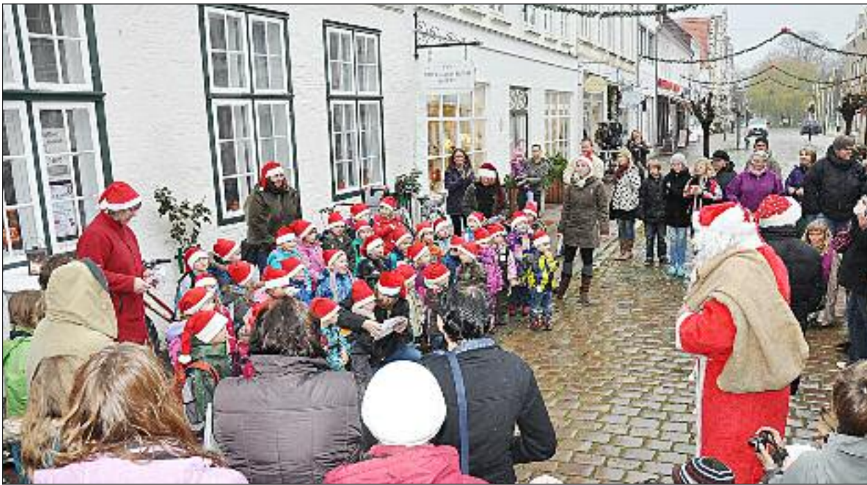
Børnennisekor og julemand sørgede for, at stemningen var i top.