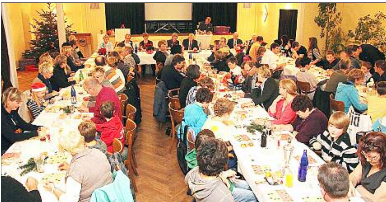
Stor tilslutning.