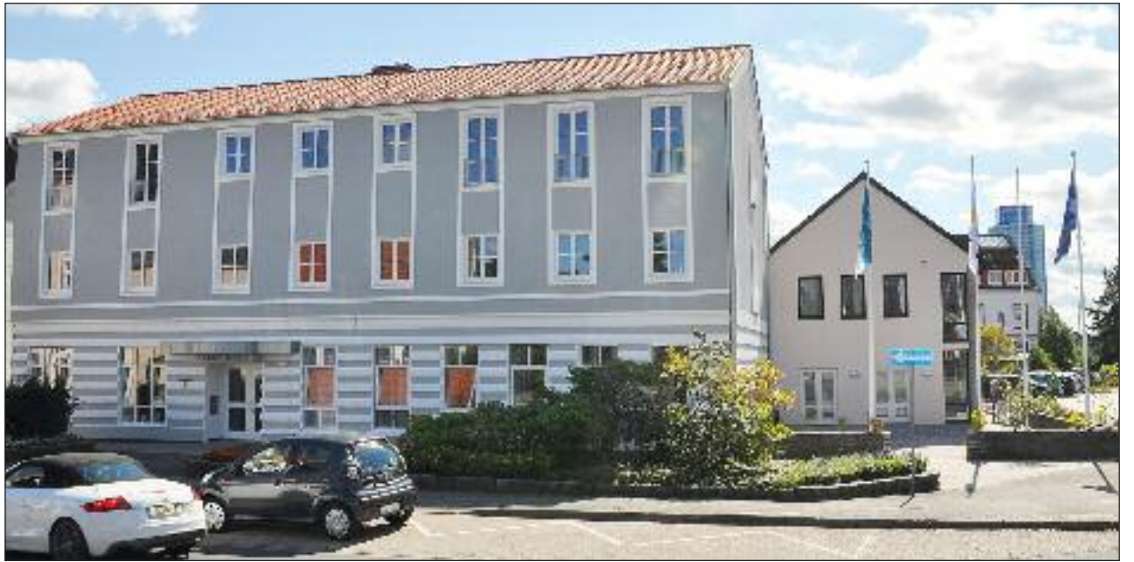
Slesvighus bliver spillested for Landestheater fra sensommeren. Istandsættelsen af salen er i fuld gang.