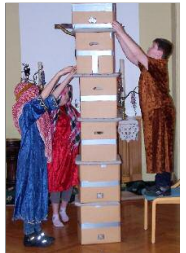
ms Babelstårnet bygges.