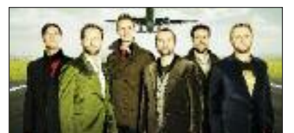
FRIBILLETTER: Til Basix-koncerterne i Flensborg og Ladelund kan man vinde hver en fribillet. Svar på, hvilke musikinstrumenter bandets medlemmer spiller på, send det med navn, adresse osv. og valgt koncertsted til kontolet@sdu.de senest 8.3., og du deltager i lodtrækningen.

Siden starten har Basix kræset for både øjne og ører i en grad, så den 6-mand store vokalgruppe efterhånden har lagt alle - både publikum og de professionelle lyttere - ned. Med mere end 500 optrædere, guld- og platinplader samt 3-dobbelt vinder af den prestigefyldte amerikanske a cappella-award CARA, har Basix de seneste 5 år været her og der og alle vegne, og det lader til kun at være starten. Både til koncerter og i TV-shows er Basix ikke fremmede overfor at arbejde med superstjerner. Med navne som Westlife, Katie Melua, Mick Hucknall (Simply Red), Gavin DeGraw og Sissel har Basix begejstret med deres fantastiske klang og arrangementer, der spænder over pop, rock, soul, jazz og mere. Basix rammer enhver følelse med både egne sange og nye fantastiske versioner af nogle af de største hits nogensinde.