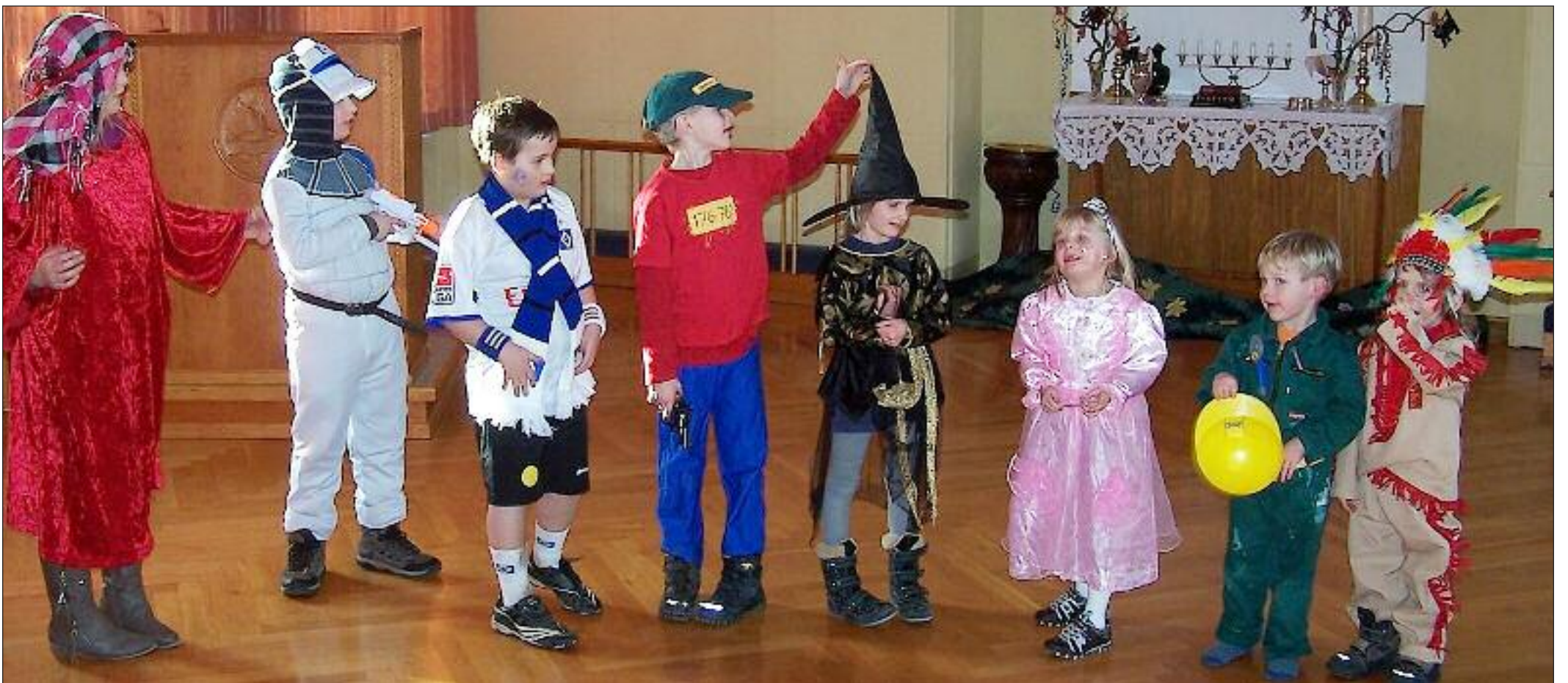
Flot kostumerede minikonfirmander.