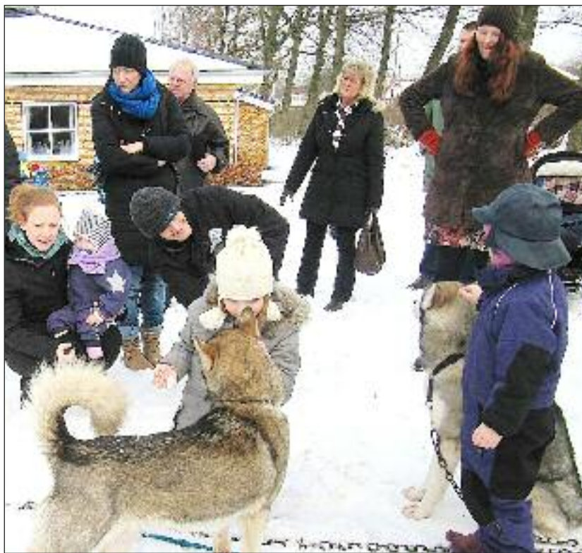
Der blev ingen direkte hundeslædekørsel den dag, fordi hundene og føreren ikke kendte området. Men deltagerne havde det rart med hinanden og hundene; og de gik en dejlig tur i skoven bag Det Danske Hus med dyrene.

[KONTAKT] For at få et lille indblik i grønlandsk kultur og inuiternes sociale traditioner havde Foreningen Norden i samarbejde med SSF Sporskifte inviteret til kaffemik i Det Danske Hus i Sporskifte en søndag i februar. Slæde og slædehunde er en naturlig del af enhver bygd på Grønland, og denne dag kunne man også som besøgende få et indblik i, hvordan slædehunde holdes, således at man imødekommer deres naturlige instinkter mest muligt og på denne måde gennem et samarbejde mellem føreren af slæden og hundene får optimale betingelser for at gennemføre et slædehundeløb. Familien Dunker fra Hytten Bjerge var kommet med et koppel slædehunde af racen sibirian huskies. Denne hunderace knytter sig tæt til mennesker og familien – alt andet betragter de som deres bytte. Vi fik en rigtig god indføring i, hvordan huskies skal holdes – disse hunde er brugshunde, som har brug for at arbejde og få motion. Hundene og de besøgende var utålmodige for at komme en tur i skoven omkring Det Danske Hus. Efter hjemkomsten var hundene lige varmet op – men de besøgende trængte til en kop kaffe og et stykke