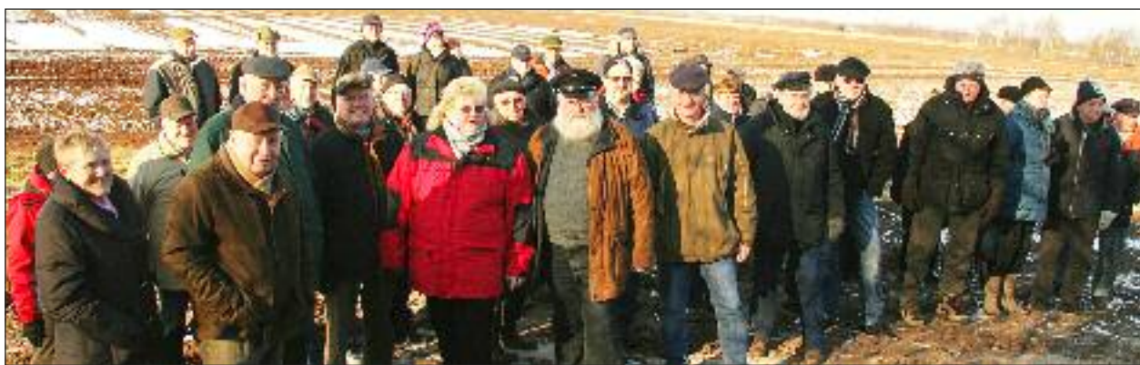
Die Teilnehmer.