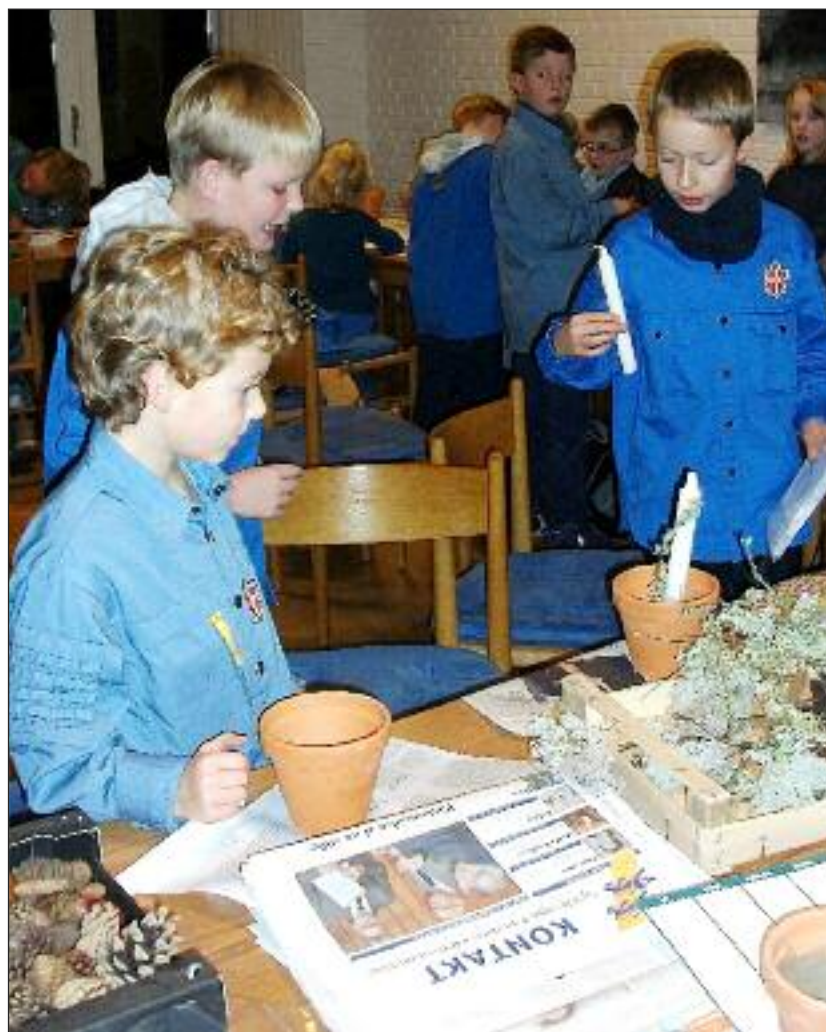
Fælles FDF-julestue i menighedslokalerne ved Ansgar kirke, hvor der blev lavet juledekorationer.