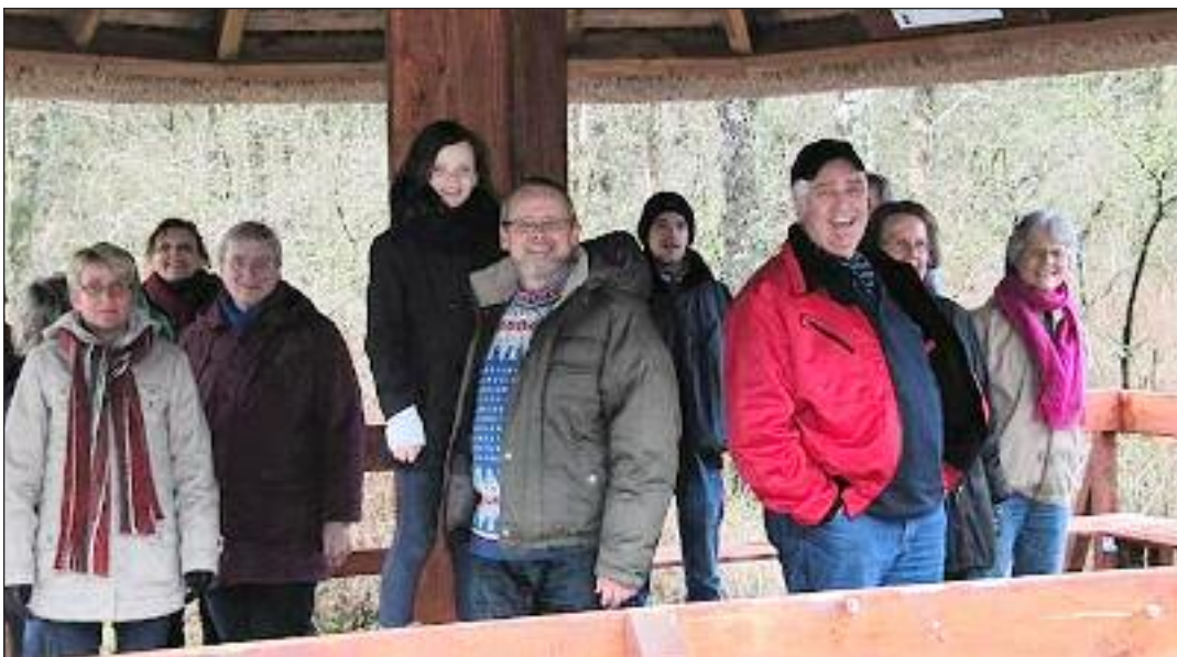
Veloplagte deltagere.