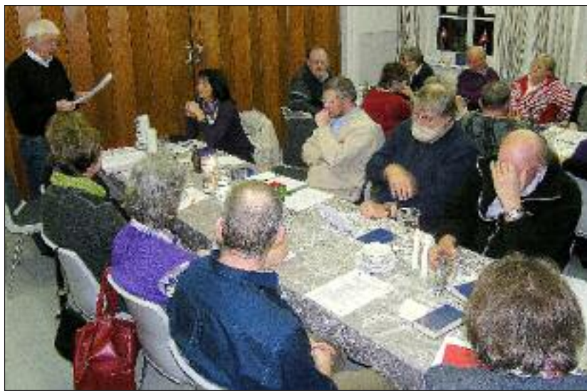
Generalforsamlingen - her Hatsted i 2011 - er en vigtig begivenhed.

I Frederiksstad mødes man i Paludanushuset den 7. februar kl. 19. Da der der spisning. Selve mødet begynder kl. 20. Og endelig holder Drage-Svavsted sin generalforsamling fredag den 17. februar kl. 19.30. Ifølge SSFs vedtægter er næstformand og kasserer på valg i 2012.