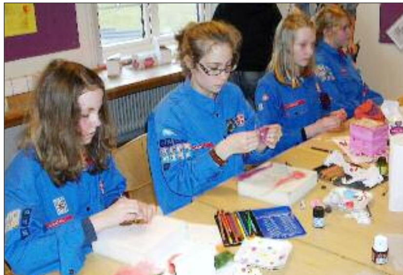
Væbner-pigerne fra FDF Flensborg på væbner-/seniorvæbner-weekend sidste år.

Da vinteren indtil videre virker mild, bliver FDF-møderne sandsynligvis afholdt ude ved Uglereden i Tarp fra 5. marts. Hvis det bliver tilfældet, er der FDF-møder hver mandag i marts kl. 17.00-18.30 i Tarp, Tarpholz 1. FDF-bussen kører som planlagt hver mandag, så alle kan komme rettidigt til FDF-møderne uanset hvor de afholdes.