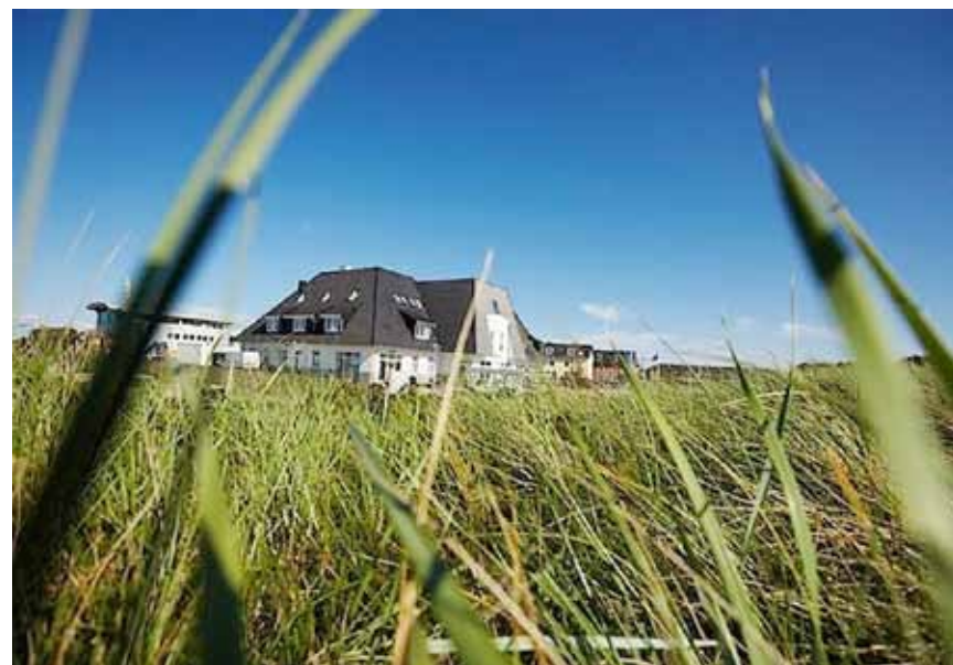
Rantum Dorfhotel dannede rammen om en mindretalsudstilling, der blev åbnet medio juli.