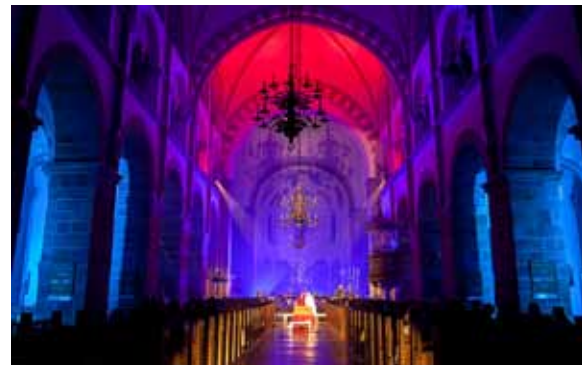
Fra sidste års Rued Langgaard Festival: Parsifal i Ribe domkirke.