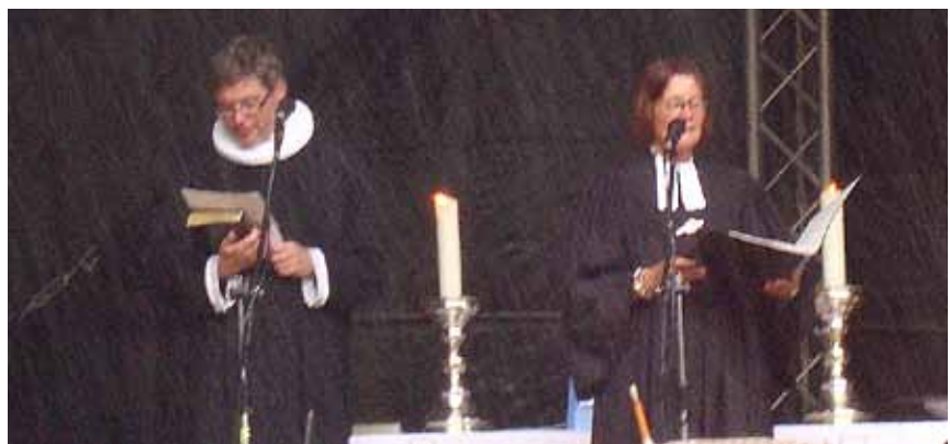
"Alle gode gaver, de komme ovenned..." Det gjorde de også til sidste års dansk-tyske hestemarkeds-gudstjeneste i Tønning. Men i år har arrangørerne planlagt, at det bliver tørvejr.