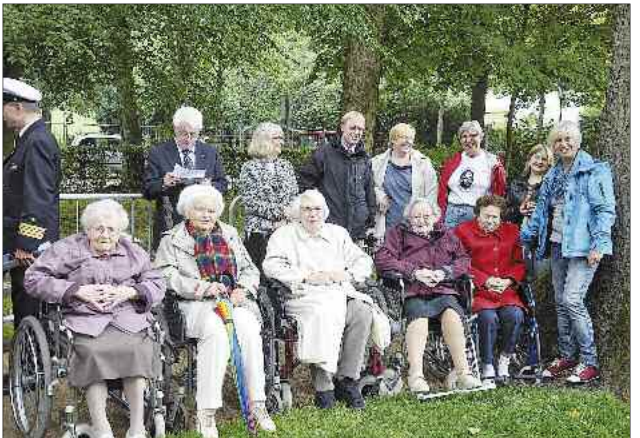
Dansk Alderdomshjem er altid med, med nogle beboere og medarbejdere, når der sker noget opsigtsvækkende i Flensborg - her fotograferet sammen med andre danske sydslesvigere.