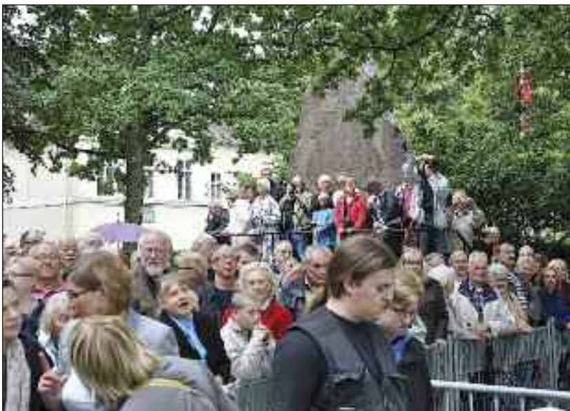
Nogle flere fulgte begivenheden fra bag om stakittet - her ligeledes et udsnit.