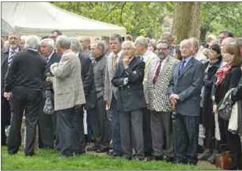
Mange var inviteret til at følge genindvielsen af Istedløven; her et udsnit.