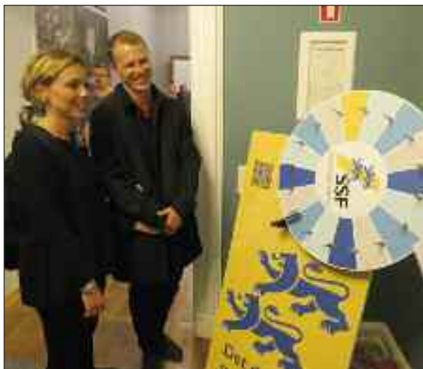
Lykkehjulet med Sydslesvig-quiz gjorde lykke.