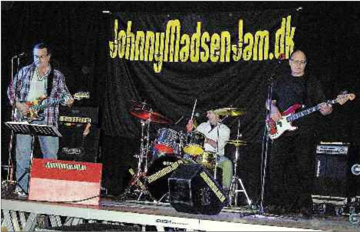
Det kan være svært at sidde stille, når Johnny Madsen Jam fyrer den af 1. november i Garding. Det var det i hvert fald i Frederiksstad sidst.