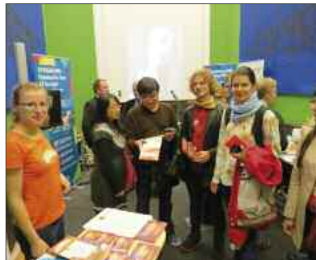
Også ungdommen var nysgerrig og kom et smut forbi hos sydslesvigerne.