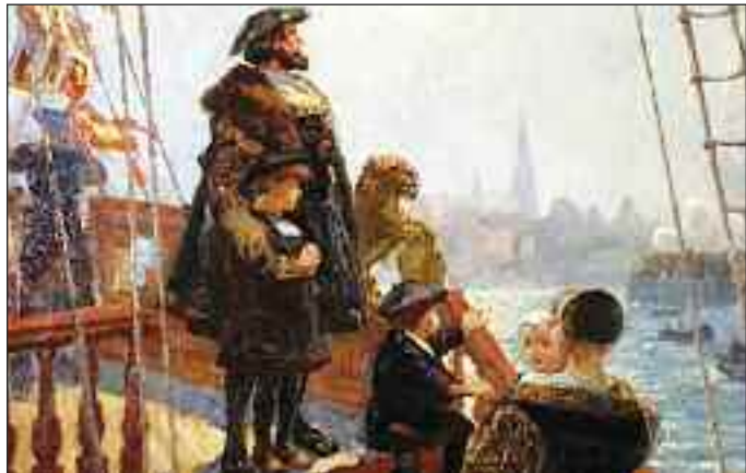
Christian 2. forlader sammen med sin familie København i foråret 1523.

[KIRKESIDEN] Krig, kirke, kærlighed og kongetrone kan være en farlig cocktail. Ikke desto mindre var det, det som Christian den 2. forsøgte sig med og som førte til 17 års fangenskab på Sønderborg Slot. En skæbne der bliver genfortalt på slottet i deres lille men meget fine udstilling. Fortællingen er tilmed krydret med et fint billede af kongen malet af Luthers gode ven og PR. maler Cranach den ældre.