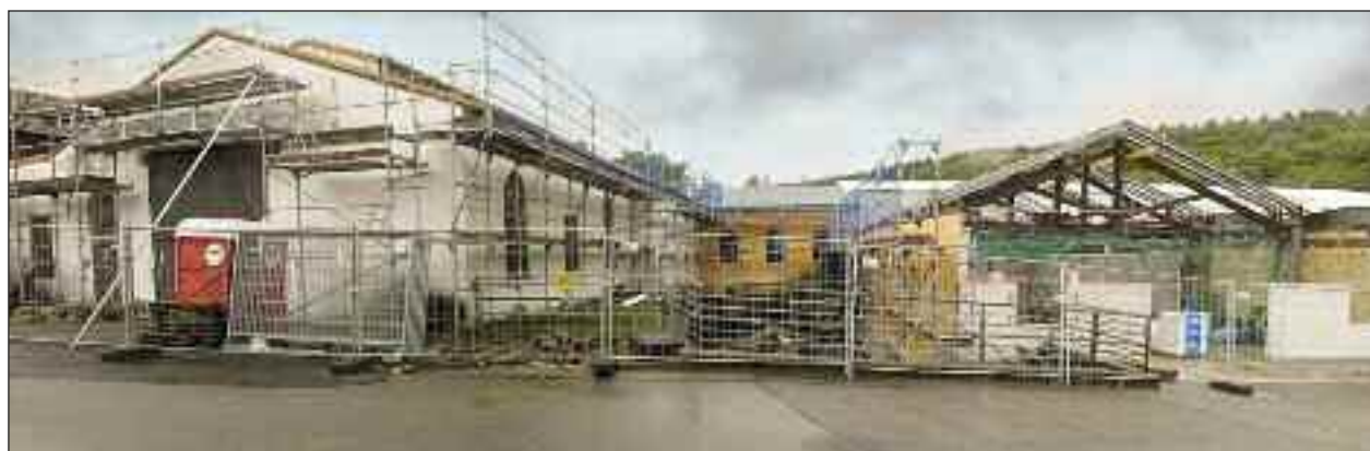
Industrihallerne, mens de så værst ud i august 2013.