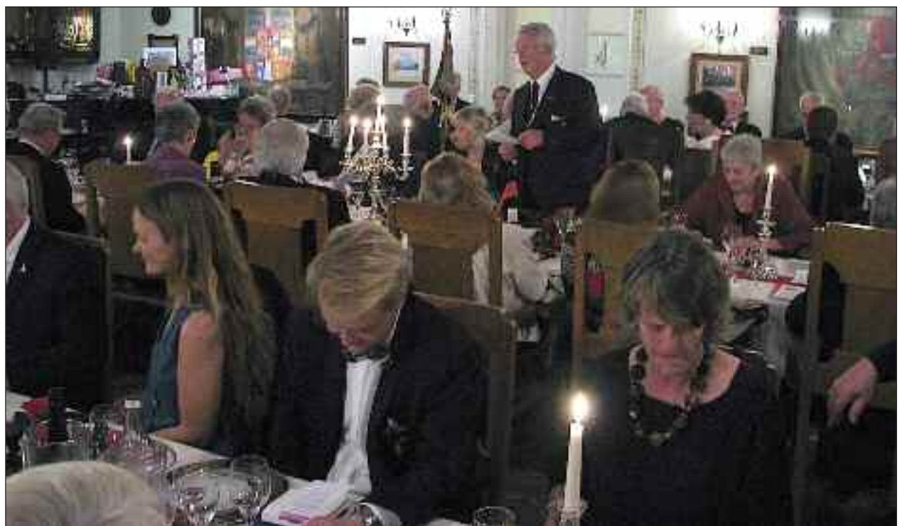
God tilslutning og fin stemning ved aftenfesten.