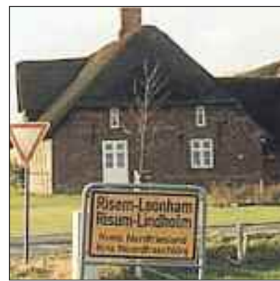
Andersen-Hüs i Klokris/ Klockries.