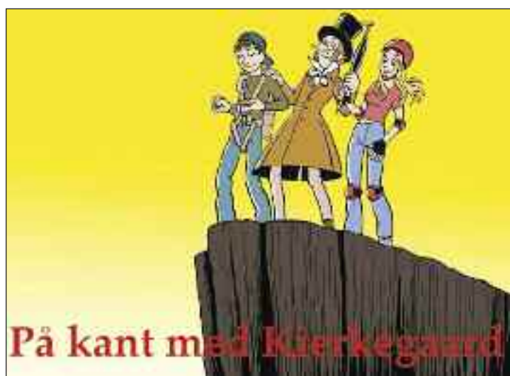
På kant med Kierkegaard

Niveaue er ramt godt for børn mellem 14 og 17.