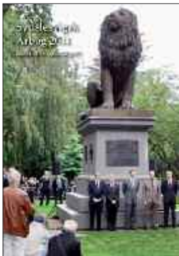
Årbogens forsidebillede er fra Istedløvens indvielse i Flensborg i september.

mindretals informationsarbejde. Den er gratis og kan bestilles på Dansk Generalsekretariat i Flensborg, tlf. 0461 14408 120 hhv. e-mail jette@syfo.de samt på alle Sydslesvigsk Forenings sekretariater i Sydslesvig. Om kort tid vil den kunne læses som download på hjemmesiden www.syfo.de