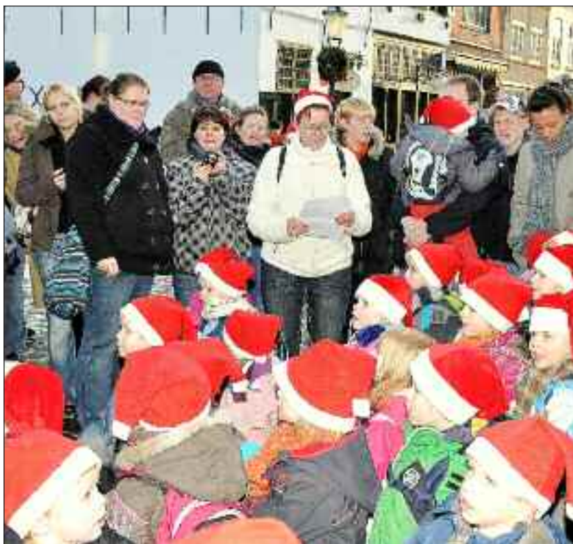
Børnene synger - som her på billedet fra sidste år - julen ind på gaden foran Paludanushuset.