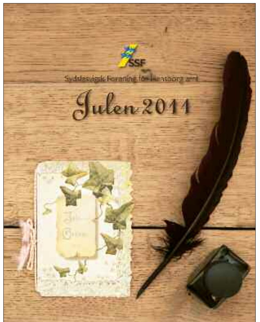
Amtets julehæfte 2011.

Amtskonsulenten tager gerne imod tekster og ideer om stort og småt, nye og gamle begivenheder, spændende steder, juletraditioner og julesysler, kreative sider, madopskrifter, et digt, fotos alt må gerne indsendes eller afleveres på Dansk Sekretariat for Flensborg amt så snart som muligt -