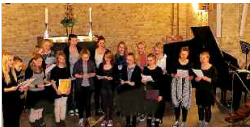
Unge sangere fra Silkeborg synger i Helligåndskirken på søndag.