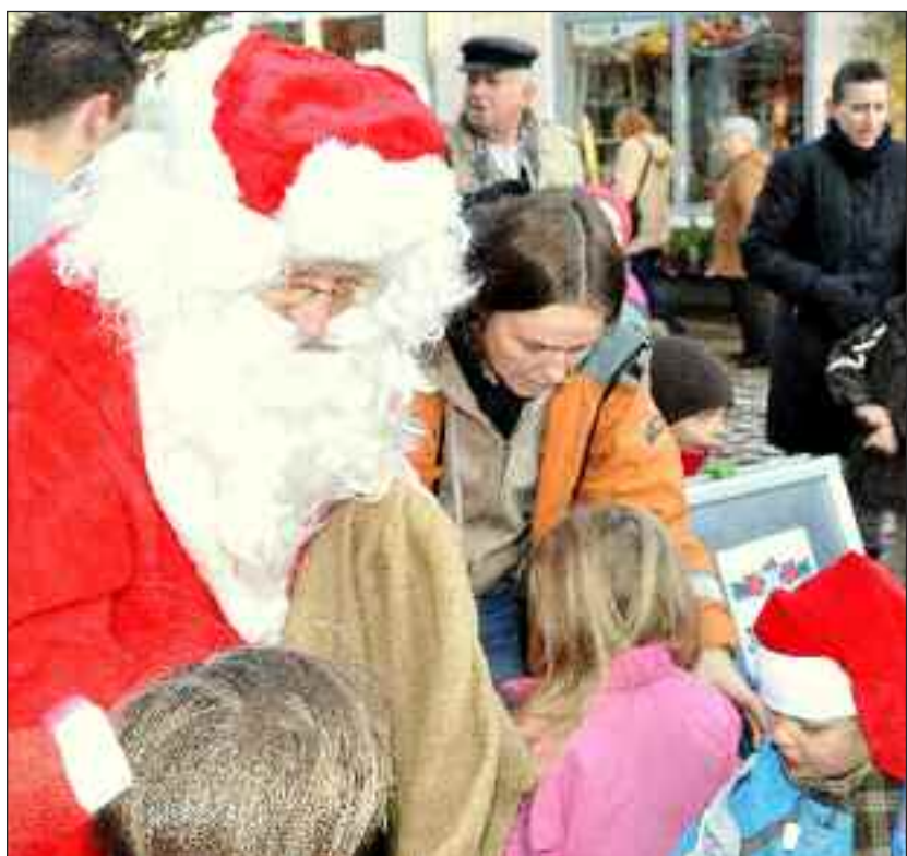
Selveste julemanden plejer at kigge ind, når mindretallet holder julebasar i Paludanushuset - som sket i 2010.