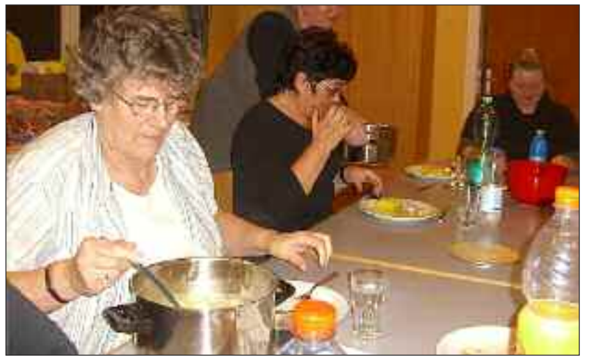
Nogle af deltagerne i kurset »klassiske danske retter«.