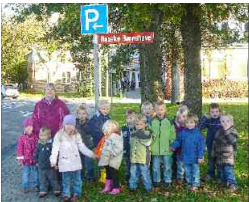
Friske børnehavebørn m.fl. og det nye skilt.