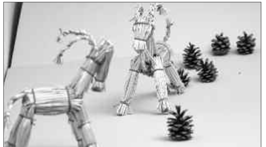
Lav dine egne julebukke.

A.h.t. forberedelse bedes om tilmelding på tlf. 0461 150 140 eller mail akti@sdu.de.