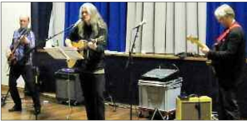
Sixballs forsagede scenen, men fik alligevel ikke helt tag i publikum.