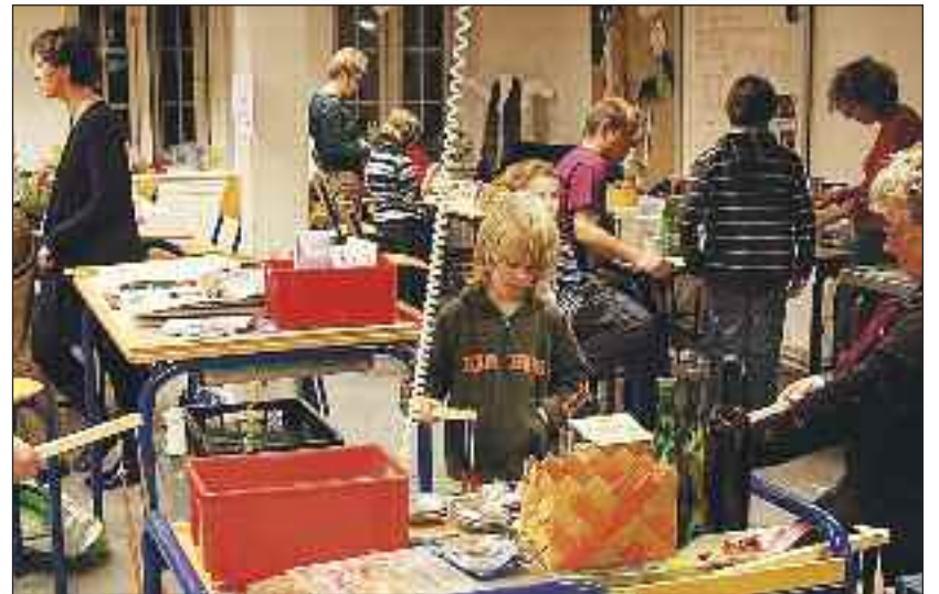
Julehygge og juleforberedelse 23. november.