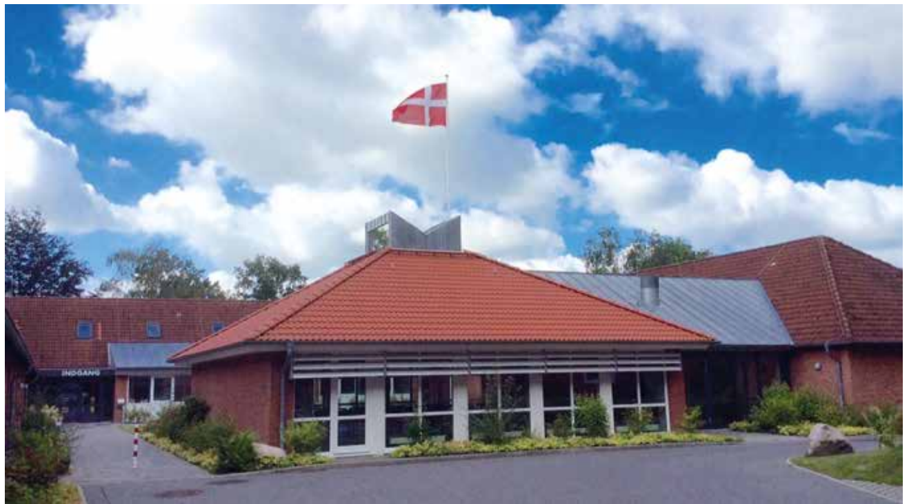
Jaruplund Højskole med tidssvarende faciliteter og åbne foredrag for interesserede.