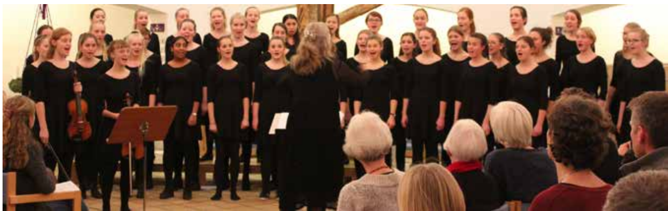
Jysk Musikkonservatoriums Pigechor synger i Flensborg Nord på søndag.