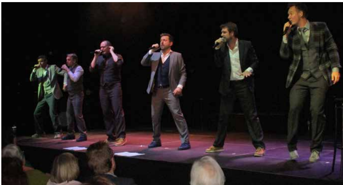
Basix på scenen i Venningsted.