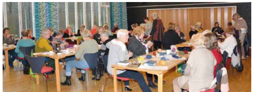
40 strikkeglade kvinder til weekendstævne på Christianslyst.