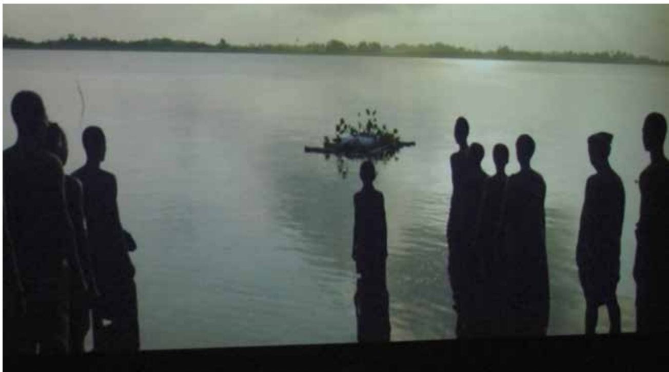
Botanikeren Wulf bukkede under for sygdom og feber. De indfødte stedte ham til hvile på en blomstersmykket tømmerflåde.