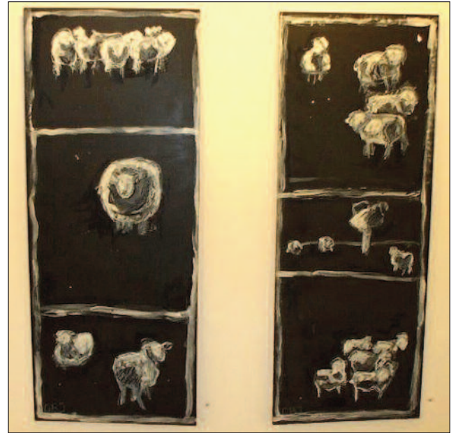
) $& $ % % #