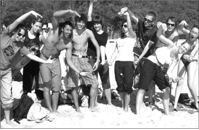
! " # $ % & ' ( ) * + , - . / : ; < = > ? @ A B C D E F G H I J K L M N O P Q R S T U V W X Y Z [ \ ] ^ _ ` { | } ~