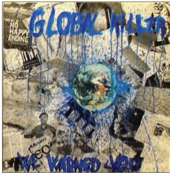
% )% $ % & #