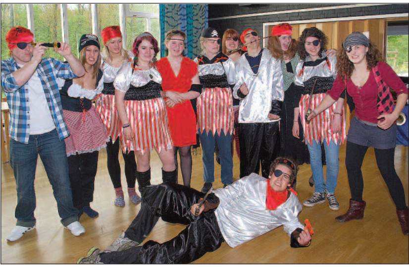
% ' & (* *#

- $#( ( . P 1993 5:7> /4 P?3A @383 @A3 :38? C7@ 2B 3? P? 5/ ; ; 3: =5 6/? :E@ A: /A /4?MC3 27<3 35<3 5?L<@3? >P ; /<53 4=?@93: :753 /9A7C7A3A3? @P @9E<2 275 /A A:; ; 3:23 275 A: ' 2 ) @ @; ; 3?:38? >P 677@/ /<@E@A ' M<23? O?/7B> 8B:7 %77@ 3B? = @M@93<23?/O/A 3B ? = (7: @9B2 A: /?AF * ; =2A/5373 7< A:; 3:27<5 @9/ : @3<23@ A: ' 2 ) #M?735/23 #=?23?@? :3<@0=?5 /:23:3@ =; 5P3<23 4=?27 A:; 3:27<5@477@A3< 353<A:75 3? B2:MO3A #P? 2B 3? O:3C3A =>A/53A >P :3873< 4P? 2B 3< O39?L4A3: @3 =5 E23?:75373 =>:E<7<53? @/ ; A 3< ?35<7<5 =<A/9A>3?@=<3? (7< <3 *757: @ A:4 &3<Q ! /<53 A:4