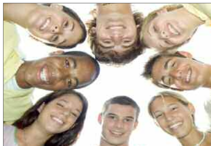
Teenagere - glade og nysgerrige, men ind imellem er der problemer - ikke mindst for/med forældrene.