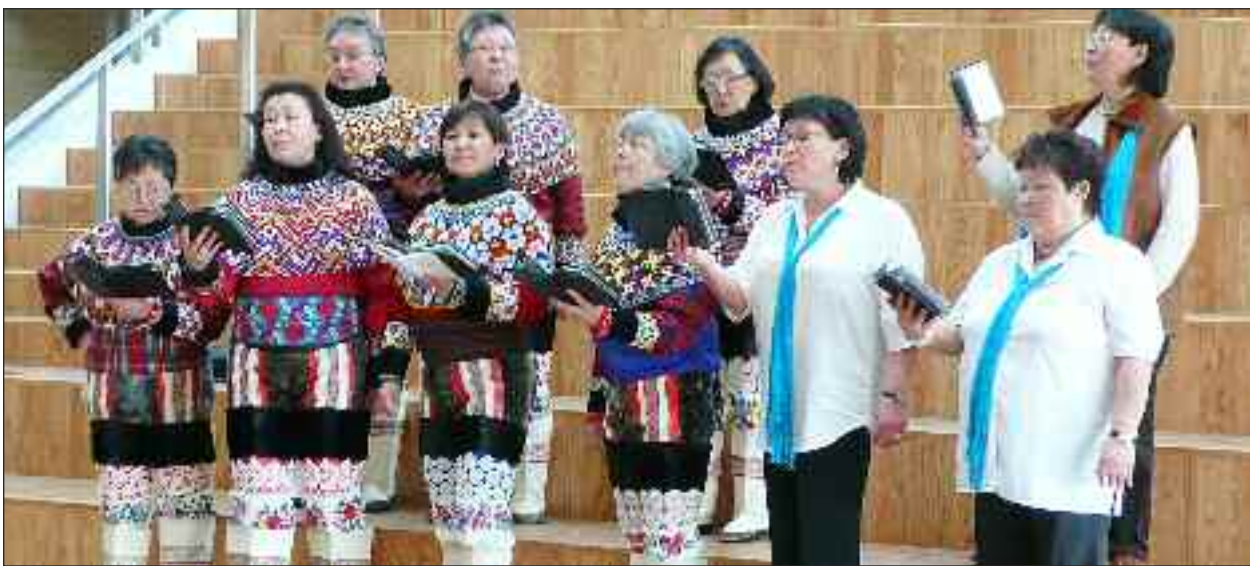
Det grønlandske kor ULO underholder.