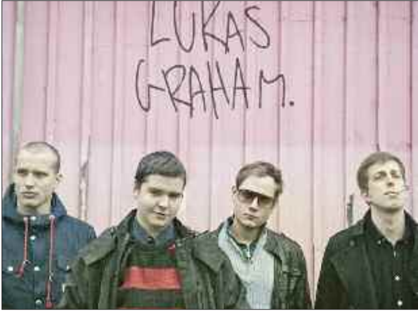
Lukas Graham &amp; Band.