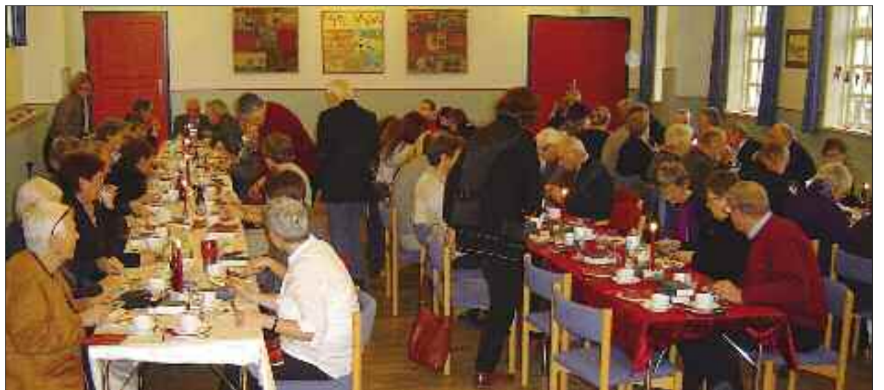
Menigheden i Valsbøl fejrede 1. søndag i advent sin 90 års fødselsdag med festgudstjeneste og frokost. Mange var mødt for at takke og mindes de fællesskaber, man havde oplevet i årenes løb. En lang række talere krydrede eftermiddagen med anekdoter og hilsener. Menigheden aflagde vidnesbyrd om sin historie i sit andet festskrift "Valsbøl danske menighed 1923-2013", som også fortæller om det nære forhold til nabosognene Medelby, Skovlund og Store Vi.