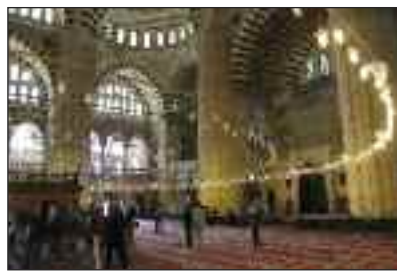
Koncilskirken i Nikæa, hvor trosbekendelsens først to artikler blev formuleret for over 1100 år siden. I oktober drog 25 personer ni dage på en rejse til Nordvesttyrki. I metropolen Istanbul oplevede de utallige seværdigheder. Turen gik også til bl.a. Bursa, Troja og Edirne. Særligt de gamle kristne kirker men også de mægtige moskeer og de antikke efterladenskaber gjorde indtryk.