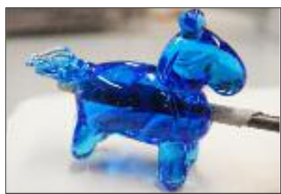
Hvad med glasperler?