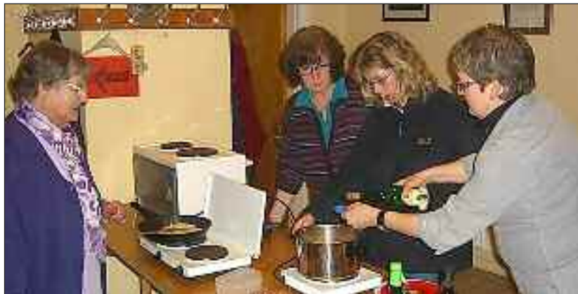
Der blev kokkereret på livet løs i forsamlingshuset.