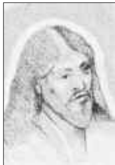
Jesus forfader, kong David.