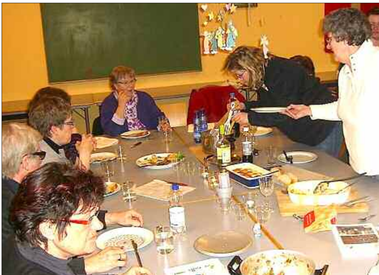
Lækker fransk mad nydes.