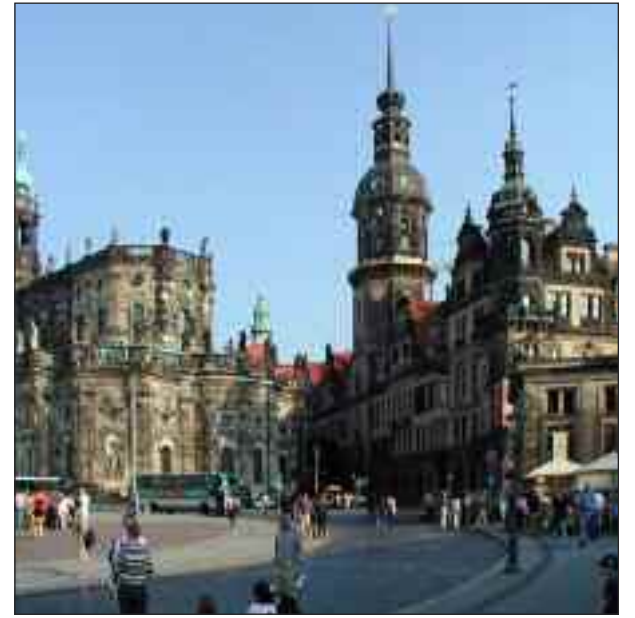
Dresden.