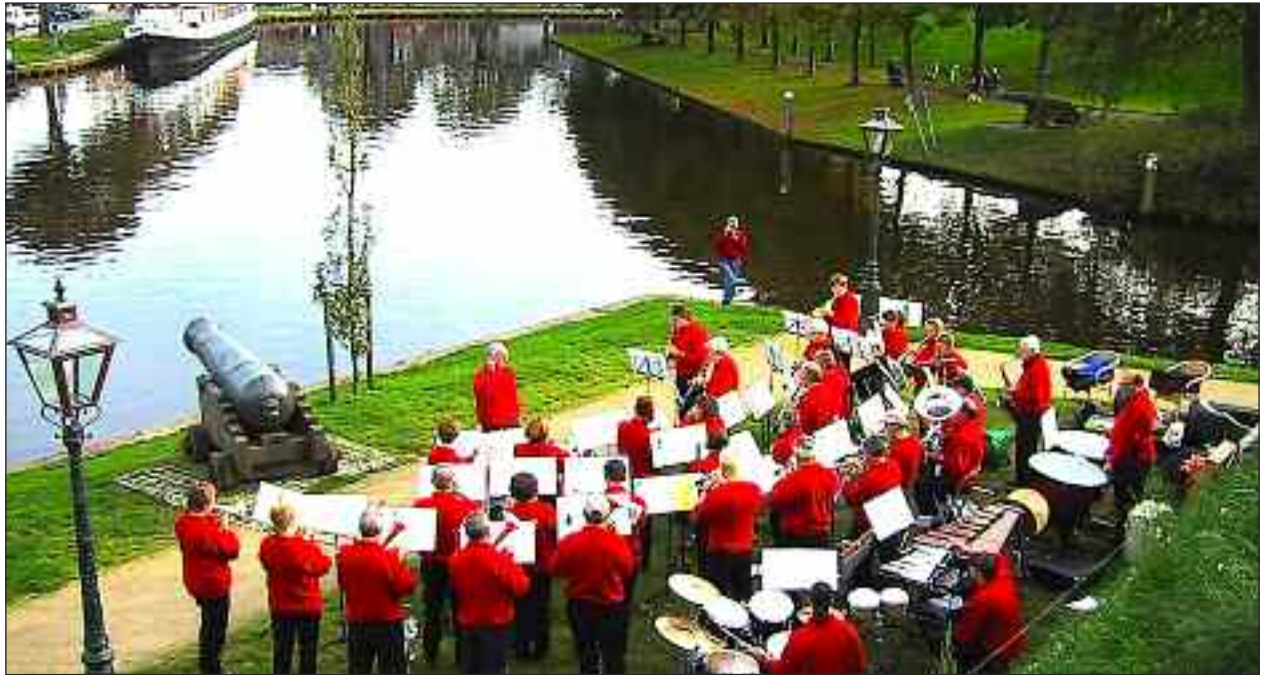
Svogerslev Harmoni Orkester. (Arkivfoto)