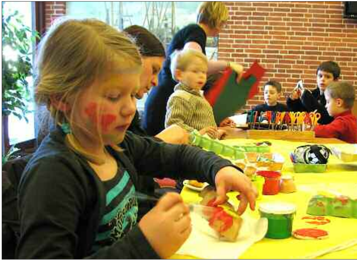
Børnene begejstede sidste år over påske-klippe-klistre-dagen.