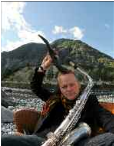
Karl Seglem.

VVK EUR 12,- (erm. EUR 8,-) / AK EUR 15,- (erm. EUR 10,-) Hörproben, Infos und Tickets: www.folkbaltica.de . Karten im Vorverkauf: Tourist-Information, sh:z-Kundencenter, Moin Moin.