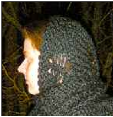
Kvinden i det tosprogede teaterstykke erkender, at man må drage ud for at kunne vende hjem. Eventyret venter derhjemme. Men nøglen ligger et andet sted.

Entreen er sat til 9 euro hhv. 65 kr. Projektet har fået tilskud fra Kulturbro/ Kulturbrücke med midler fra EUs Interreg 4a-program Syddanmark-Schleswig-K.E.R.N og Region Sønderjylland-Schleswig.