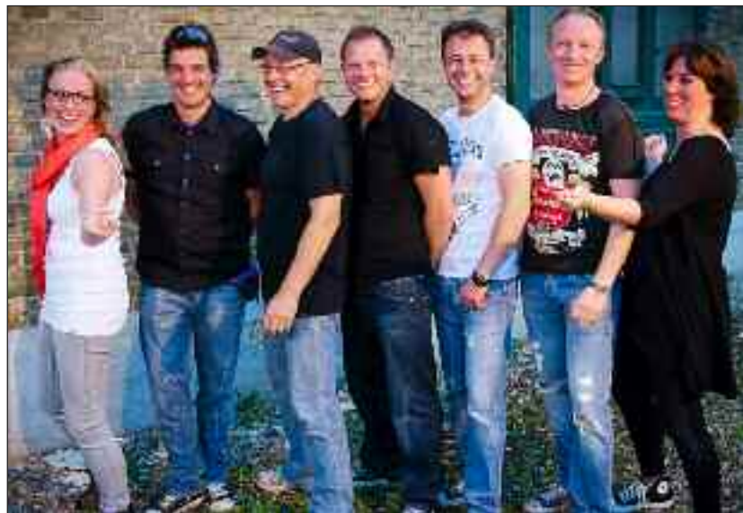
»Sang til Friheden« - lørdag kl. 20 på Flensborghus.

Billetter til 11 euro sælges via ssf-billetnet.de, Flensborghus og DCB. www.nordisk-info.de