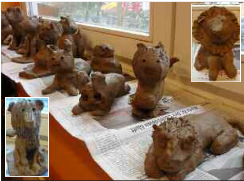
En emneuge på en dansk skole i Flensburg amt resulterede bl.a. i mange flotte løveskulpturer.