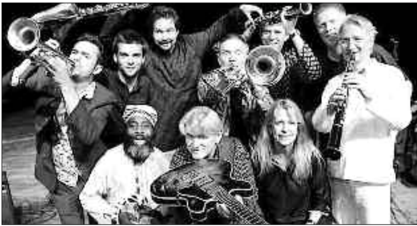
Pierre Dørge &amp; New Jungle Orchestra i Slesvig på lørdag.