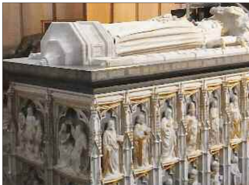
Margrete 1.s gravmæle i Roskilde domkirke.