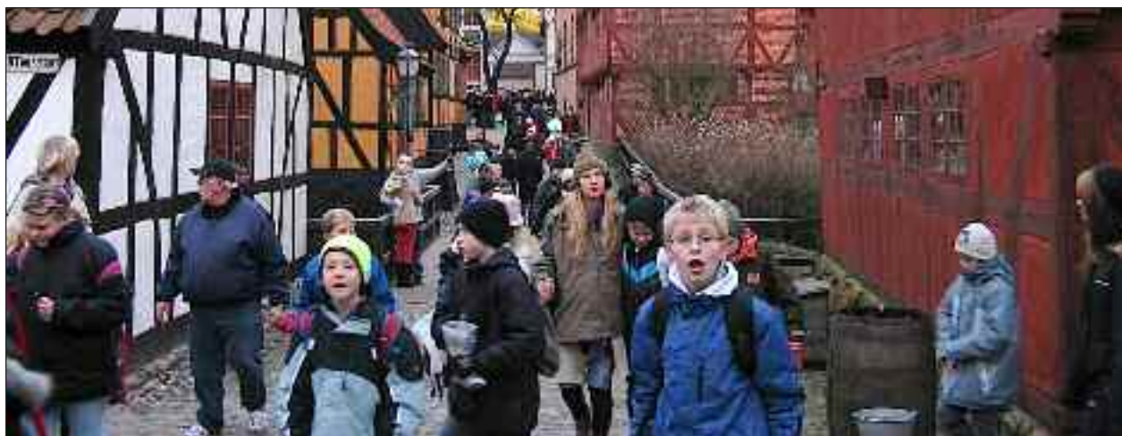
Fra juleturen til Århus og Den Gamle By i 2009.