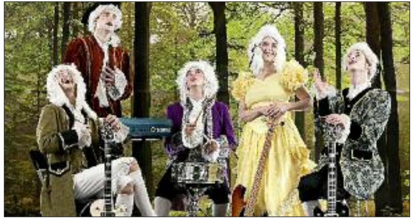
The Broken Beats (DK).