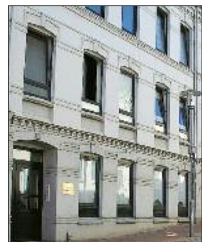
Spætteklubben i ejendommen Harreslevgade 65.