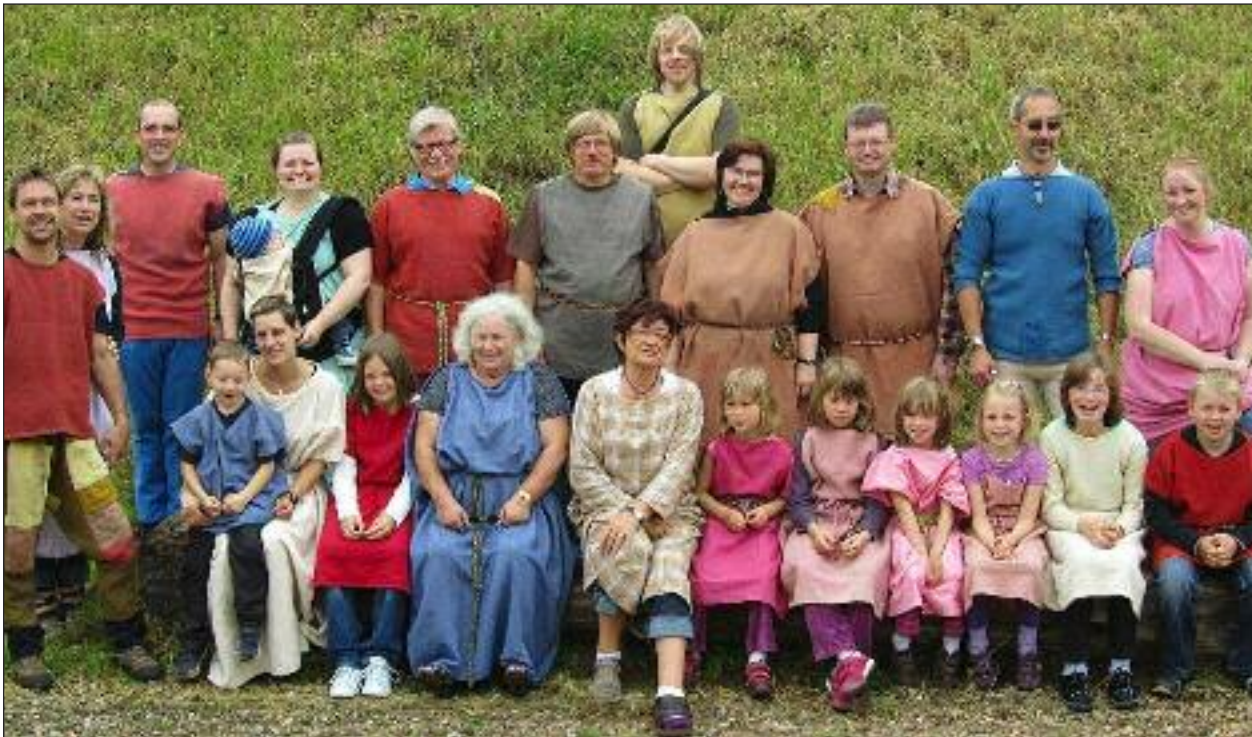
Klar til at entre oldtidsparken - iført jernalderdress.