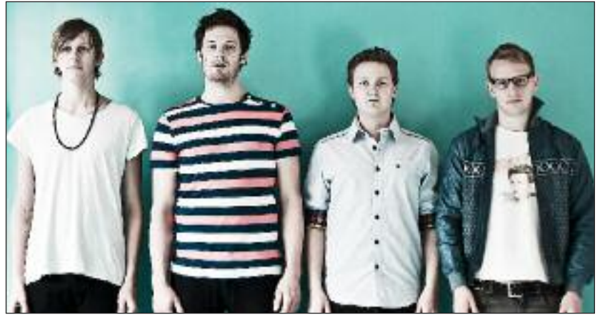
Striving Vines (DK).