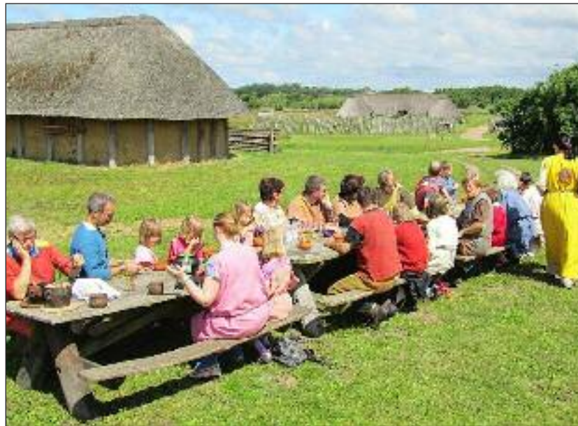
Velbekommen - selvgjort er velgjort (mad).