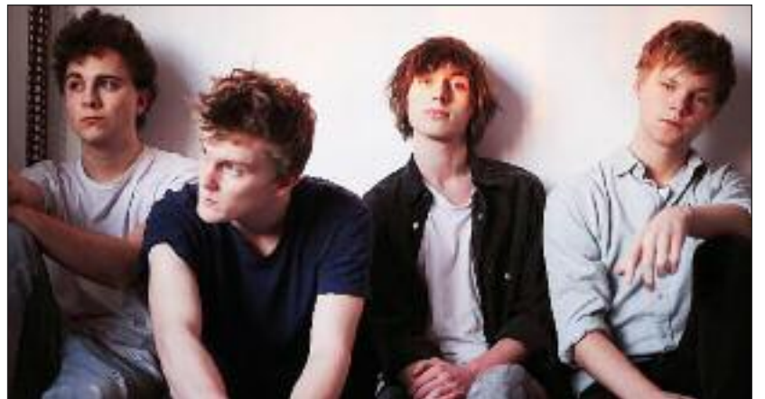
Kiss Kiss Kiss (DK).