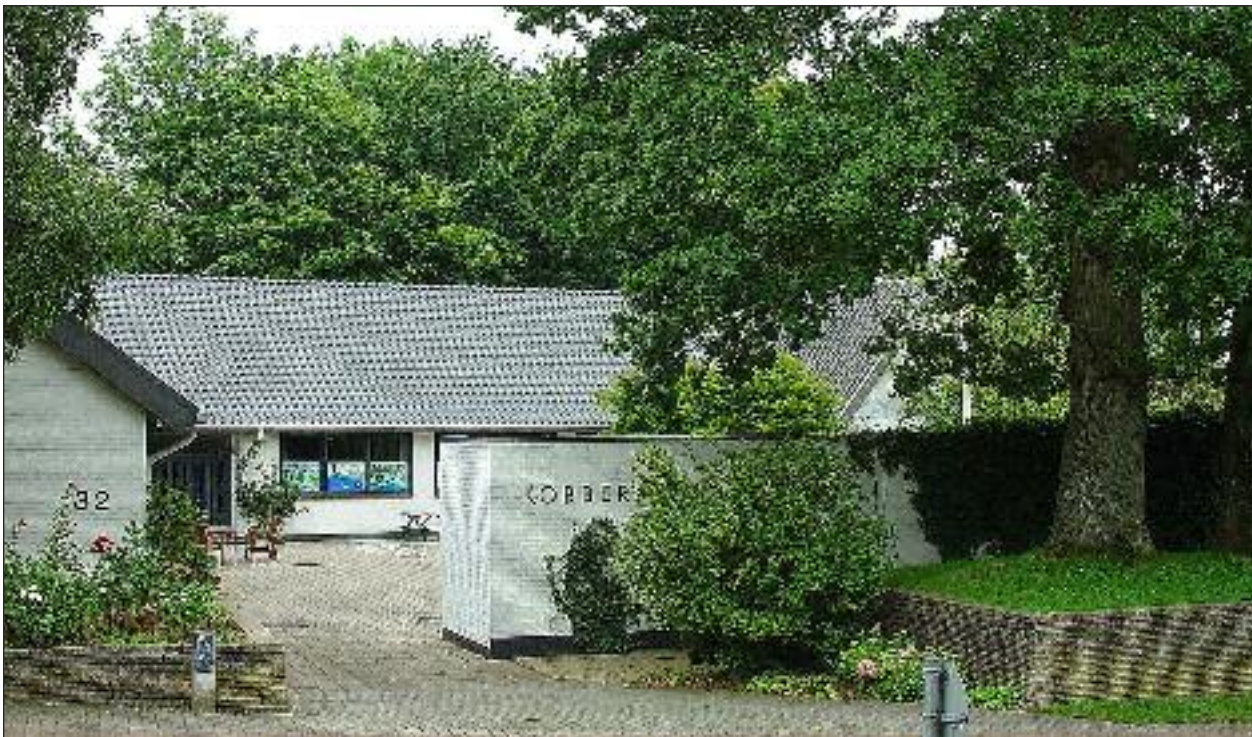
Kobbermølle Danske Skole.