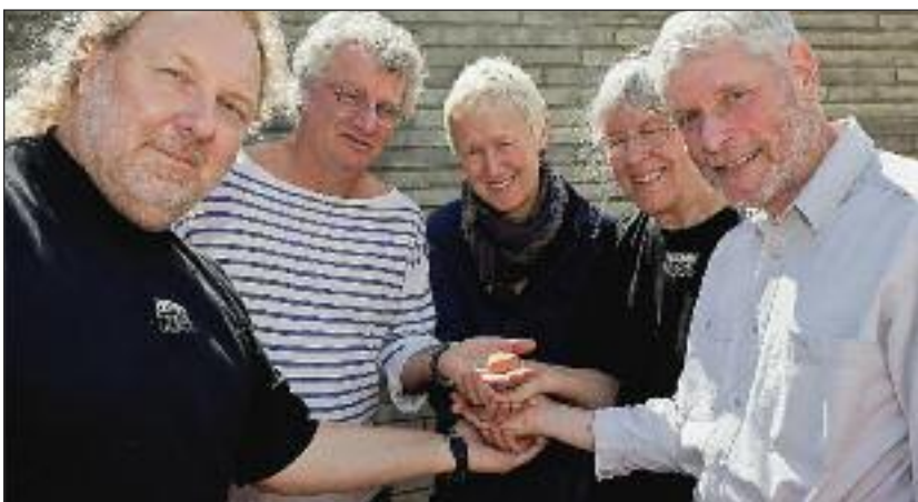
Glade kunstnere samles om et stykke tegl.