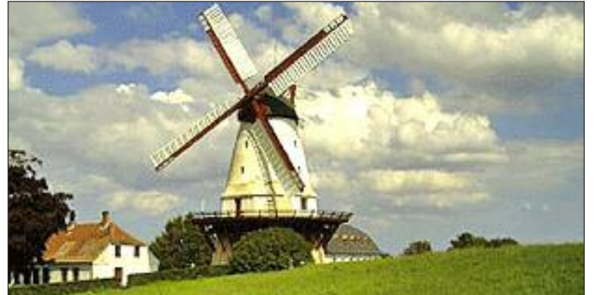
Dybbøl Mølle.

Slumstrup. Læs mere om landsindsamlingen, og hvordan du kan donere et beløb: http://www.graenseforeningen.dk/landsindsamling-til-for