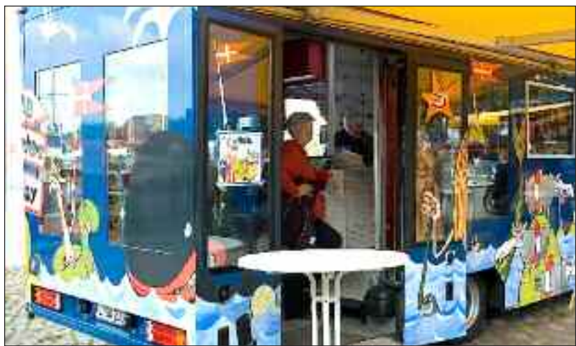
Årsmøde-bogbus med markise.