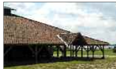
Teglværksmuseet ligger smukt med udsigt over fjorden. Og lige op og ned ad Gendarmstien.

[KONTAKT] Kristi Himmelfartsdag den 2. juni inviterer SSF-distrikt Husum og Omegn sine medlemmer på en tur langs Gendarmstien med efterfølgende besøg i Cathrinesminde Teglværk. Gendarmstien går langs nordsiden af Flensborg Fjord – hele vejen fra Kruså til Hørup Hav på Als. Efter grænsedragningen ved folkeafstemningen i 1920 gik gendarmen langs fjordens nordside og patruljerede dag og nat. Deraf stiens navn. Bevogtningen af den søværts grænse hørte op for år tilbage, men stien er mærket op og kortlagt, så man dels kan nyde den flotte udsigt over fjorden, dels kan mærke det historiske sus det er, at gå langs den. Ikke mindst fordi den også passerer såvel Dybbøl-skanserne, de preussiske kanonstillinger på Broagerland som