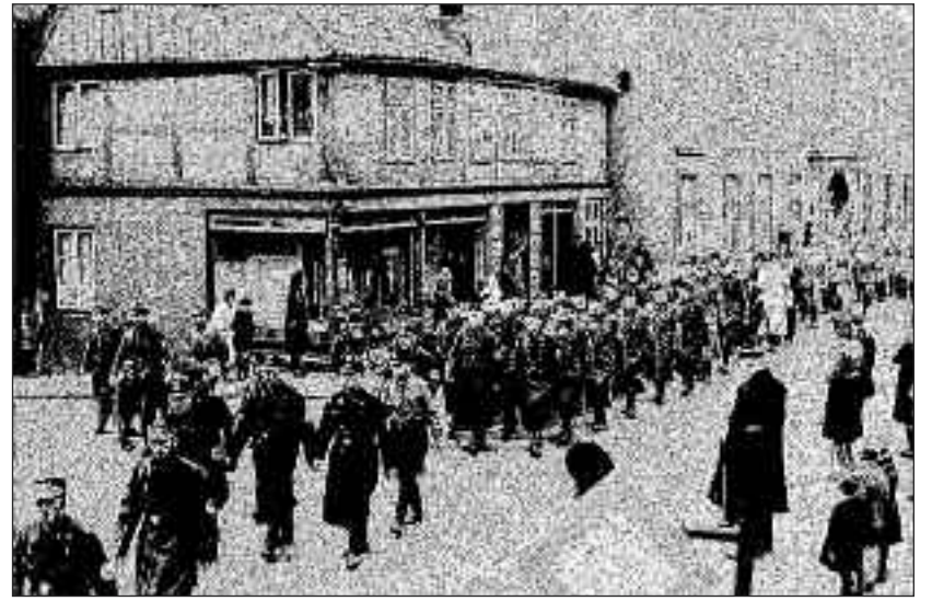
"Kanonenfutter" nannte man in bitteren Zeiten Menschen, die in aussichtsloser Lage noch in den Krieg geschickt wurden. Hier 1943 in Schleswig alte und behinderte Mitbürger und blutjunge Arbeitsdienstler, angeführt von uniformtrotzenden Schleswiger Nazigrößen und Offizieren auf dem Weg zu einer Massenveranstaltung auf dem Jahnplatz. Die Älteren wurden zum "Volkssturm" gezwungen, um Schutzwälle zu graben. Die Jungen wurden mit phrasenreichen Einpeitschungen an dieFront beordert.