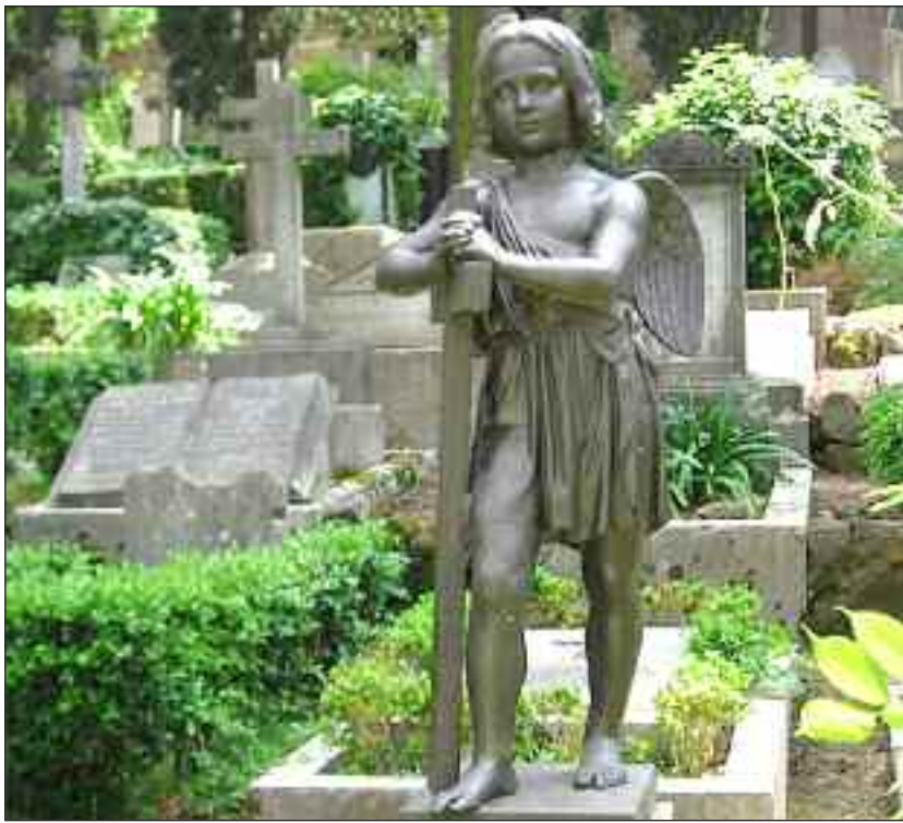
Jerichau-gravstedet på Den Protestantiske Kirkegård i Rom.

Kærlighed og stædighed samt hjælp fra familien gjorde, at det unge par dog fik J.A. Jerichaus velsignelse, og de giftede sig i Konstantinopel den 20. marts 1875. Lykken var dog kort, for først døde deres tre et halvt måned gamle dreng, og allerede i no-