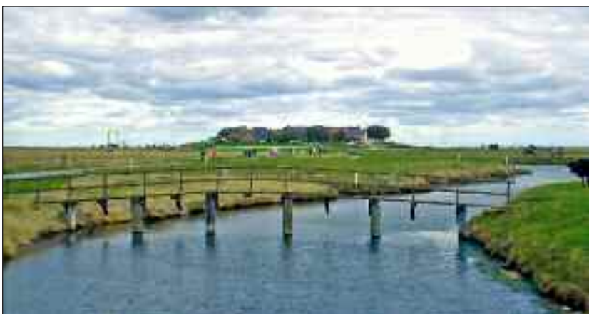
Vom Titel: Hooge.

Beiträge des friesischen Schreibwettbewerbs „Ferteel iinjen!“ und aktuelle Berichte runden Nordfriesland 173 ab. Das Heft umfasst 32 Seiten, kostet 3 Euro und ist erhältlich über den Buchhandel und beim Nordfriisk Instituut in Bredstedt.