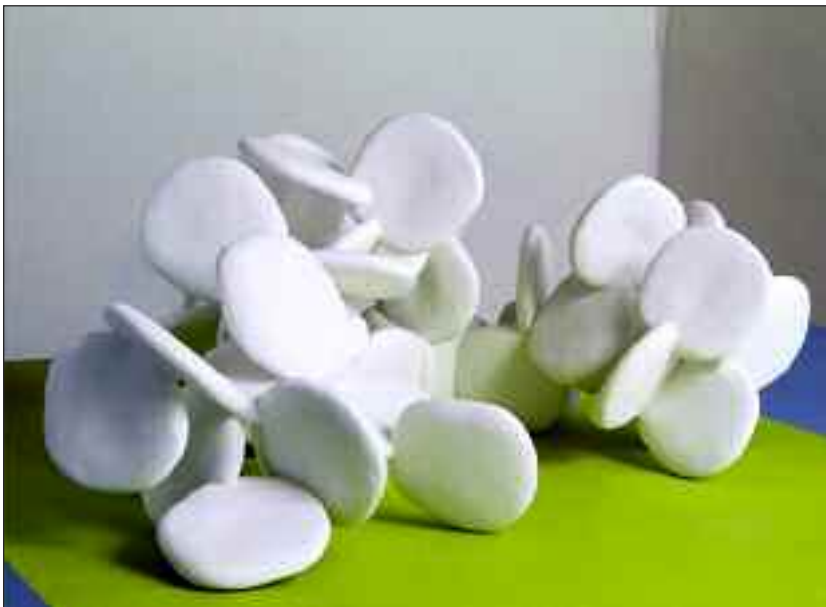
Bladskulptur af Signe Højmark.