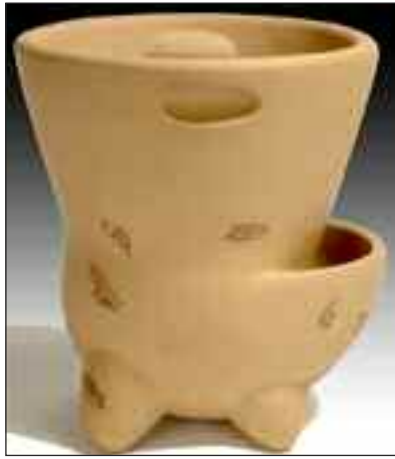
Blomsterkumme af Helle Rittig.