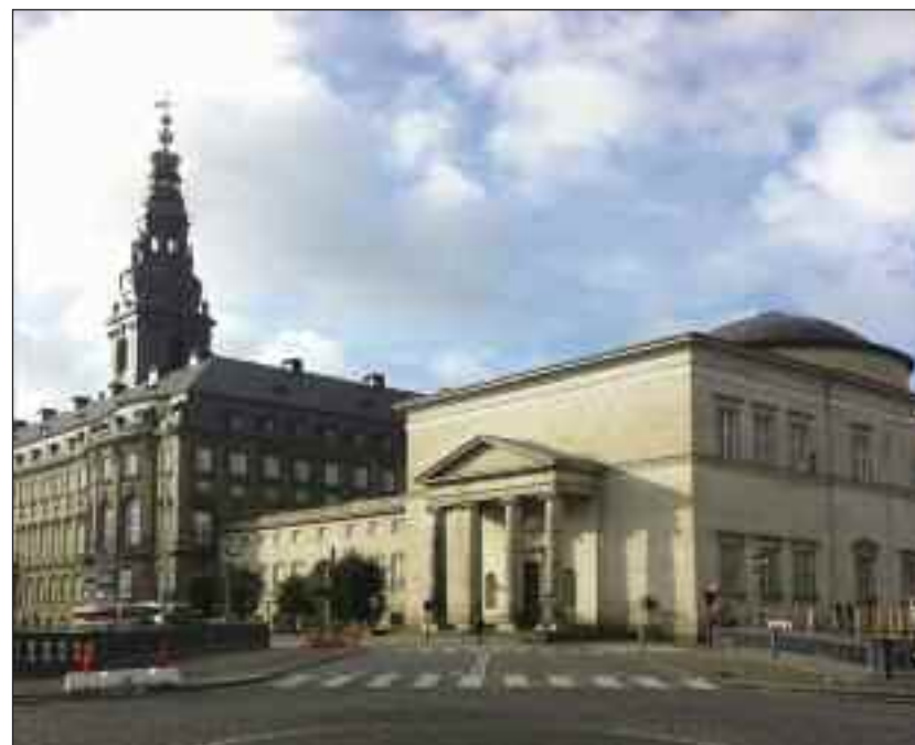
Christiansborg Slot og Christiansborg Slotskirke.

Om det nu alt sammen befordres i de aktuelle danske bestræbelser for at