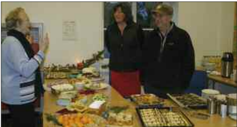
Kaffebordet med et stort udvalg af hjemmebagt.