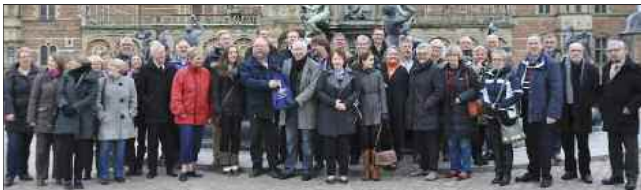
Gæster og værter foran Frederiksborg Slot.