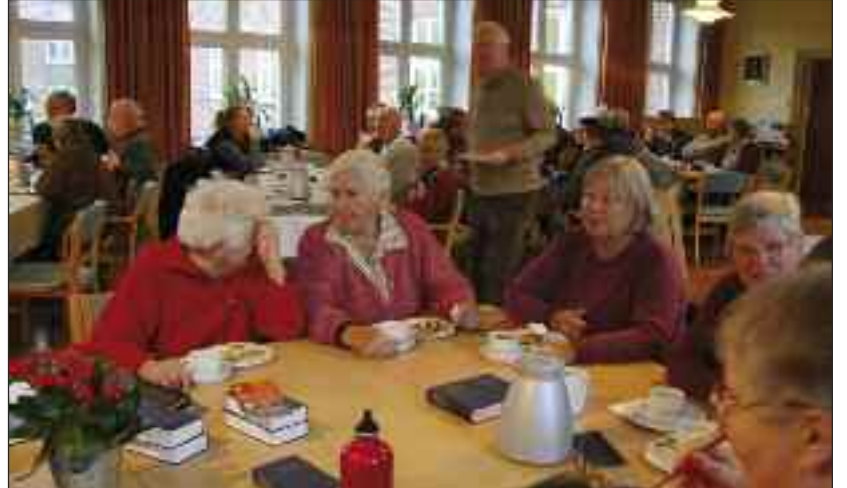
Fuldt hus.