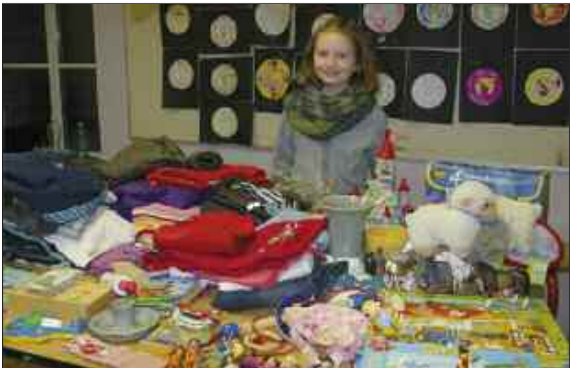
En flittig sælger på børneloppemarkedet.