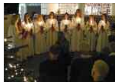
Duborg-Skolens lypiger synger.