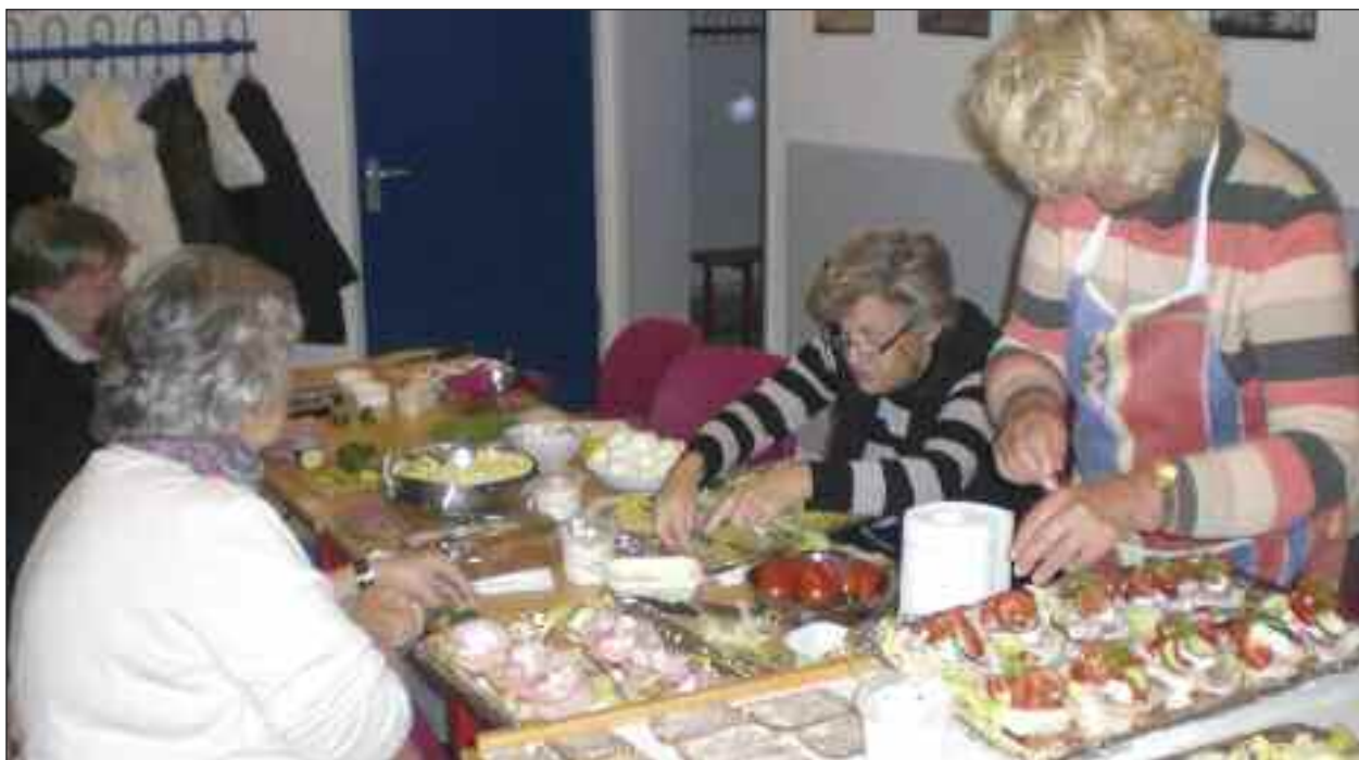
Aktive medlemmer af ældrecaféen forbereder smørrebrødsaftenen.