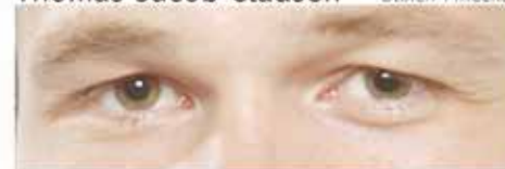
Bror von Blixen-Finecke