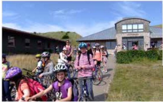
Den nye brochure.

Både mod nord og mod syd er der cykelsti igennem klitterne. Lejrskolen kan rumme ca. 50 børn og 9 voksne.