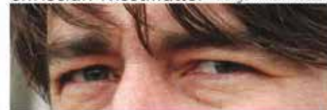
Denys Finch Hatton