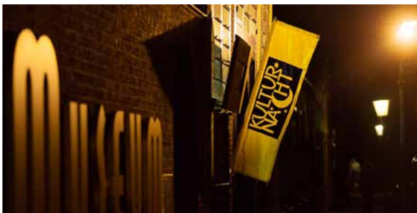
Fahne am Museum.

Das vollständige Programm und weitere Informationen gibt es unter www.kulturnacht.sh .