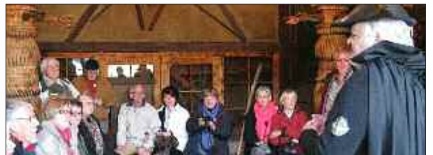
Den Sorte Møller i Krabat-møllen i Schwarzcollm fortæller om sorber-sagnet om 14-årige forældreløse Krabat, der sammen med 11 andre forældreløse drenge bliver mølledreng hos mølleren, der har sluttet en pagt med døden.