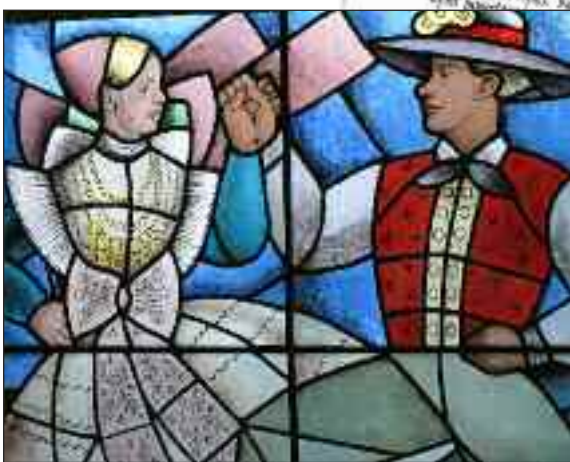
Endnu et vinduesbillede: Sorberne går meget op i folkedragter, -musik og folkedans.