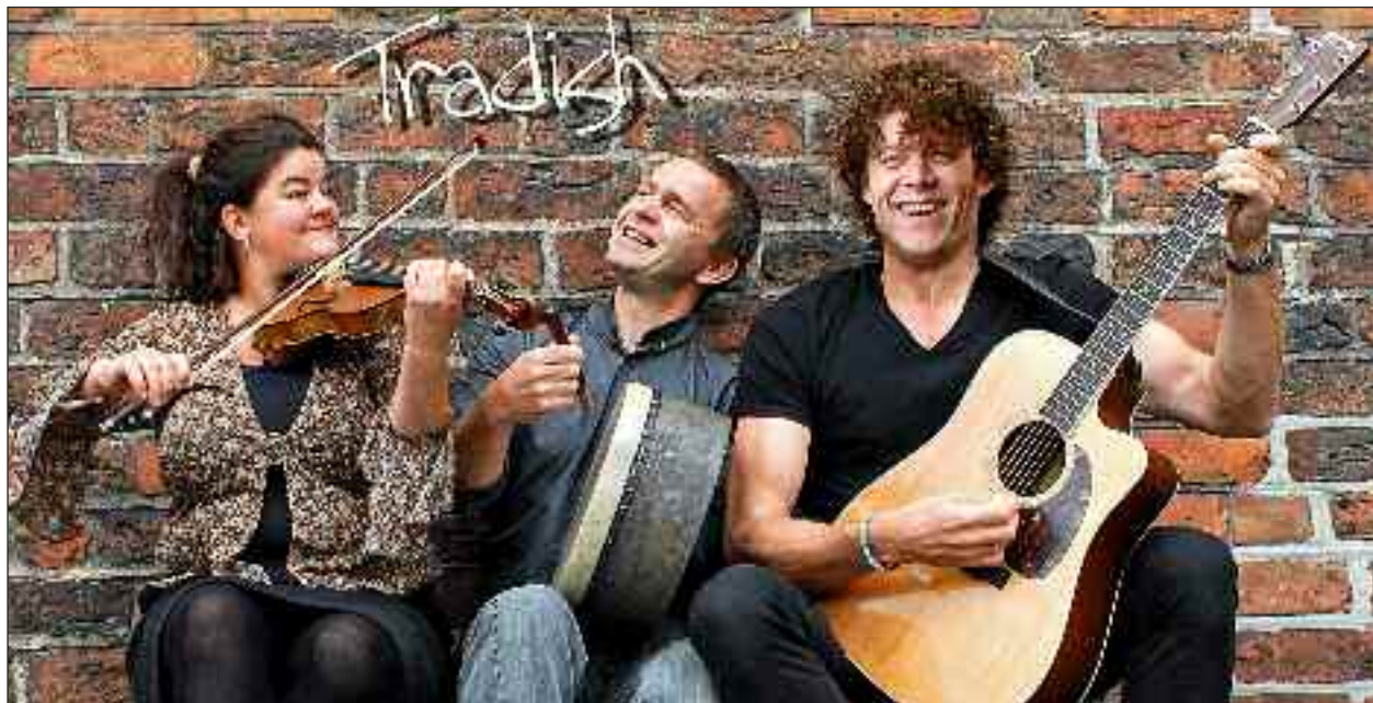
Tradish i Nybjernt og Hanved 12. hhv. 13. november.