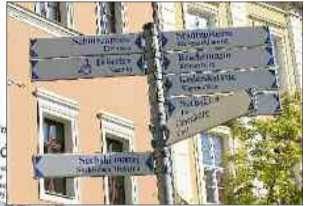
Tosproget skiltning, både offentlig men også privat f. eks. hos bageren.