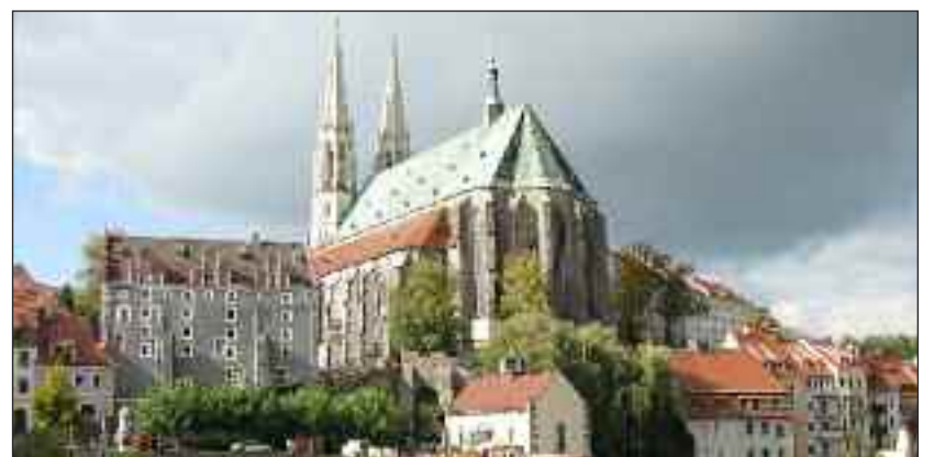
Bykirken St. Peter und Paul i Görlitz med sit specielle »solorgel«, bygget sammen med de omkringliggende huse.