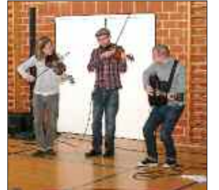
Treja Danske Skole vandt alle tiders skolekoncert med veloplagte Trio THG på Spil Dansk Dagen sidste uge torsdag.

Så spiller vi bare lidt højere," lød det fra musikerne. Og den opfordring var der mange, der fulgte. Ekstranummer og autografer blev det også til; alt i alt en dejlig koncert, som gjorde Spil Dansk Dagen til en rigtig god oplevelse på Treja Danske Skole. Jane Mölck