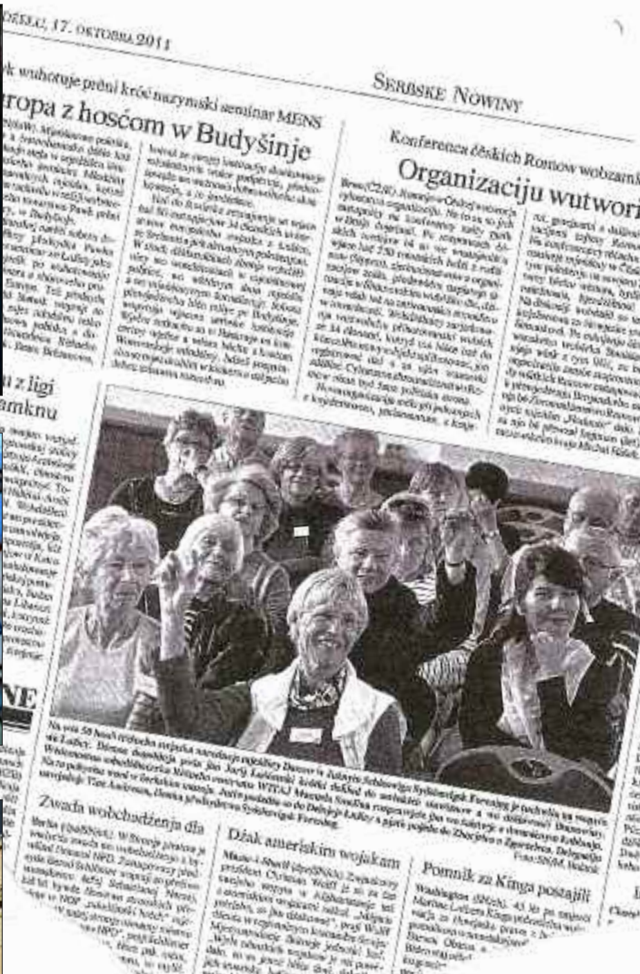
Serbske Nowiny, sorbernes avis, skrev om besøget.