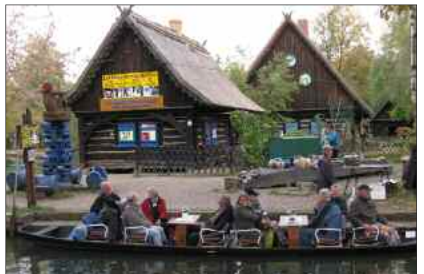
Det sorbiske frilandsmuseum i Lehde.