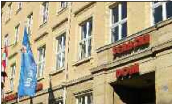
Kultur- og administrationscentret Serbski Dom, sorbernes »Flensborghus«.