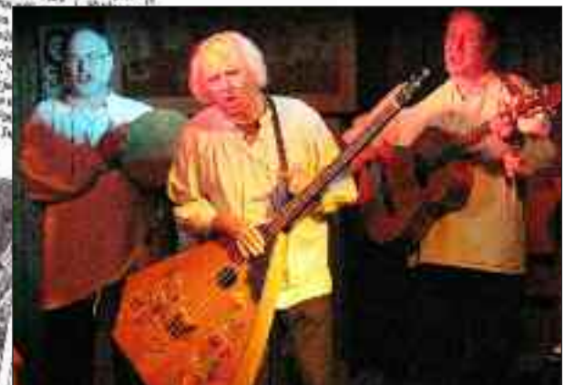
Sorbisk underholdning i Brunos knejpe.