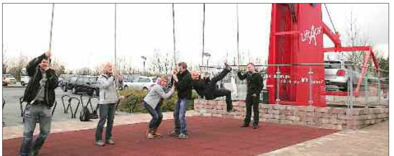
På Danfoss Universe kan man udfordre tyngdekraften.