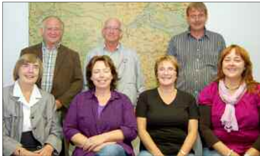
Amtsstyrelsen efterlyser kandidater.