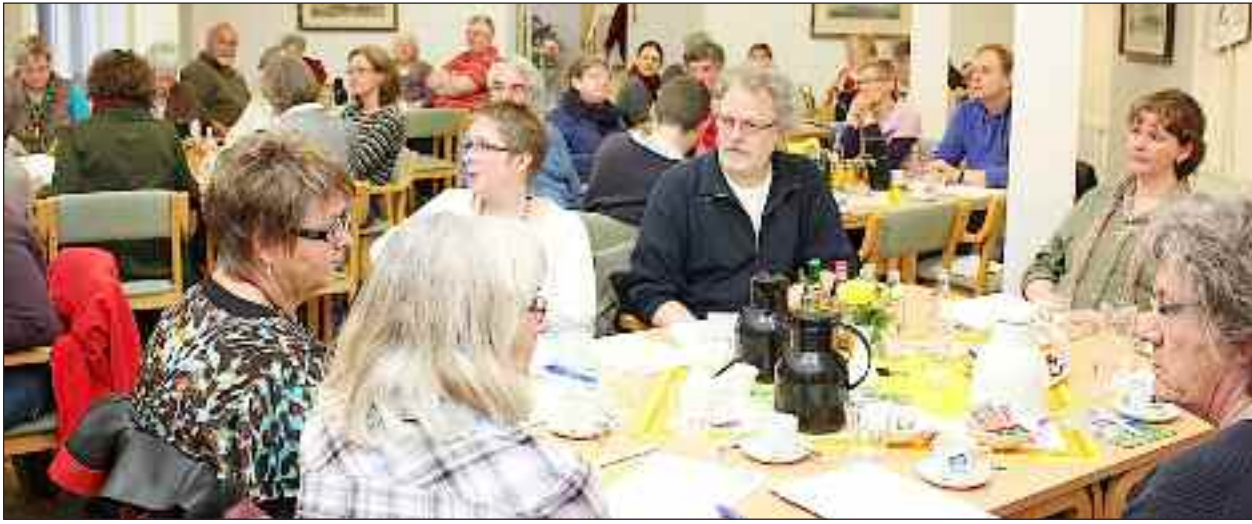
Fra en tidligere amtsgeneralforsamling på Flensborghus.