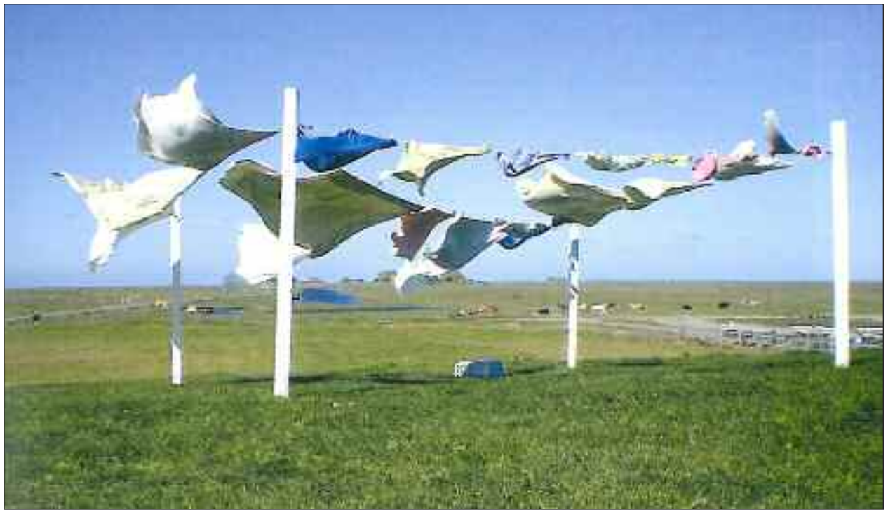
Flatternde Wäsche auf Hallig Hooge – Wind und Weite sind Begriffe, die viele Menschen mit der Heimat Nordfriesland verbinden.