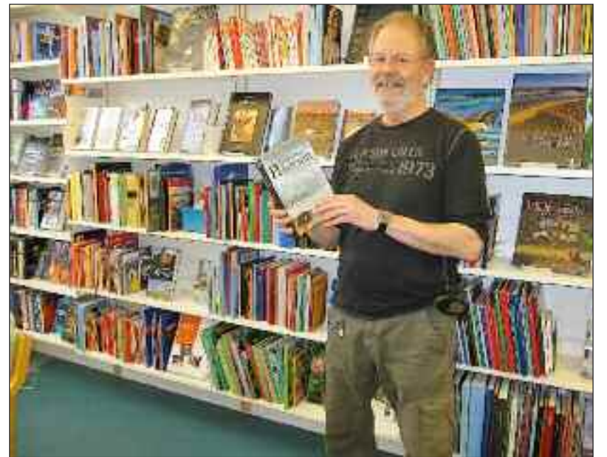
[KONTAKT] Forår på det danske bibliotek i Slesvig, udførligt omtalt i sidste uges KONTAKT. Talrige nye bøger er lige udkommet, nogle af dem løbende omtalt i Flensborg Avis. Aktuelle tids-

bibliotek. Man mødes onsdag den 17. april kl. 15.30 på Flensborg Bibliotek, Nørregade/ Norderstr. 59, hvor man taler om bogens temaer og bagefter ser filmen. Fri entré.