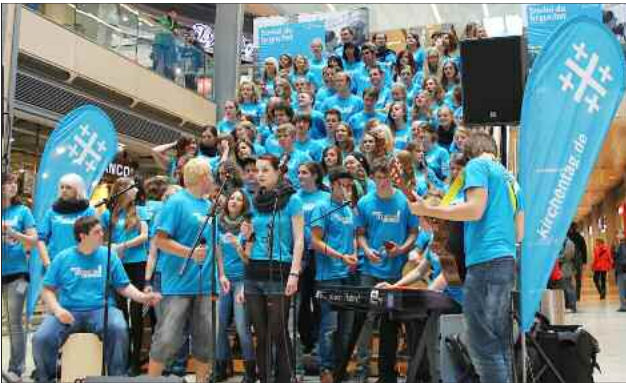
Ten Sings Hessenprojekt i Hamborg med 110 unge gjorde allerede i sommeren 2012 folk opmærksomme på den nu umiddelbart forestående "Kirchentag" 2013.