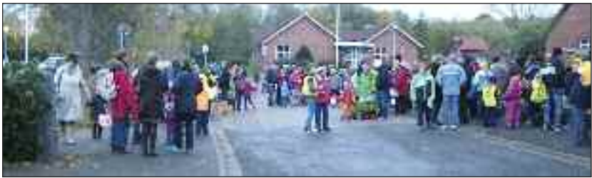
Deltagerne samles til lanterneoptoget.