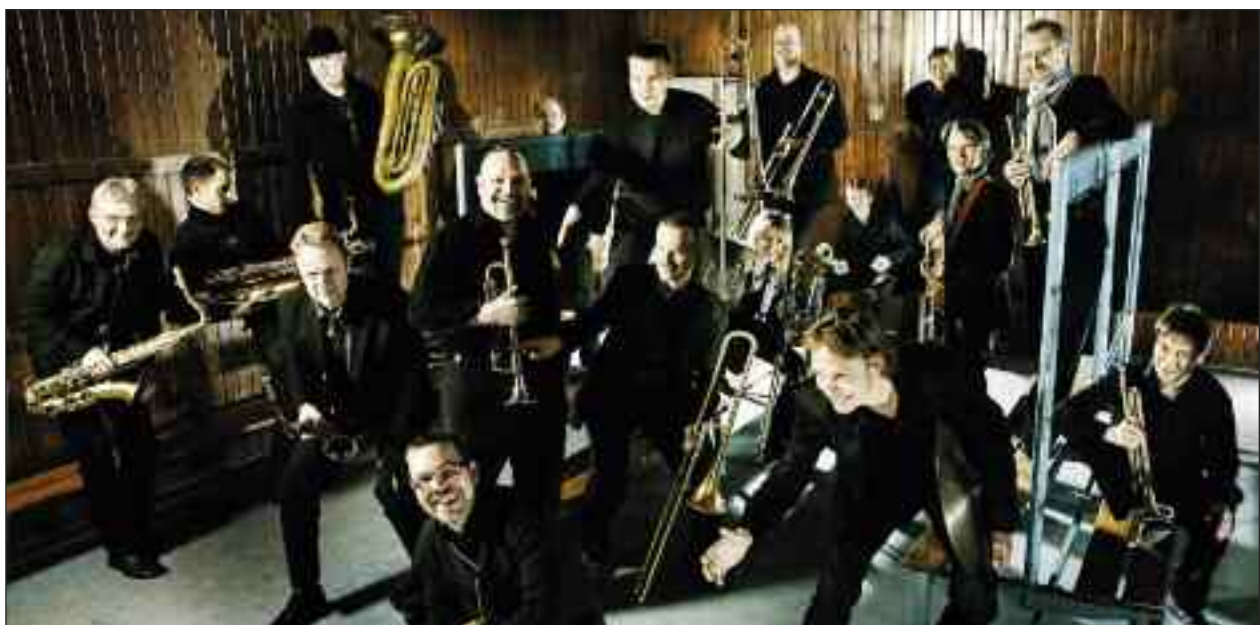
DR Big Bandet 19. november i Slesvig.