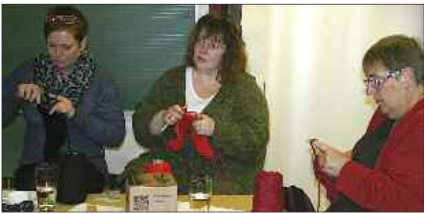
Nogle af deltagerne