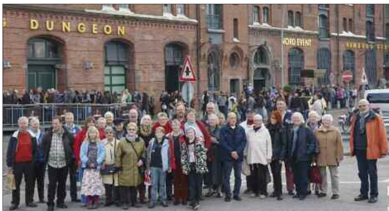
Ikke alle deltagerne er med på billedet, idet modeljernbanekomplekset ligger i en af havnens gamle lagerbygninger i "Speicherstadt", hvor der også er interessante ting at gå til i nærheden.