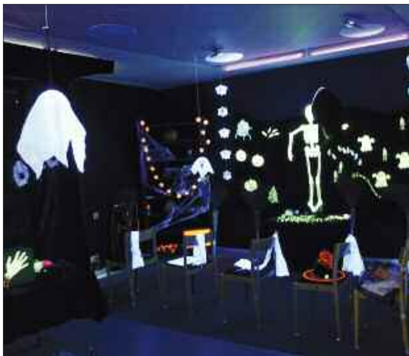
Halloween på børnebiblioteket på lørdag.