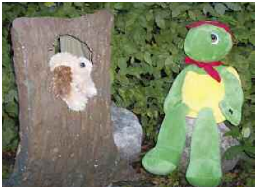
Morten prøver at få hjælp af sin ven hunden.