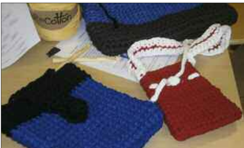
Flot og nemt at lave.