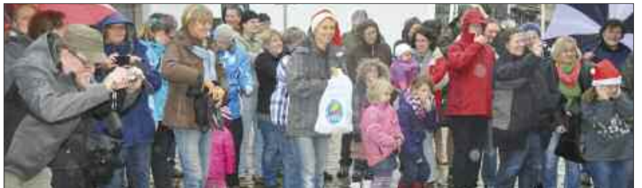
Glade forældre og søskende.

De mange nissebørn gjorde det at synge bare bedre. Man har kunnet øve sammen længe og sammen kunnet glæde sig til deres optræden og julemandens komme.