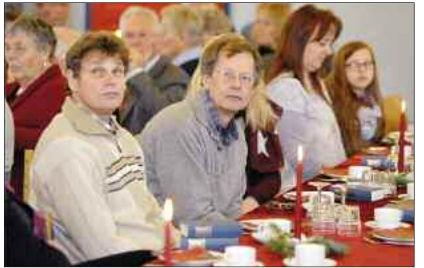
Der lyttes til festtalerne.