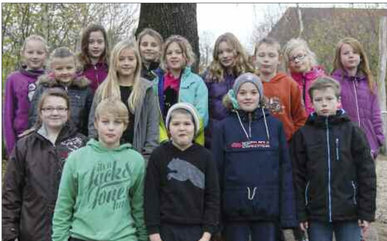
Næsten alle elever fra den julemærke-kreative 4-5. klasse på Skovlund-Valsbøl Danske Skole.