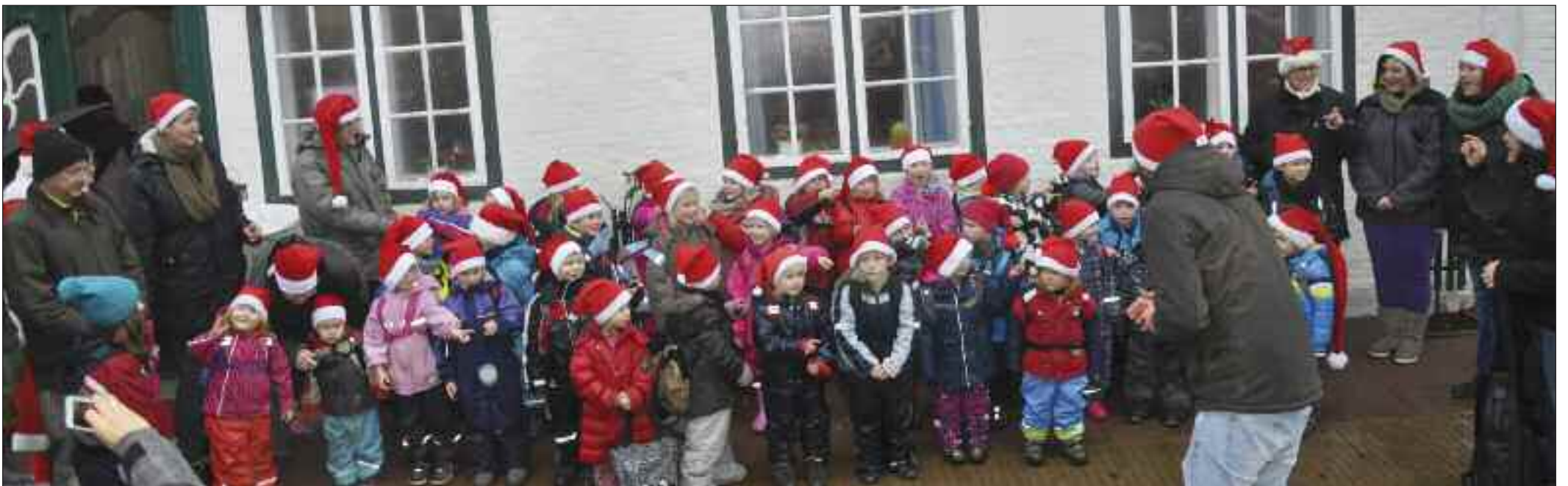
Pragtfulde og sangglade nissebørn.