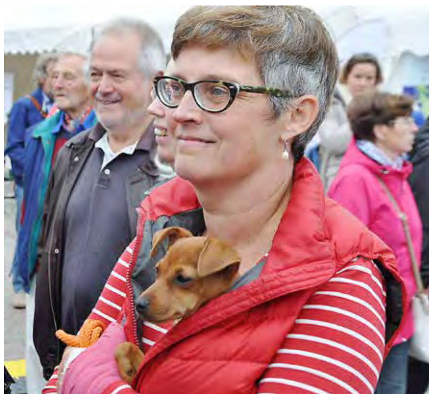
En hund efter informationer...