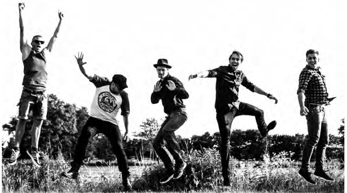
De Sidste Bohemer fra Aarhus giver koncert på Slesvighus i morgen, fredag.