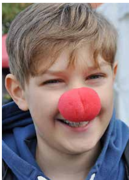
Også de unge havde det sjovt