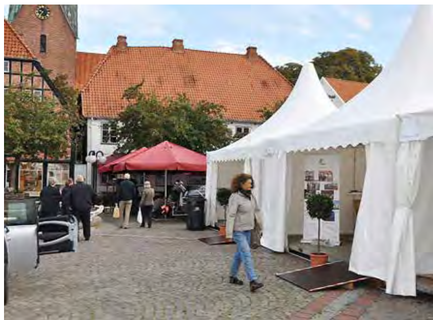
De såkaldte pagodetelte, SSFs og de andre mindretals stod centralt placeret på torvet/ Markt i Eutins midtby.