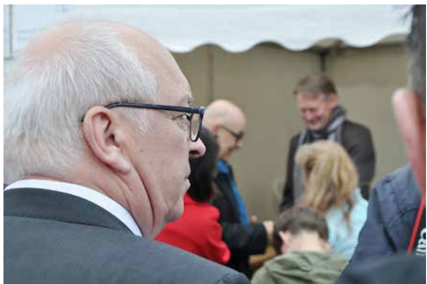
Et lidt skeptisk blik ind imellem...