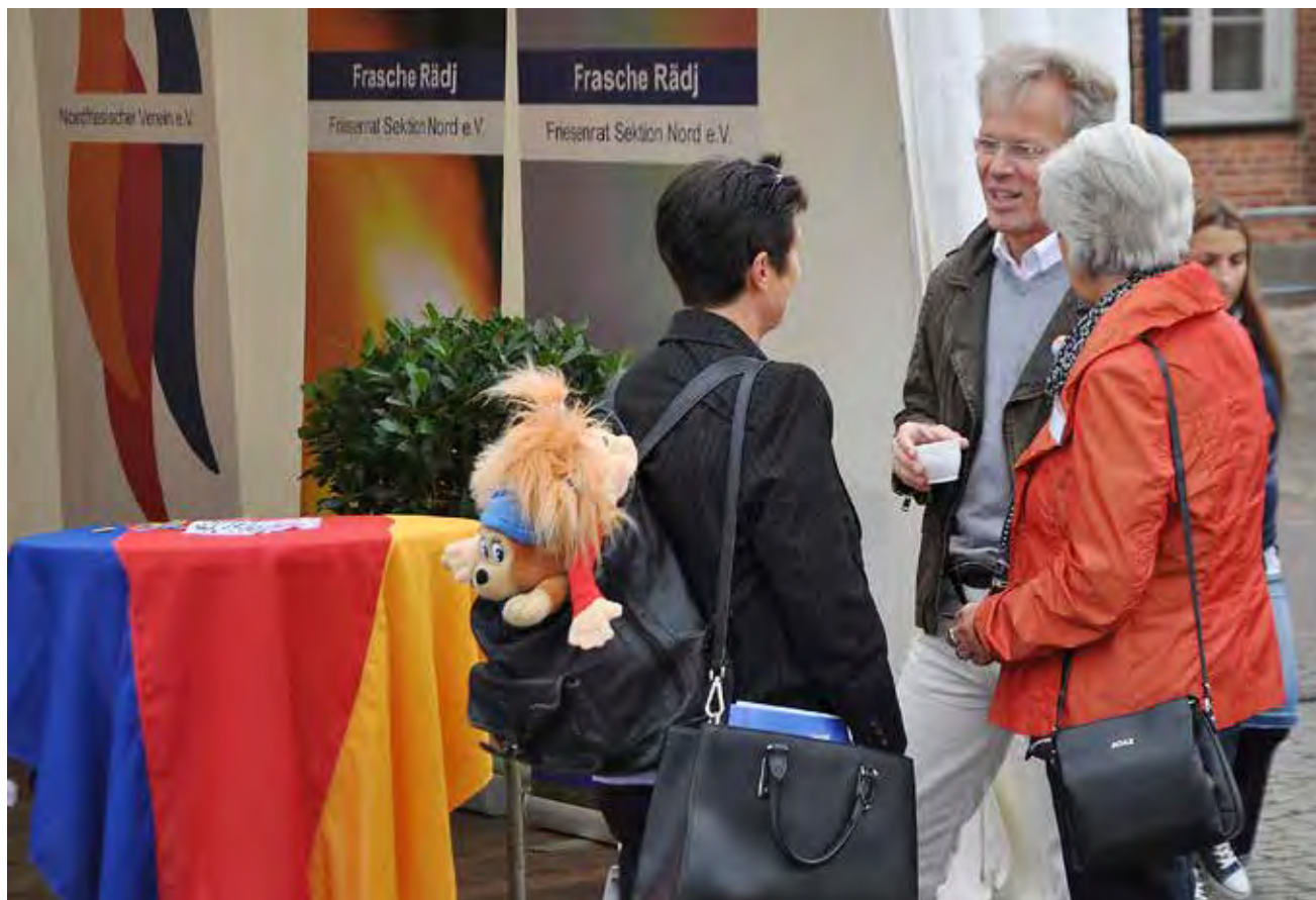
Smalltalk dagene igennem også hos frisjerne.