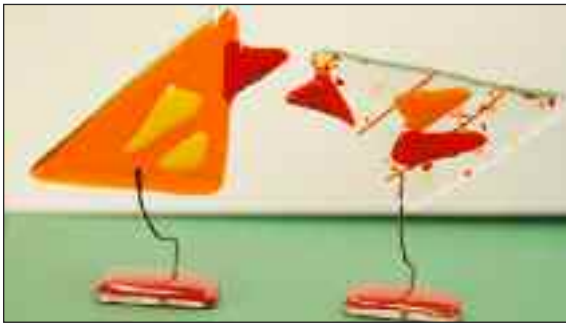
Påskepynt af glas - her nogle høns.

Tirsdag 12. marts kl. 17-19. Pris: Materiale efter forbrug; ingen tilmelding.