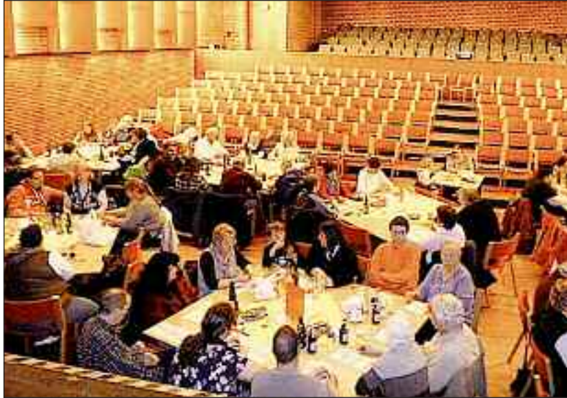
Når der er lotto på Husumhus, kommer mindretallets egne.