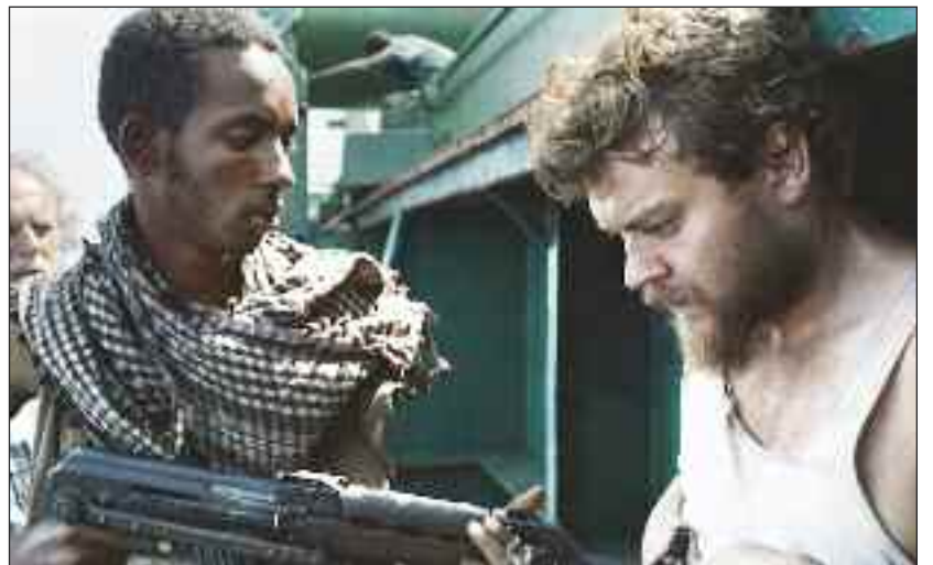
Pirater overfalder fragtskibet MV Rozen.