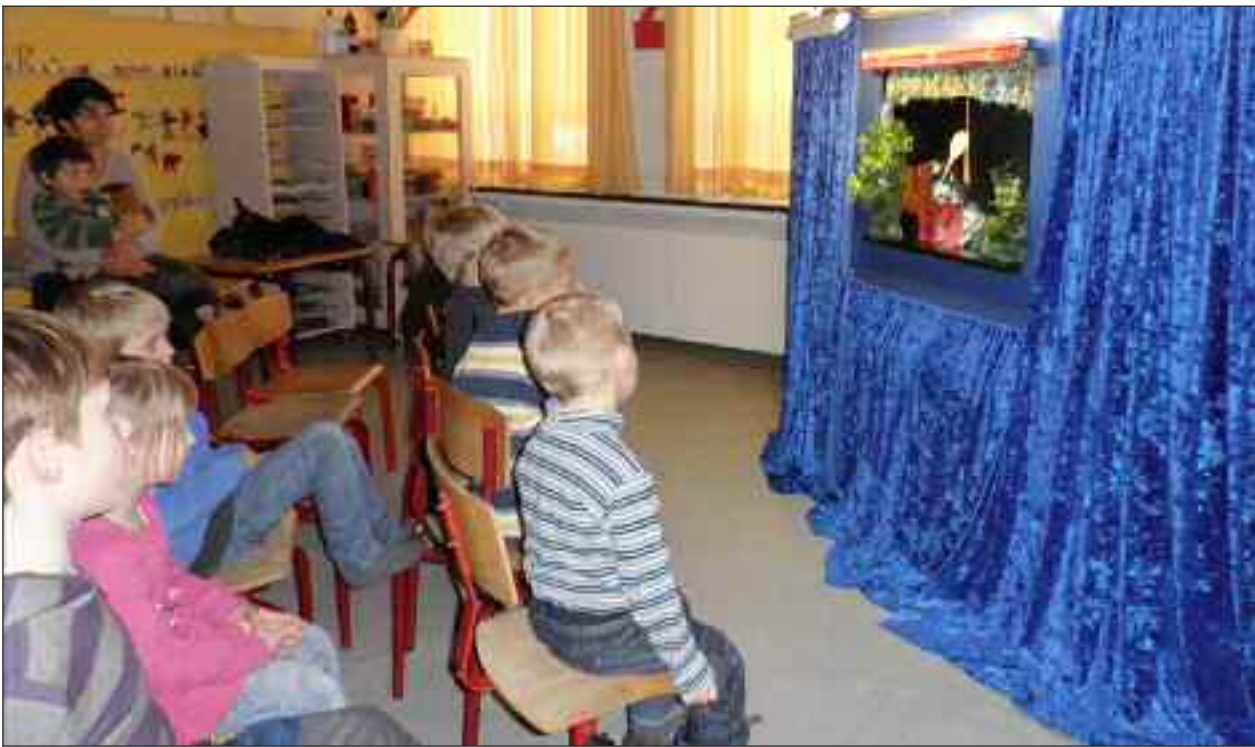
Dolas dukketeater, en succes hver gang.