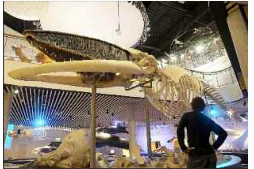
Fra Naturama i Svendborg.