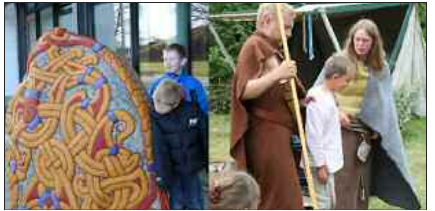
Kopi af Jellingstenen/ Rollespil.

Følgende program er lagt: Onsdag 6. juli: Ankomst og indkvartering på Vandel Efterskole. Torsdag 7. juli: Ravningbroen, anlagt af Harald Blåtand 979-80 over de våde enge i Vejle Ådal. Bagved ligger resterne af forsvarsborgen Trolborg Ring. Fredag 8. juli: Jelling, hvor Harald Blåtand havde sit hovedsæde og anlagde de to kæmpestore høje. Deltagerne oplever de nyeste arkæologiske udgravninger om datidens storslåede anlæg. Vingsted Historisk Værksted og jernalderlandsby, hvor deltagerne laver håndværk og er vikinger for en dag. Lørdag 9. juli: Den gamle markedsplads ved Hærvejen, Randbøl kirke og ned til Vejle Å, hvor handelsfolk,