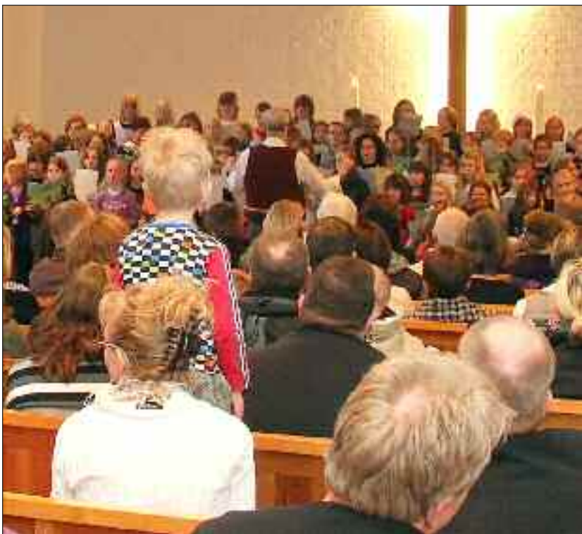
En fyldt kirke til "David". Der lyttes, men der skal også ses.