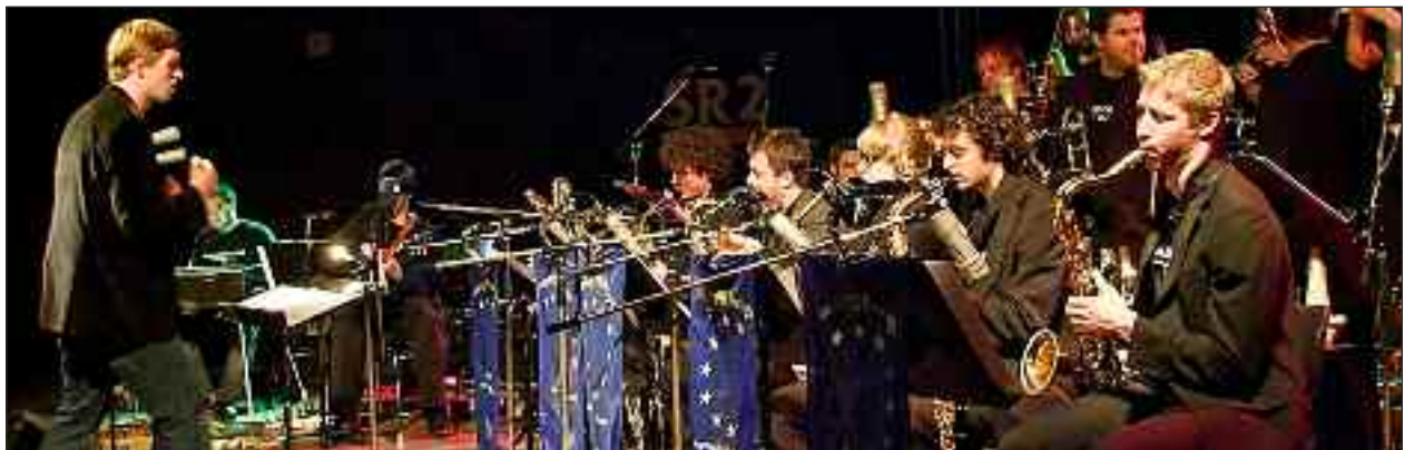
European Jazz Orchestra - 15. april i Slesvig.

[KONTAKT] SSF indbyder alle jazzvenner til en stor og flot koncert med European Jazz Orchestra fredag den 15. april kl. 19.30 på A.P. Møller Skolen i Slesvig.