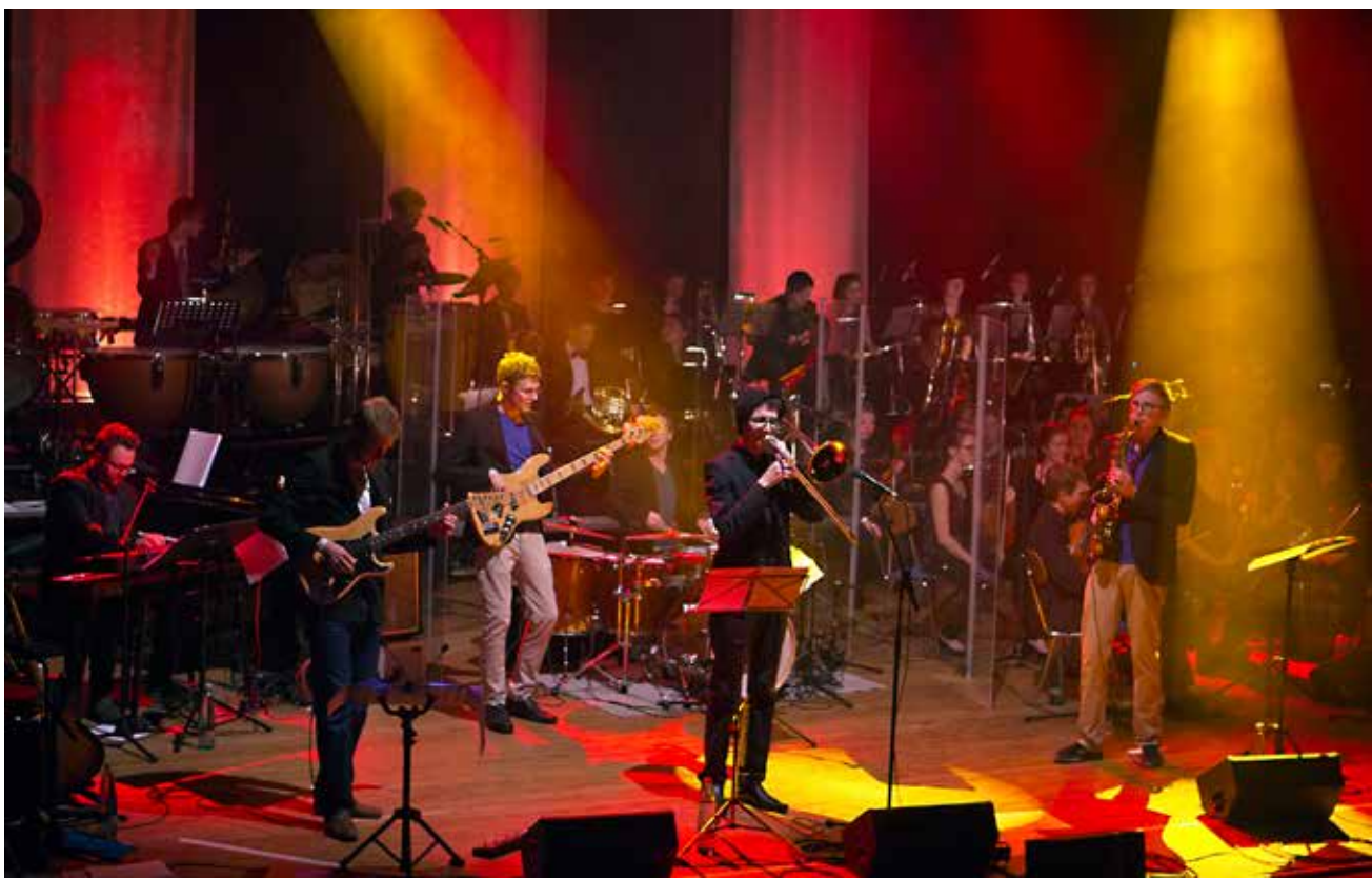
»Highfive & Symphony«.