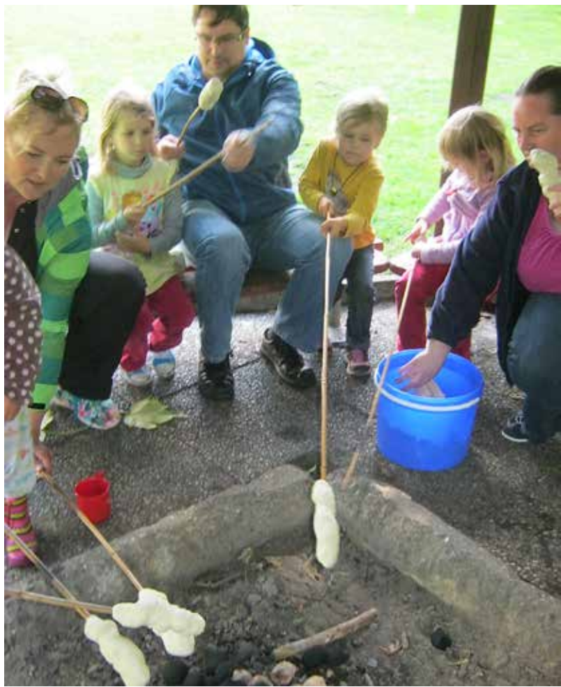
Familie-FDF afsluttes med fælles spisning ved Ugleredens bålsted: snobrød bagt over gløderne, franske hotdogs som hovedret, og lune bananer med chokolade som dessert.