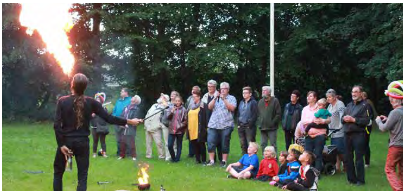
Art Petit afsluttede arrangementet med et flot ildshow.