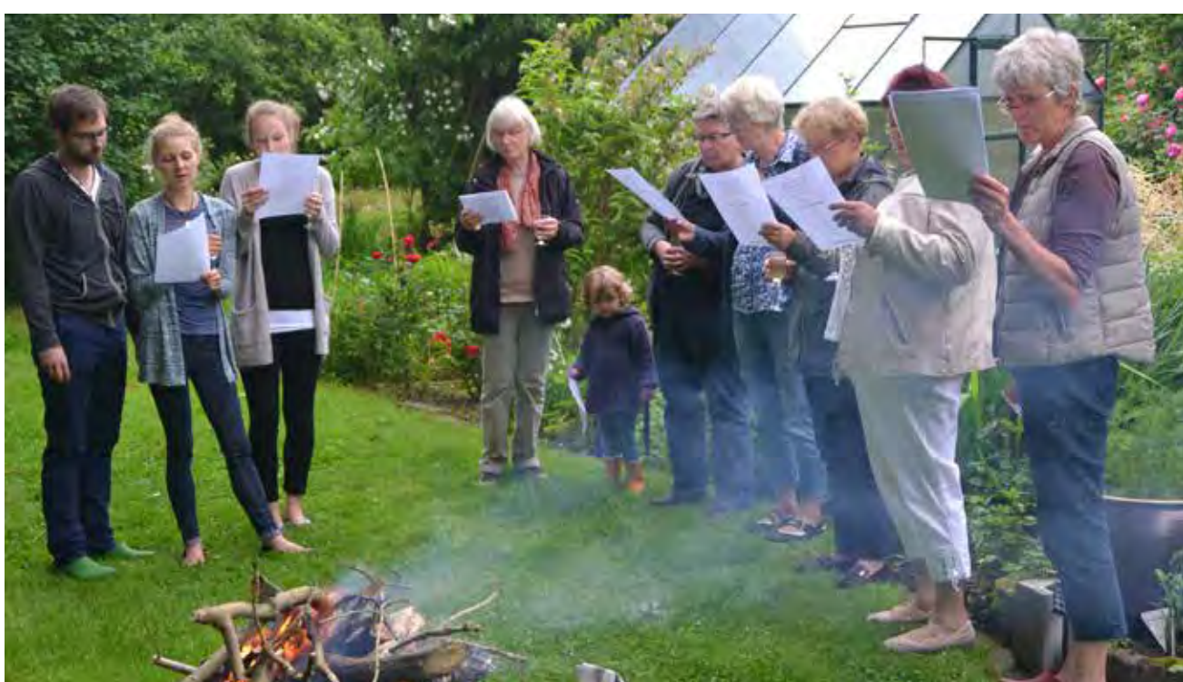
Sankthans i haven hos Poggensees i Velt/ Follervig.