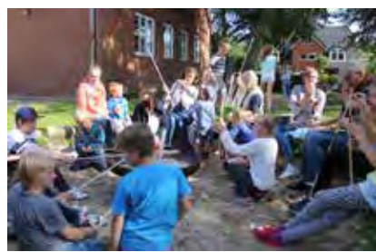
Gang i snobrøds-bagningen.