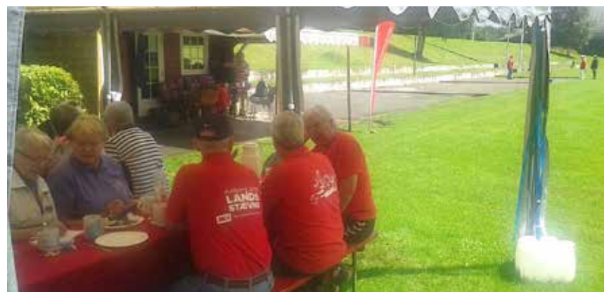
Nogle hyggede sig ved bordene, andre på banerne.