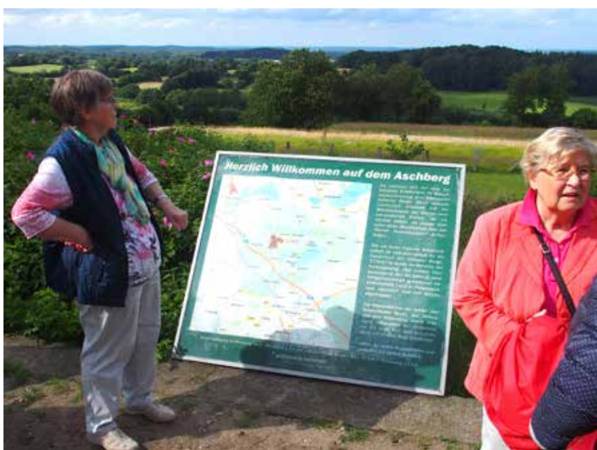
Lutter solskin og storslået udsigt i Hytten Bjerge.