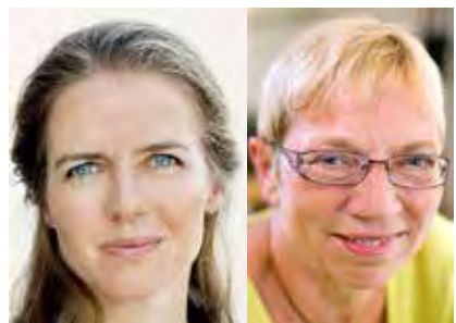
Ministerin für Kinder, Unterricht und Gleichstellung Ellen Trane Nørby und Europa-, Justiz- und Kulturministerin Anke Spoorendonk begleiten das grenzüberschreitende Projekt.

Spoorendonk. Auch die dänische Ministerin begrüßt die grenzübergreifende Initiative. »Ich freue mich sehr, das Projekt und die Zusammenarbeit in Zukunft zu verfolgen. Ich hoffe und glaube, dass