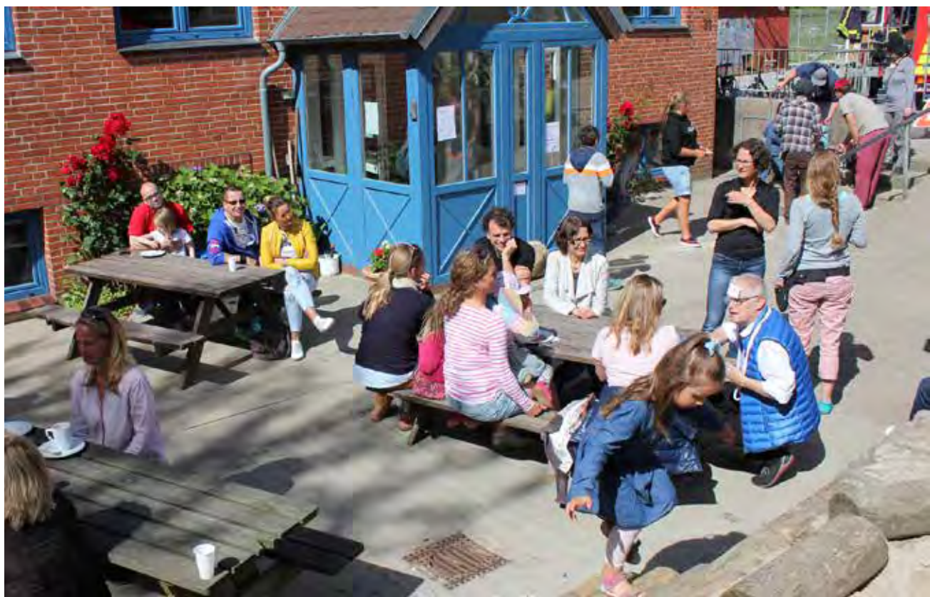
Tryllekunstneren Magic Comedy (t.h. med vatjakken) samler opmærksomhed.