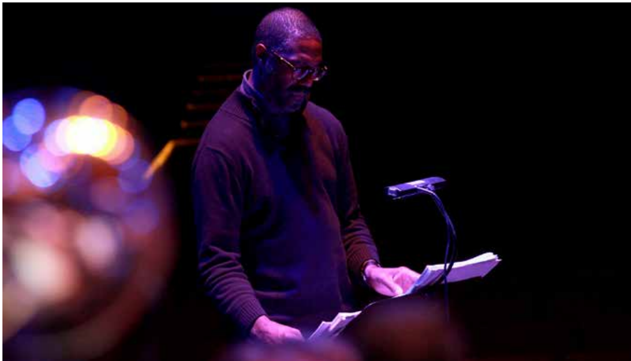
Flensborghus får fredag 10. februar besøg af en af verdens bedste bigband-dirigenter – Dennis Mackrel. Denne gang står han i spidsen for DR Big Band, som optræder ved SSF's jubilæumskoncert nr. 100.