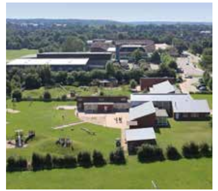
Hanved Danske Skole lægger tirsdag aften i næste uge lokaler til et stort fælles fremtidsmøde for samtlige danske foreninger og institutioner i distriktet.