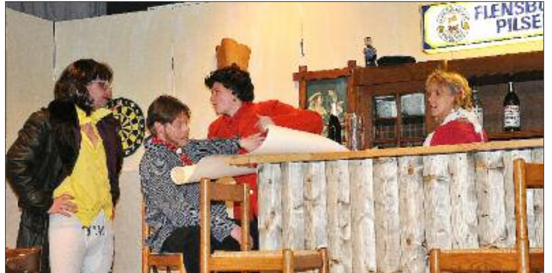
Action på scenen i Harreslev.