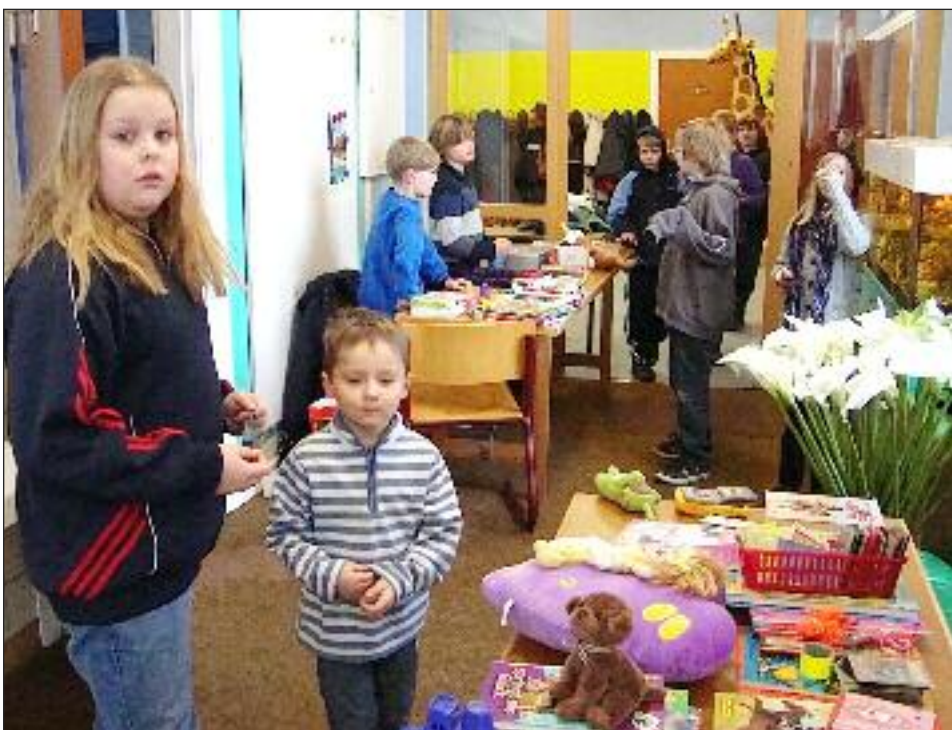
Masser af gode lopper.