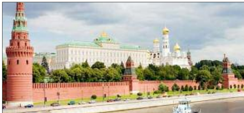
Moskau. (Foto: travelersdigest.com)

unseres nächsten Grundrechtes unserer FUEV-Charta - das Recht auf Sprache - einzuleiten. Wir erhoffen uns auch, Inspiration vor Ort durch die Erfahrung eines Vielvölkerstaates im Umgang mit Mehrsprachigkeit zu holen.