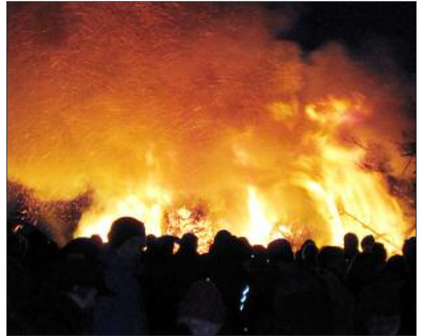
Eine Biike.