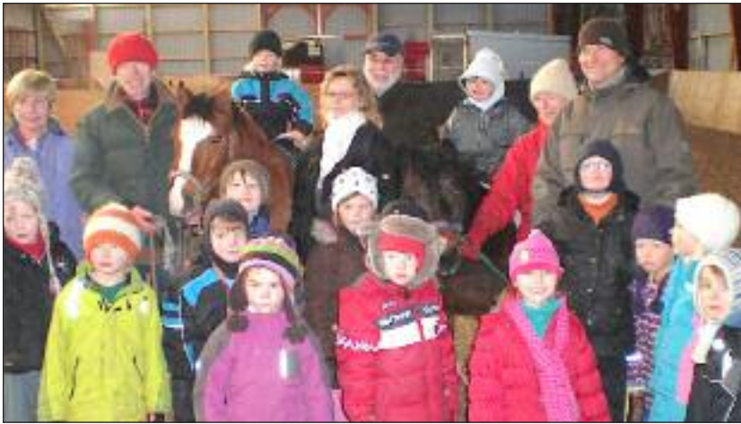
Glade ansigter i Feldenkrais' ridehal.