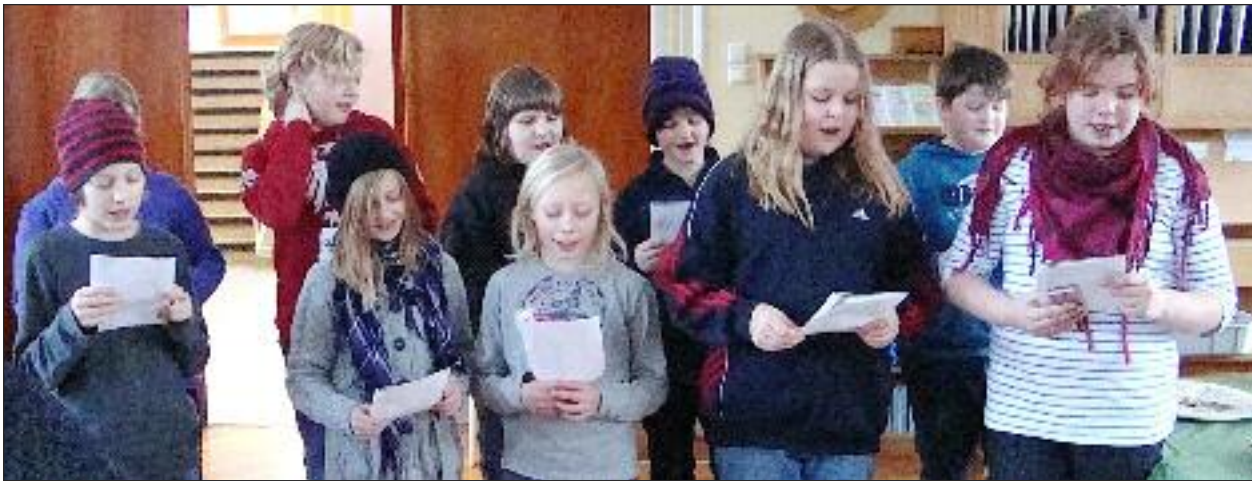
Eleverne underholder med sang.