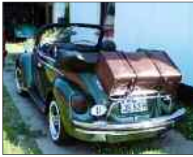
Initiativtagerens flotte VW 1303-ca-briolet.

kring et stambord med jævne mellemrum, benytte sig af facebook og køre med i f.eks. årsmødeoptog samt udstille køretøjerne på årsmødepladserne. På generalforsamlingen kan alt relevant drøftes. Der er forberedt et sæt vedtægter til godkendelse; der kan vælges en lille bestyrelse, og man er allerede nu på Facebook: Sydslesvig Veteranbil- og Youngtimerklub. Det er kredsens hhv. klubbens hensigt at søge SdU om medlemskab. Interesserede kan kontakte Jess på mail jsj@syfo.de .