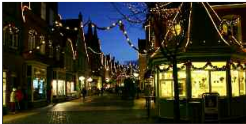
Tønder er en hyggelig by at julehandle i.

På Bredsted Danske Skole slår man kl. 16 dørene op for årets julestue. Talrige værksteder rundt om på skolen tilbyder fremstilling af julepynt og juleguf. Der danses om juletræ og luciapijerne optræder. Julestuen i Bredsted varer ved til kl. 20.