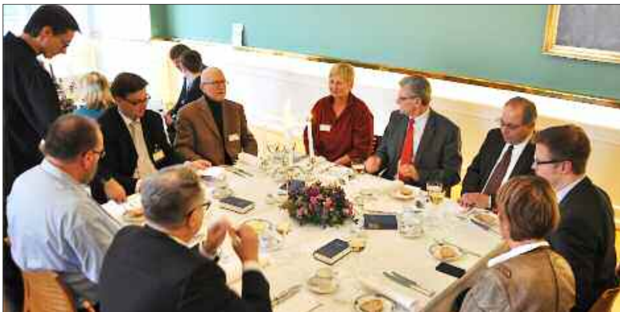
Formandsbordet ved receptionen på Christiansborg: Folketingets formand Mogens Lykketoft sammen med formænd/næstformænd fra de sydslesvigske organisationer/ institutioner, Sydslesvigudvalg og Grænseforening.