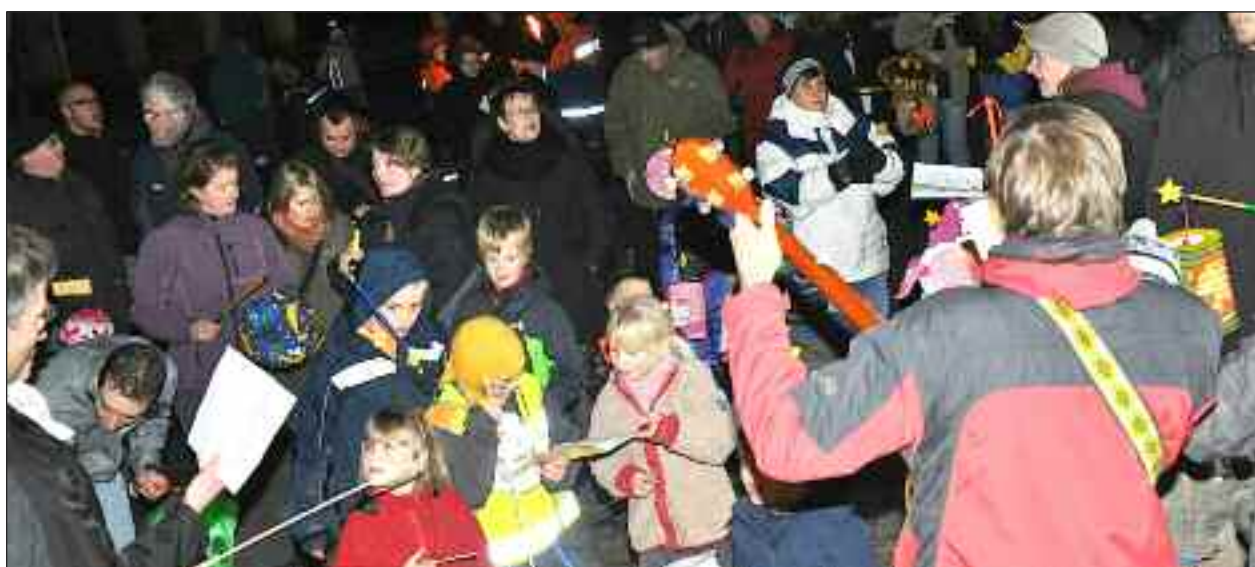
Fællessang og lanterneløb.