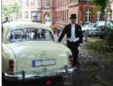
Et andet potentielt medlem og hans Mercedes-Benz Ponton.