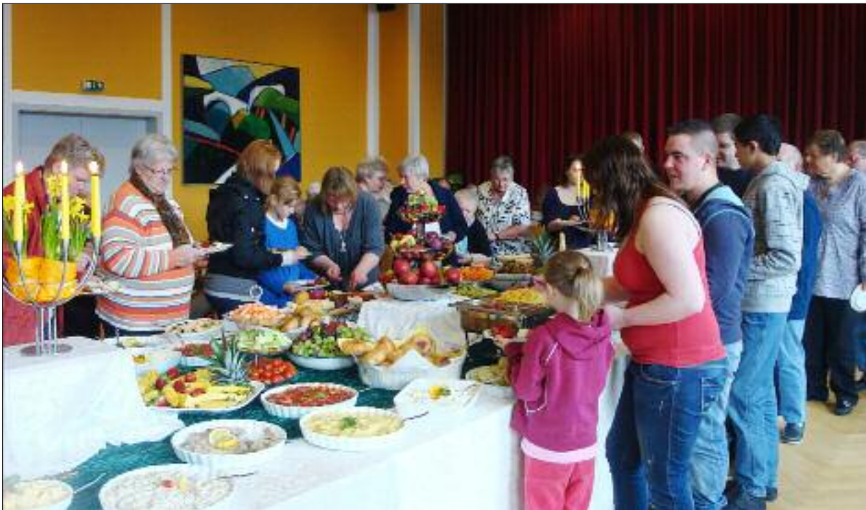
Rift om det flotte tagselvord sidste år.