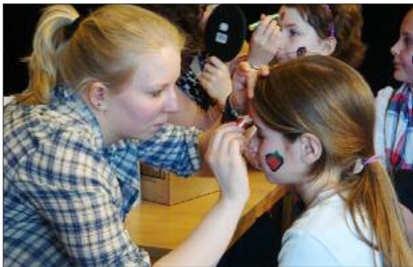
Ansigtsmaling for børn - også i år igen.

[KONTAKT] SSF Flensborg Amt har igen bestilt lækker mad og dækker op til familiebrunch på Flensborghus lørdag den 28. april. Dørene åbner kl. 9.30, så der er god tid til at finde sig en plads eller ens reserverede bord. Tag venner, naboer og familie med til denne hyggelige formiddag. Børnenes hyggehyørne bygges op med spil og ansigtsmaling. Prisen er 11 euro for voksne SSF-medlemmer og 16 euro for ikke-medlemmer. Børn under 3 år har gratis adgang, mens der for de 3-12 årige betales 6 euro. Billetter købes hos ens lokale SSF-bestyrelse eller på Dansk Sekretariat for Flensborg Amt, 0461 14408-155/-156 eller flamt@syfo.de. Husk også tilmelding til familieudflugten til Kerteminde den 12. maj.