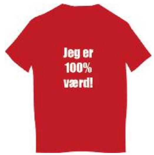
Medbring t-shirt, håndslag og 1,50 euro, og man er klar til aktionsdagen.