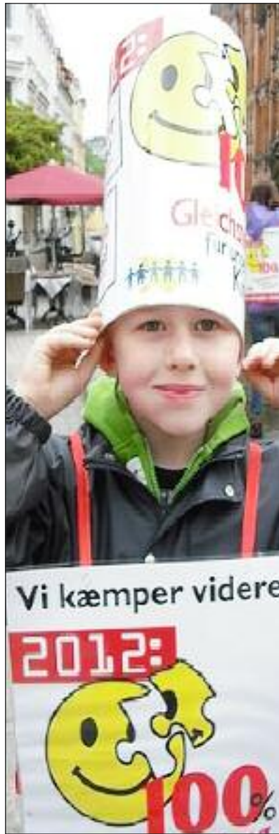
En, der er tvystartet, med hat og plakat. Andre følger efter 17. april i Skovlund.