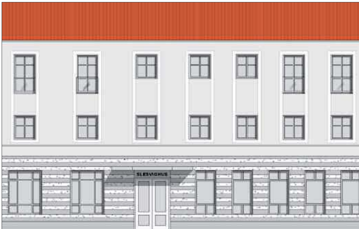
Den nye Slesvighus-facade i en arkitekttegning af Glenn W. Dierking fra Flensborg.