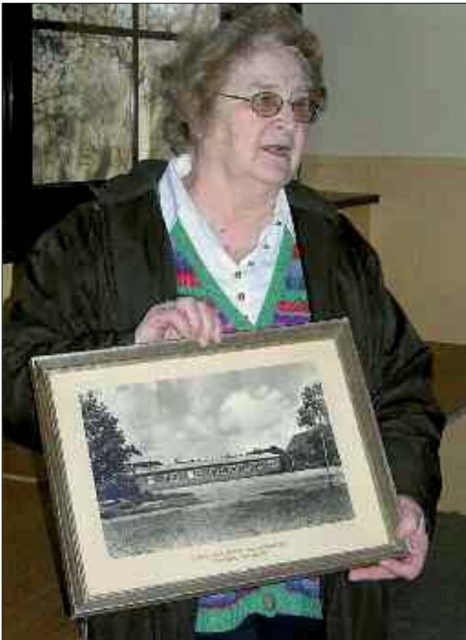
Der er stadig medlemmer, der kan huske den første danske skole i Arnæs.