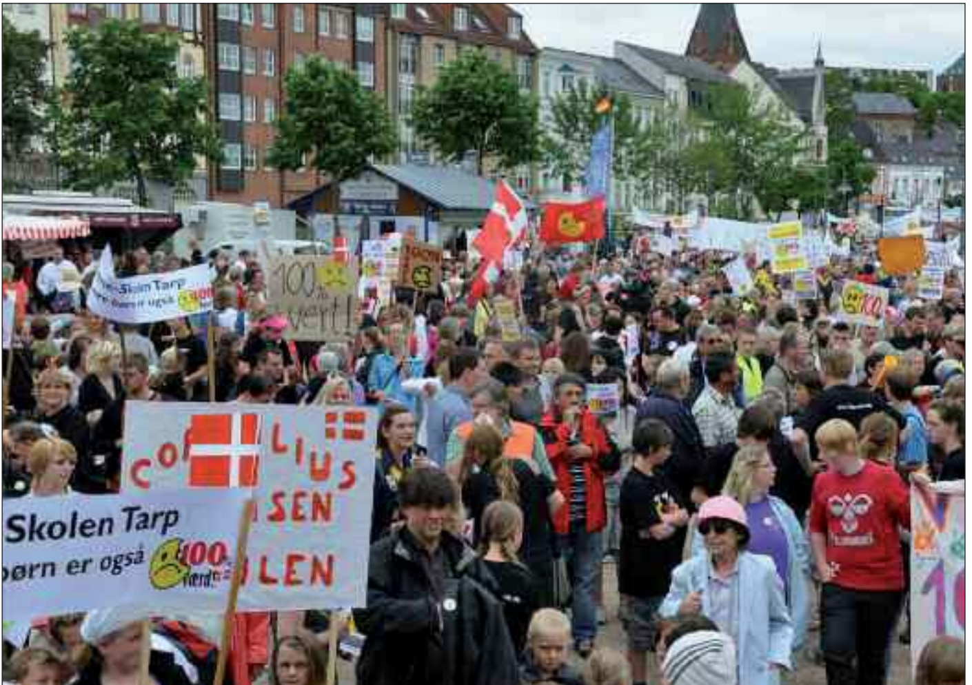
Over 6.000 mennesker fra mindretal og flertal demonstrerede alene i Flensborg den 26. juni sidste år. Ved i alt syv demonstrationer rundt omkring i Sydslesvig nåede tallet op på over 15.000.

Erklæringerne er således ikke udtryk for mindretalsjura, men mindretalspolitik.