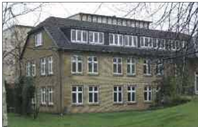
Pædagogisk Psykologisk Rådgivning hos Dansk Skoleforening for Sydslesvig har til huse i Wrangelstraße i Flensburg.