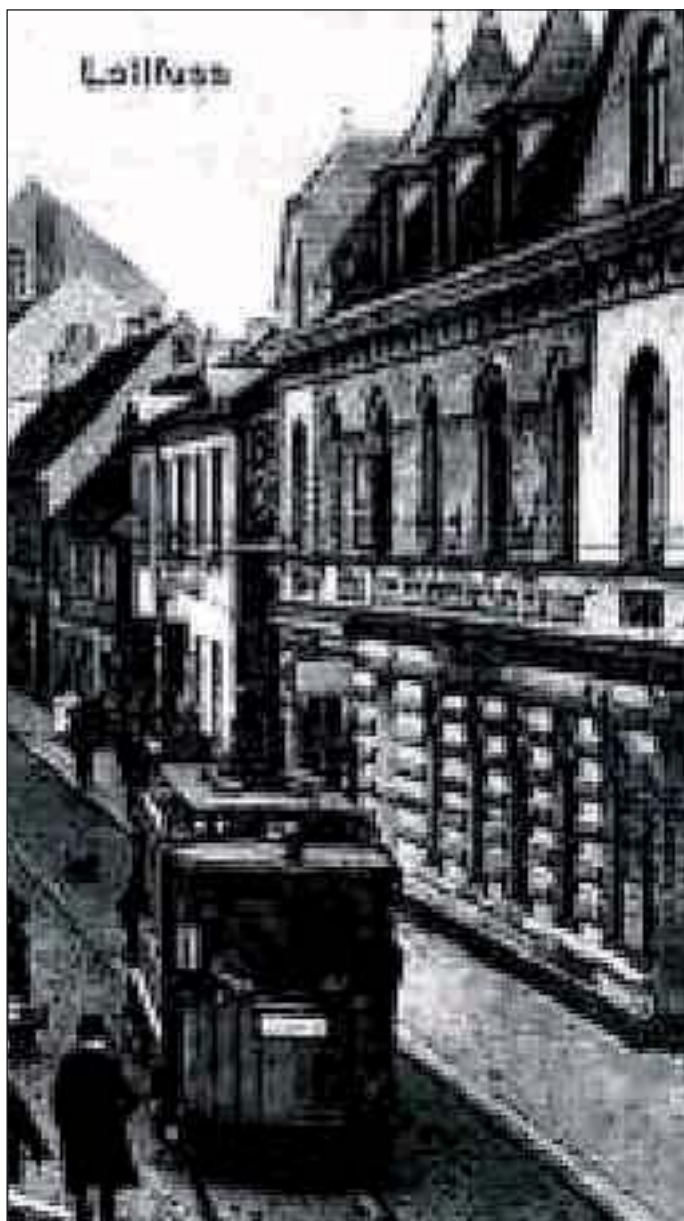
I 1908 var Slesvighus endnu »Holsteinisches Haus«