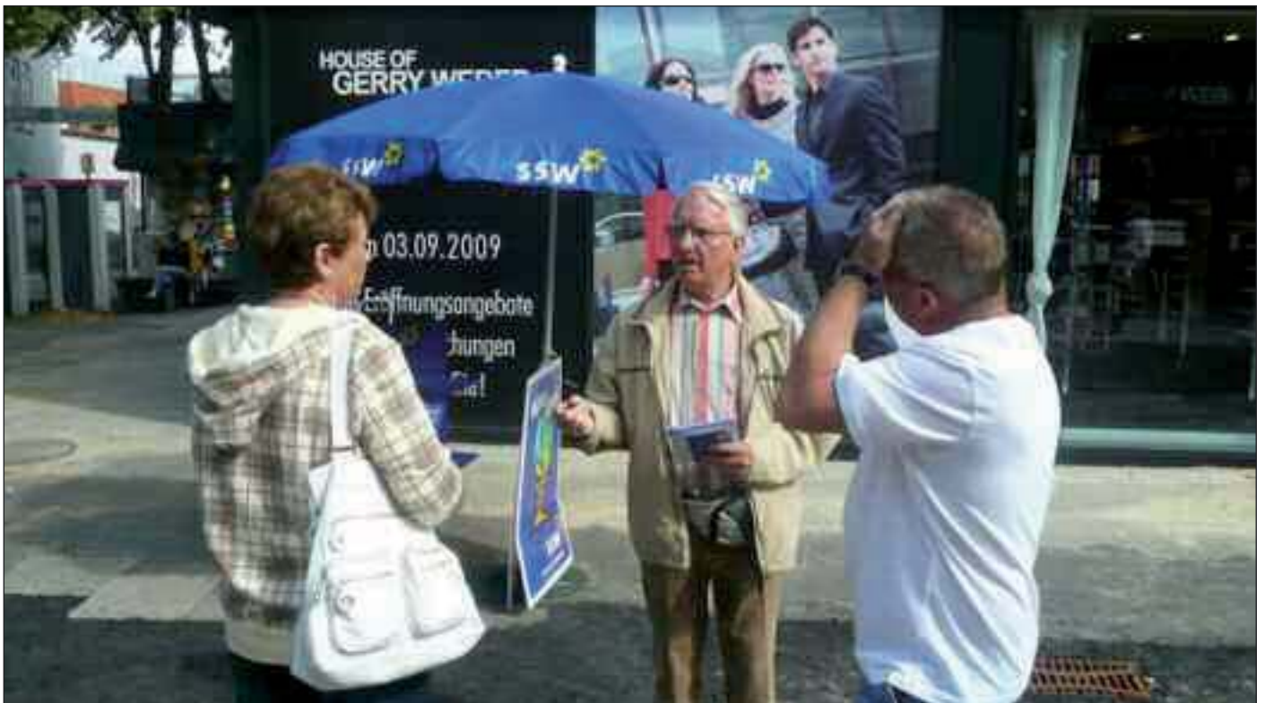
Arbejdsgruppen SSF/SSW Holsten-Hamborg yder kontant hjælp ved gadevalgkampe.