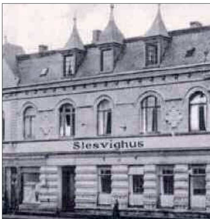
Slesvighus i 1923.