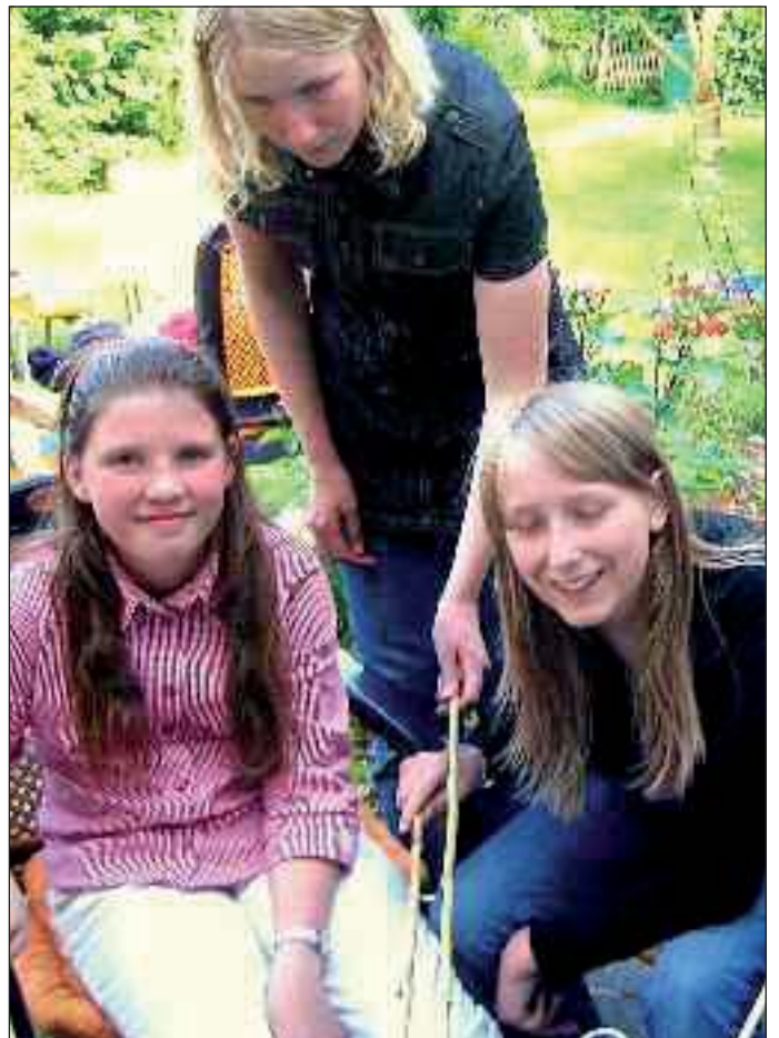
Børnene er med, når der holdes fest i St. Peter Ording. Måske er næste generation alligevel sikret.