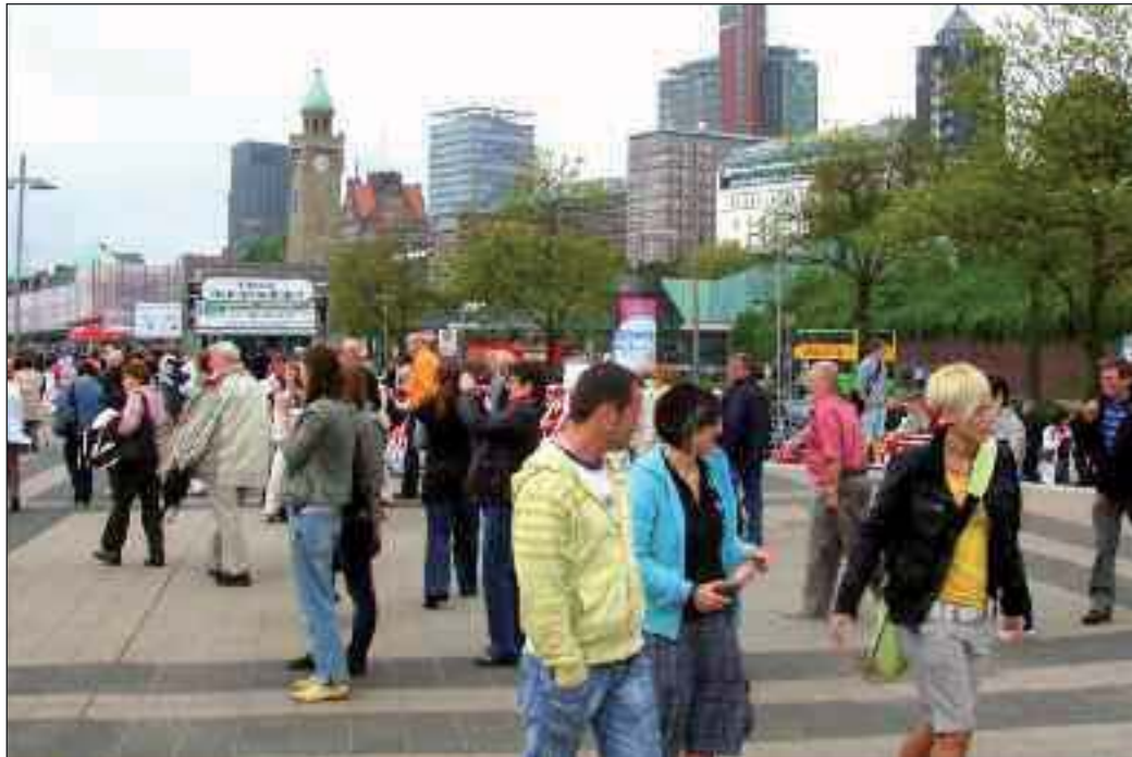
Hamborg som det politiske, økonomiske og selskabelige kraftcenter i Nordtyskland vil dominere en ellers mere landligt domineret nordstat totalt.

Slesvig-Holstens særlige muligheder i et tættere samarbejde med de nordtyske delstater. F.eks. har SSW allerede i 2007 krævet en udbygning af det nordtyske havnesamarbejde, noget som de tyske pariter først har taget op meget senere. Spørgsmålet er nemlig, om en fusion virkelig gavner Slesvig-Holsten, udtaler landsformanden.