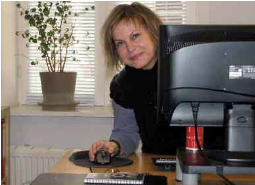
Foreningskonsulent vil komme tæt på distrikterne.