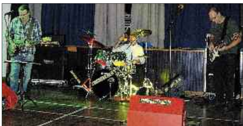
Johnny Madsen Jam spillede, som om de stod foran en fyldt sal i NCC.