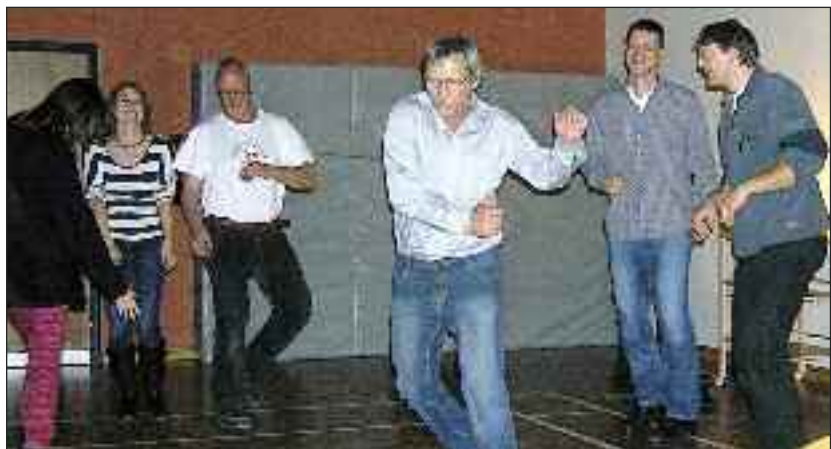
Det var svært at sidde stille. Nogle blev vist 20 år yngre i løbet af den aften.