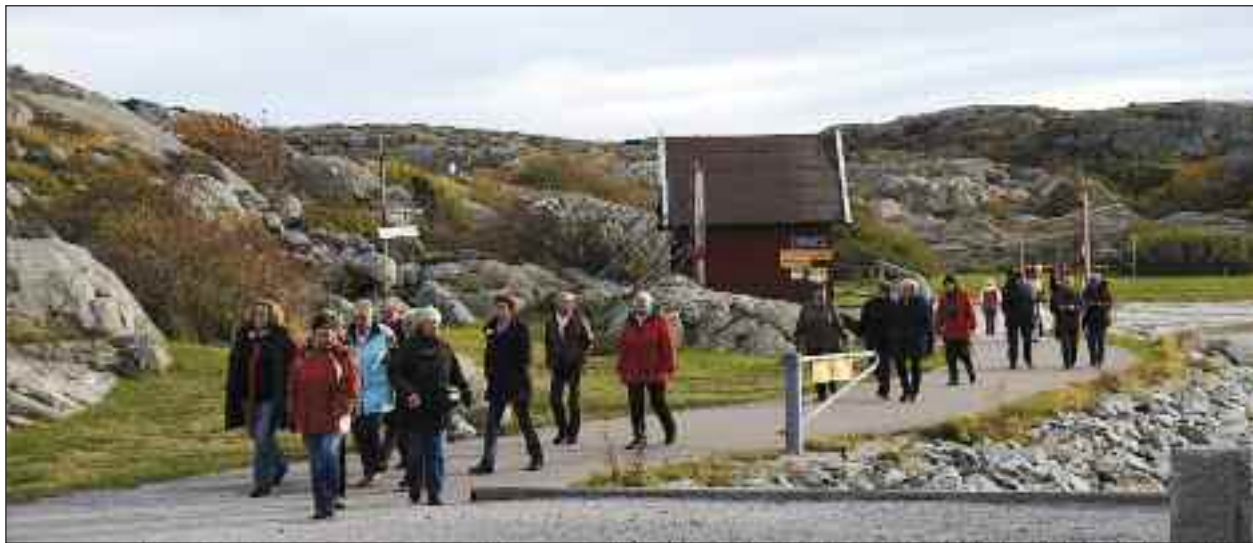
Gåtur i den svenske skærgård. (Fotos: privat)