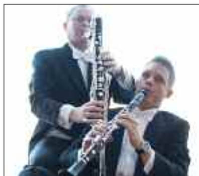
Blæserne i fokus.