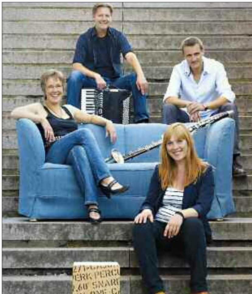
Phønix i Vanderup – alle velkomne til folkkoncerten.