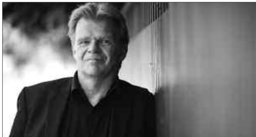
Forfatteren Einar Már Guðmundsson – i Flensborg 13. november.