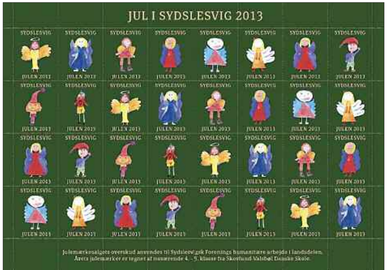
Julemærkesalgets overskud anvendes til Sydslesvigsk Forenings humanitære arbejde i landsdelen. Årets julemærker er tegnet af eleverne 4. - 5. klasse fra Skovlund-Valbøl Danske Skole.