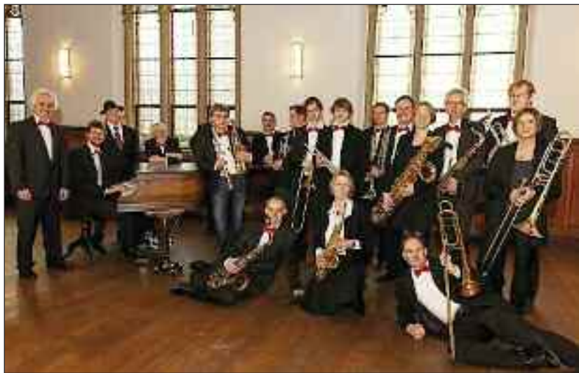
Jazzcoast Orchestra næste uge fredag i Egernførde.