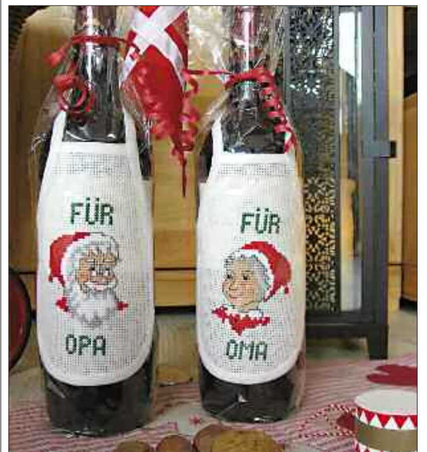
Var det noget?