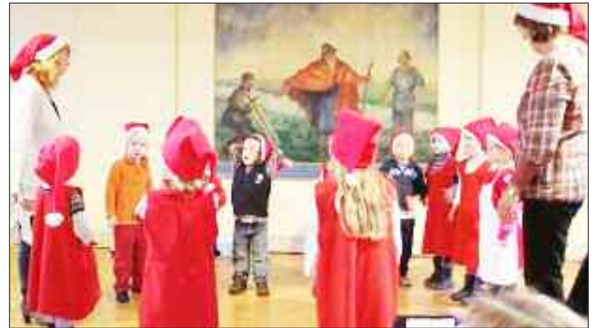
Børnehavenisserne danser i ring.