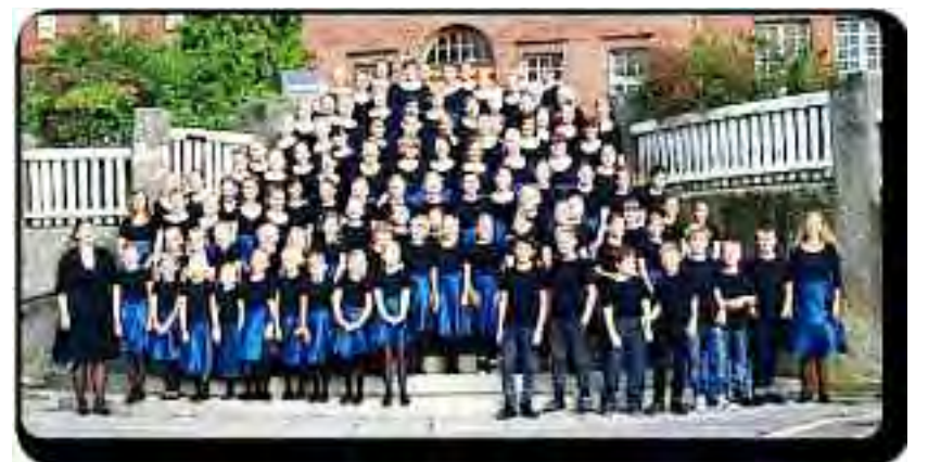
Sønderjysk Pigeorkester glæder sig til julegalla sammen med Sønderjyllands Symfoniorkester.