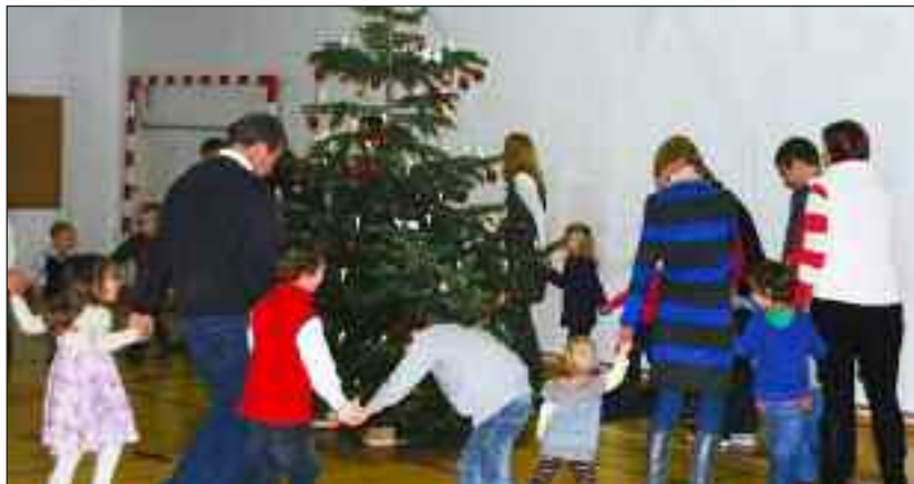
Børn og voksne i kærlig krans rundt omkring træet, vandrende hånd i hånd med hverandre.