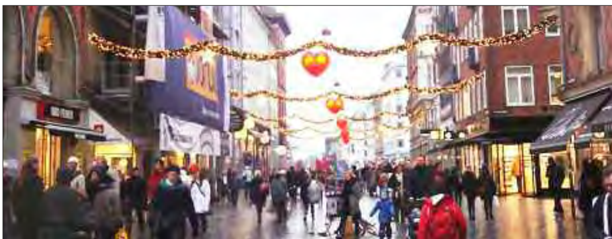
Strøget i København - altid et shoppingbesøg værd, selv i klamt, vådt og koldt vejr.