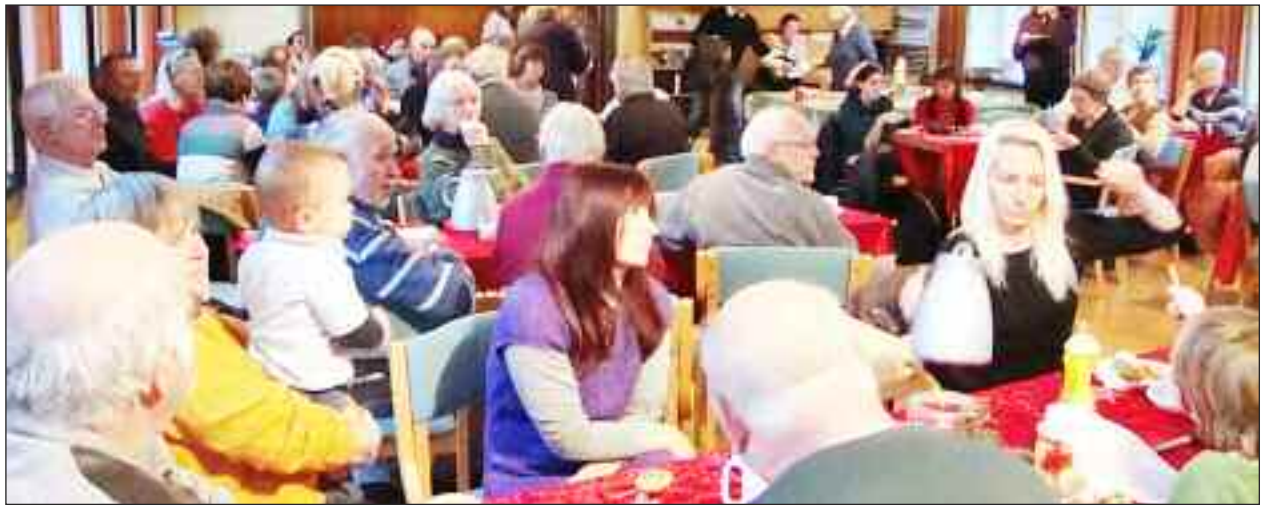
Et mylder af mennesker i salen.