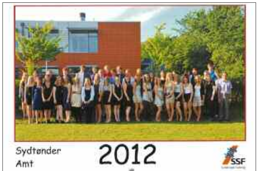
Afgangselever pryder kalenderens forsige.

Alt i alt har redaktionsudvalget og amtskonsulenten atter fået stablet et nyttigt stykke værktøj på benene med masser af læsestof. Den er god at have ved hånden til hverdag, og så er det jo heller ingen skade til, at man allerede nu kan