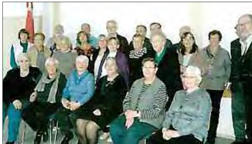
»Familiefoto« med gæster og værter.