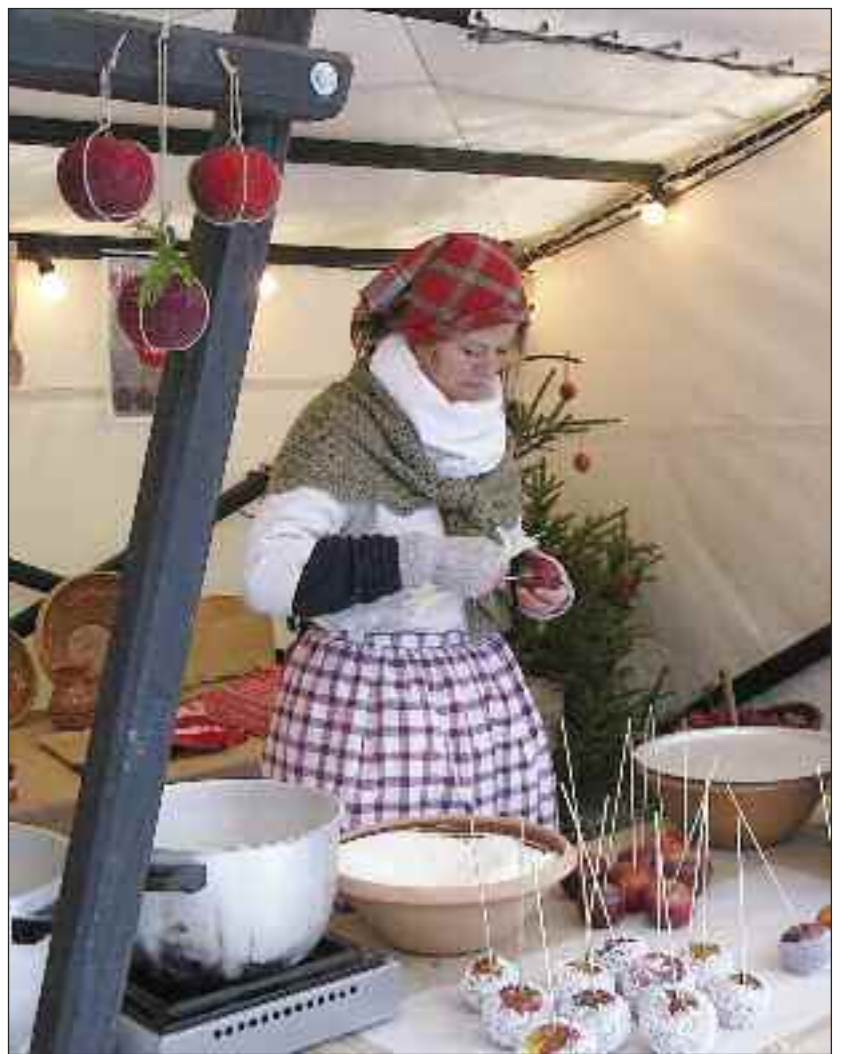
Søde piger tilbyder gammeldags søde sager.