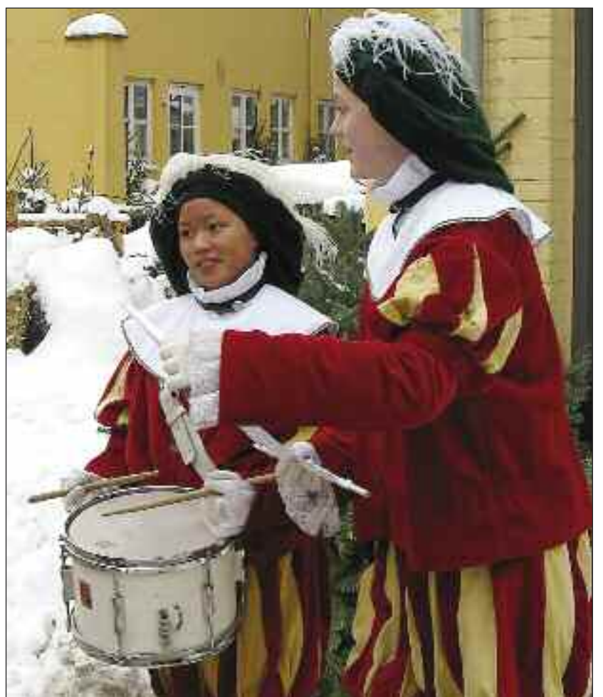
Unge i kostumer og med musik på H.C. Andersens julemarked i Odense.

Som Danmarks tredjestørste by råder Odense over en fin gågade med gode butikker, men vil man noget ganske andet, så er der Bazar Fyn i gåafstand fra gågadenettet. Det er et eksotisk indendørs marked med 65 forretninger og spisesteder, hvor mad og ting fra alverdens lande kan ses og nydes. Butikkerne har åbent til kl. 18. Bazaren er indrettet i en gammel fabriksbygning og er i sig selv et besøg værd. Den ligger i Skibhuskvarteret, et oprindeligt arbejderkvarter, som er blevet forvandlet til et hyggeligt område med secondhand butikker, spisesteder og lokale cafeer. Pris: 14 meuro for voksne SSF-medlemmer, 20 euro for voksne ikke-medlemmer, 6 euro for børn op til 18 år. Små børn 0-3 år kører med gratis. Bindende tilmelding og betaling skal ske frem til fredag den 22. november på Dansk Sekretariat for Flensborg amt, tlf. 0461-14408 155 eller 156. Der er begrænset antal pladser.