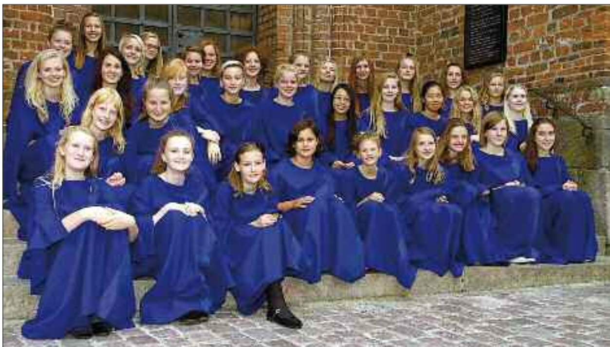
Haderslev Domkirkes Pigechor.