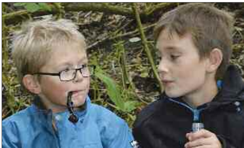
Endnu har EU ikke forbudt lakridspiben: De mindste FDFere øver sig på FDF-sangen "Dampen er oppe".