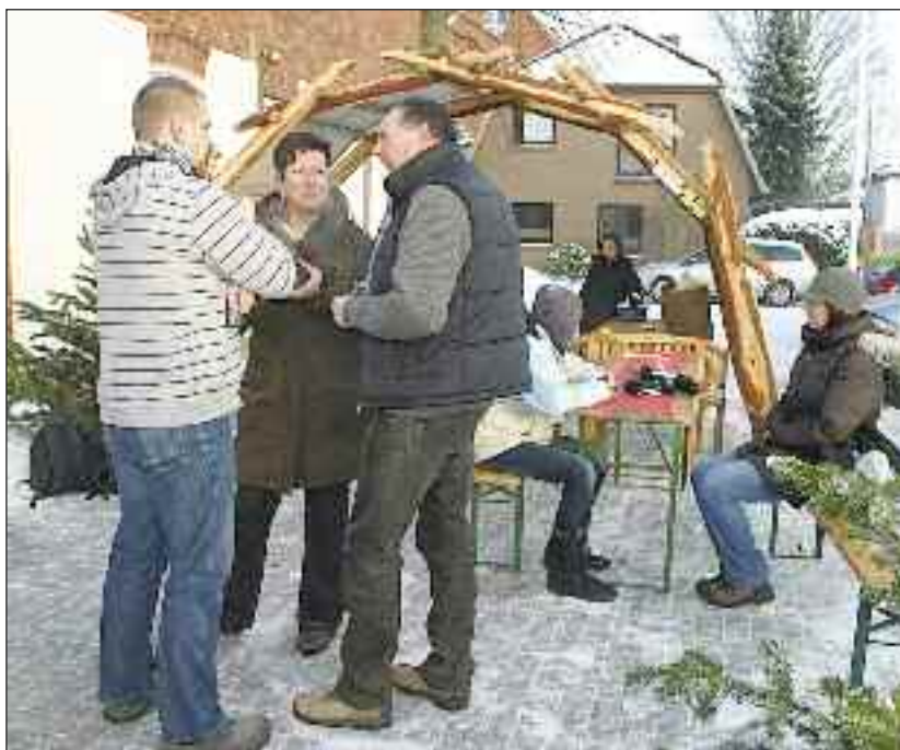
Fra en tidligere julebasar i Bydelsdorf.