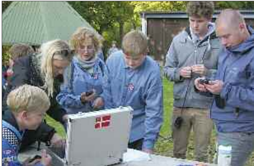
Væbnere gør klar til et GPS-løb.