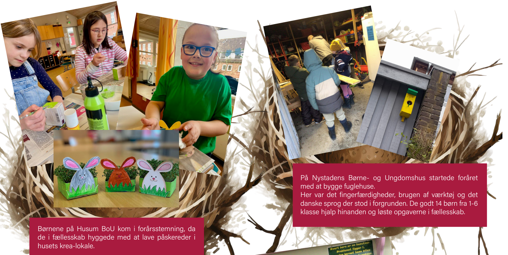
På Nystadens Børne- og Ungdomshus startede foråret med at bygge fuglehuse. Her var det fingerfærdigheder, brugen af værktøj og det danske sprog der stod i forgrunden. De godt 14 børn fra 1-6 klasse hjalp hinanden og løste opgaverne i fællesskab.