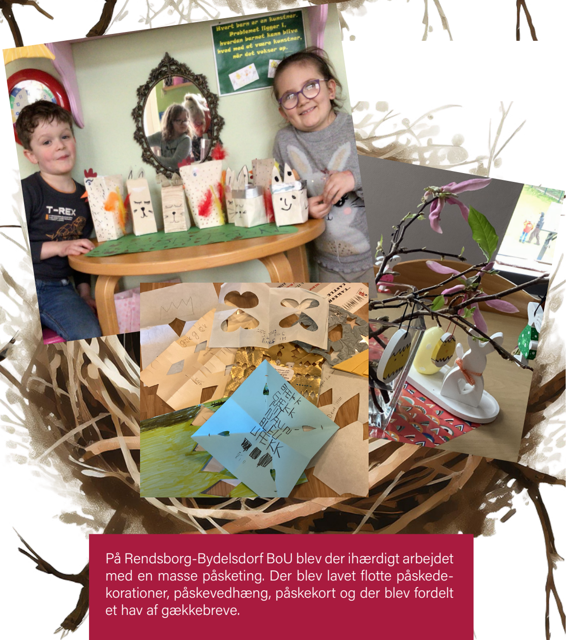
På Rendsborg-Bydelsdorf BoU blev der ihærdigt arbejdet med en masse påsketing. Der blev lavet flotte påskedekorationer, påskevedhæng, påsekort og der blev fordelt et hav af gækkebreve.