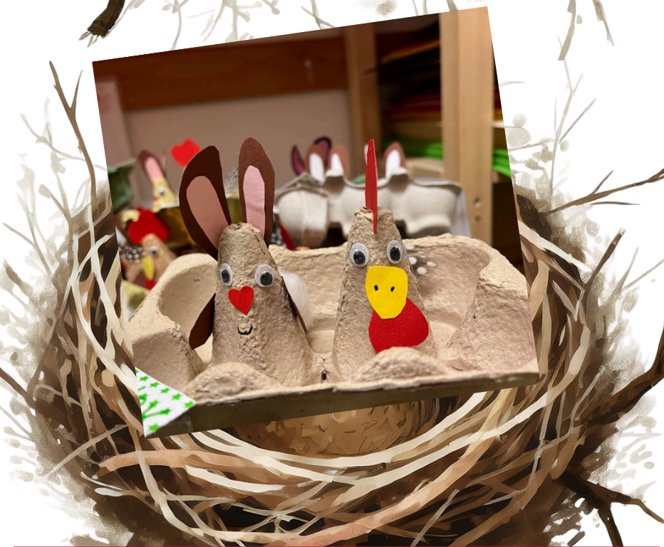
På Slesvig Børne- og Ungdomshus har børnene været i gang med at lave deres egne påskekurve. Med en bæredygtig tilgang er kurvene lavet af æggebakker. Bakkerne står klar på børnenes pladser og måske er de jo så heldige, at påkeharen kommer forbi med lidt chokolade.